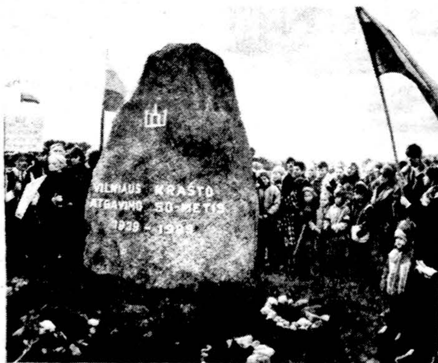
Spalio 28 d. netoli Masiagalos, kur kadaise buvo demarkacinė linija buvo atidengtas paminklinis akmuo ir pasodinta žuolų. Ant akmens užrašas: Vilniaus krašto atgavimo 50-metis 1939-1989.

Vakarų vokiečių žinių agentūra mano, kad demonstrantų galėjo būti beveik milijonas. Policija netrukė demonstrantams žygiuoti gatvėmis, kuriomis bet koks susisiekimas nebebuvo įmanomas. Į Pragę atvykusi