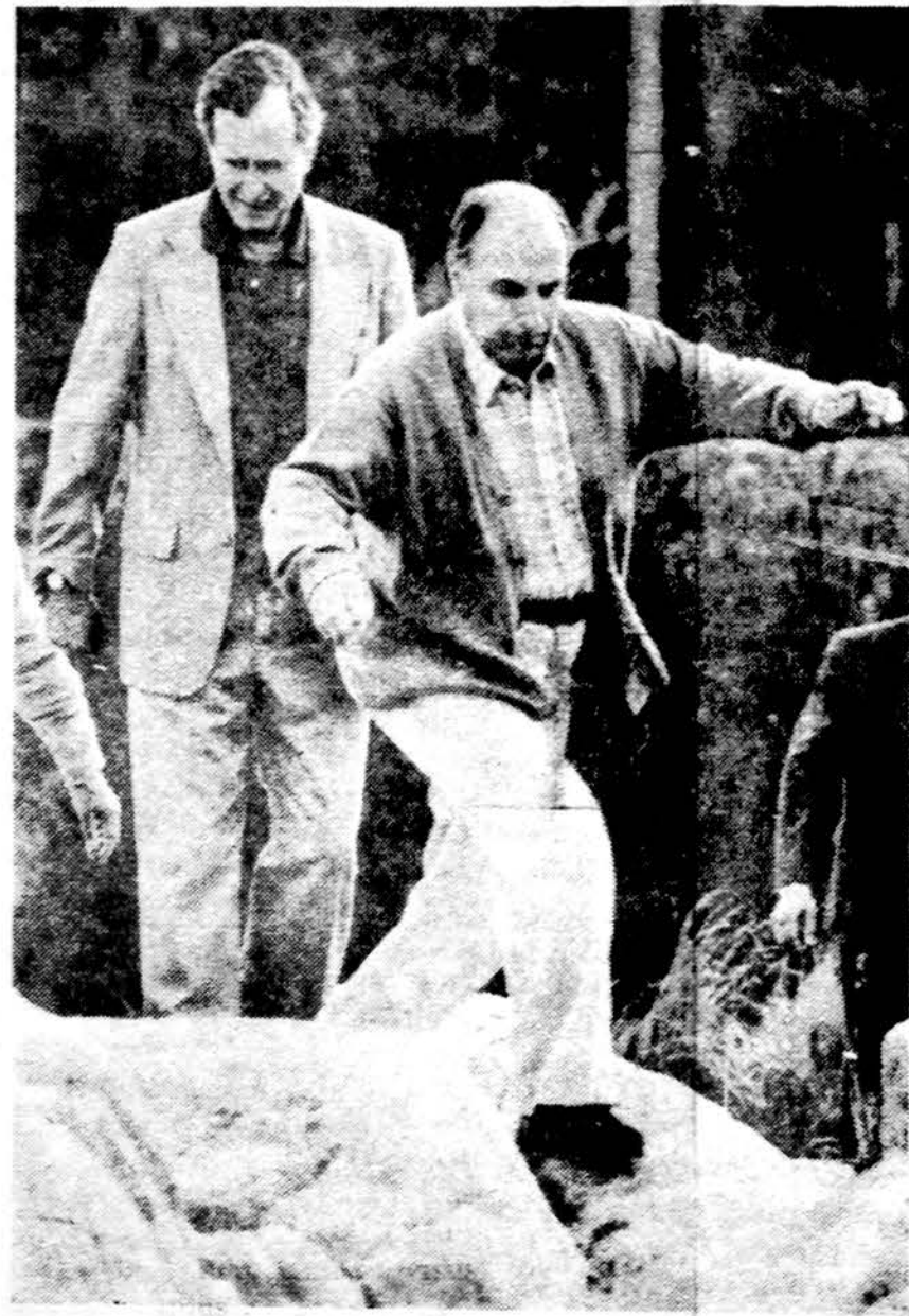
Prezidentas George Bushas lydi Prancūzijos prezidentą François Mitterrandą Keenepunkte, Meime valstijoje, kai jis buvo atvykęs neformaliems pasitarimams šį pavasarį. Čia buvo atvykę ir kitų valstybių vadai.

Libane parlamento sekmadienį išrinko naują prezidentą, kuris yra krikščionis ir patvirtino taikos planą baigti 14 metų trunkantį civilinį karą. Naujasis prezidentas Rene Moawad yra maronitas katalikas. Jo išrinkimu pasidžiaugė tuoj pat Sirija ir Amerika.