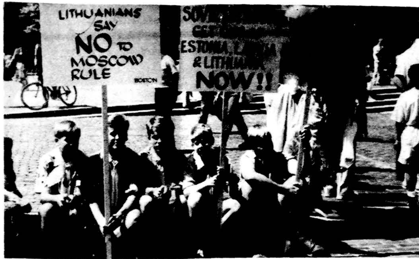
Skautai Juodojo kaspio dienos demonstracijoje Bostone.

Santara-Šviesa spalio 14 d. So. Bostono Lietuvių Piliiečių d-jos patalpose suruošė Kauno dramos teatro aktorius Valen-