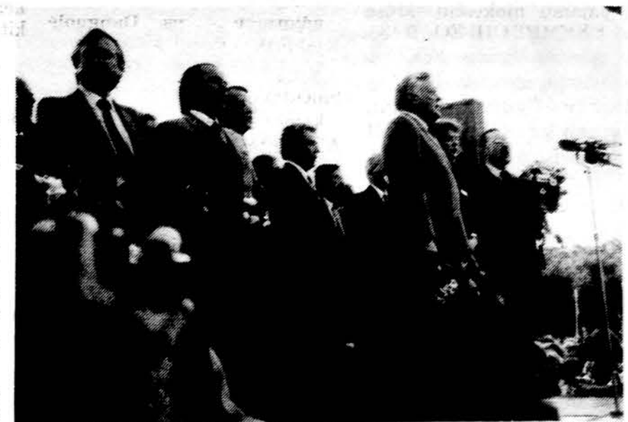
Pasibaigus mitingui, Lietuvos himną giedoti pradeda Sąjūdžio pirmininkas prof. Vytautas Landsbergis ir Algirdas Brazauskas. Jų užpakalyje – kiti deputatai.

M. Sleževičius nėra mums palikęs didesnio savo raštų ar prisiminimų palikimo. Nuolat užimtas kasdienine veikla, niekada neįstengė laiko studijiniam darbui. Tačiau aplamai spaudos darbas jam nebuvo svetimas. Vos įsijungęs į