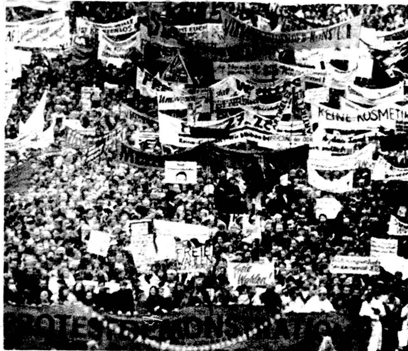
500,000 vokiečių demonstracijoje reikalauja laisvų rinkimų ir senosios sistemos pakeitimo.

— Čilės buvęs Komunistų partijos vadas Luis Corvalan, po 13 metų gyvenimo egzileje, sugrįžo į sostinę Santiago. Jis noris padėti opozicijos kandidatui laimėti rinkimus.