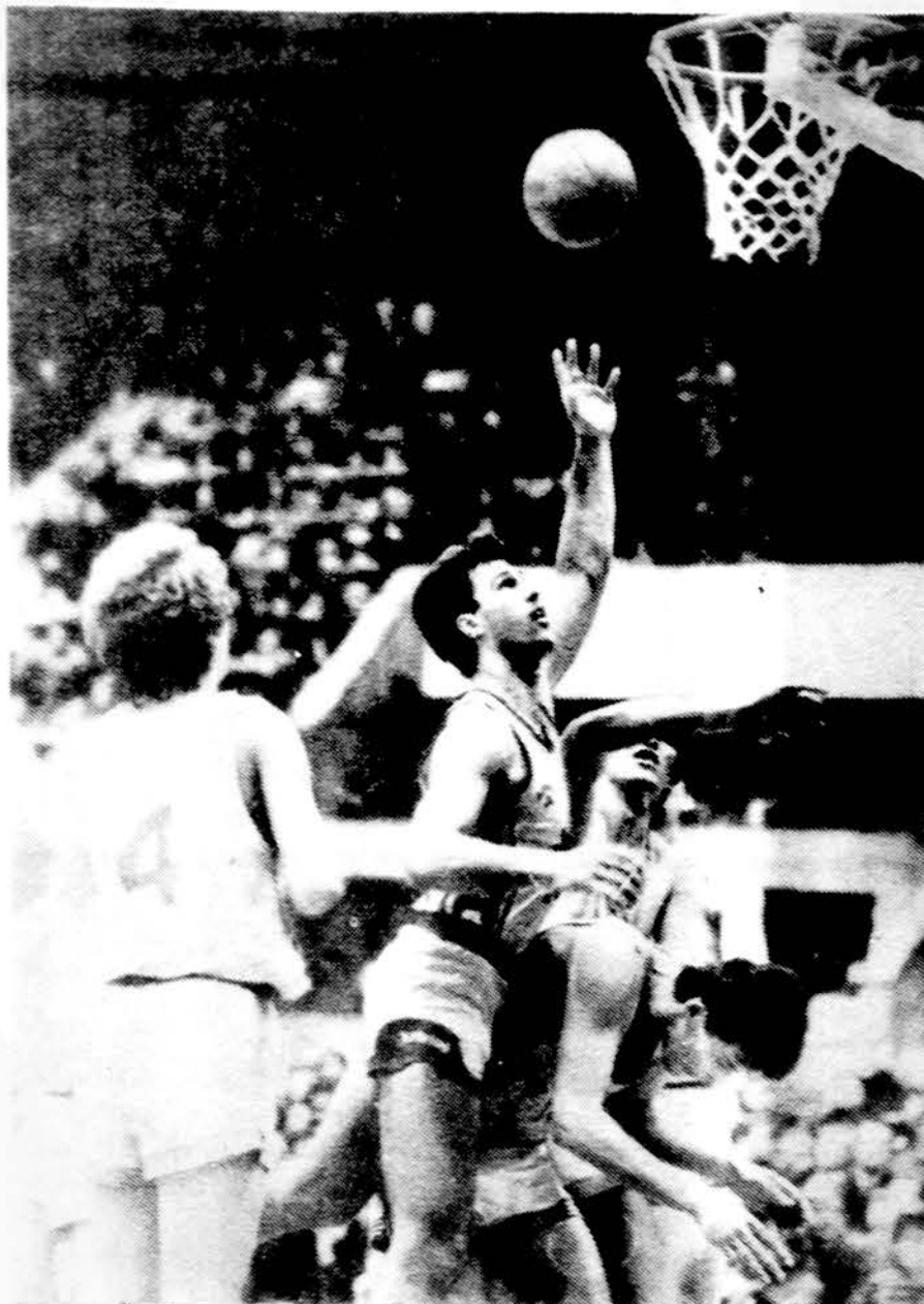
Šarūnas Marčiulionis aikštėje.

At. – Buvau pas gydytoją, kur nieko rimtesnio neteko pajusti, tačiau žmona truputį buvo išgąsdinta, kai nukrito kelios lempos. Bet tuoj atėjo kaimynai,