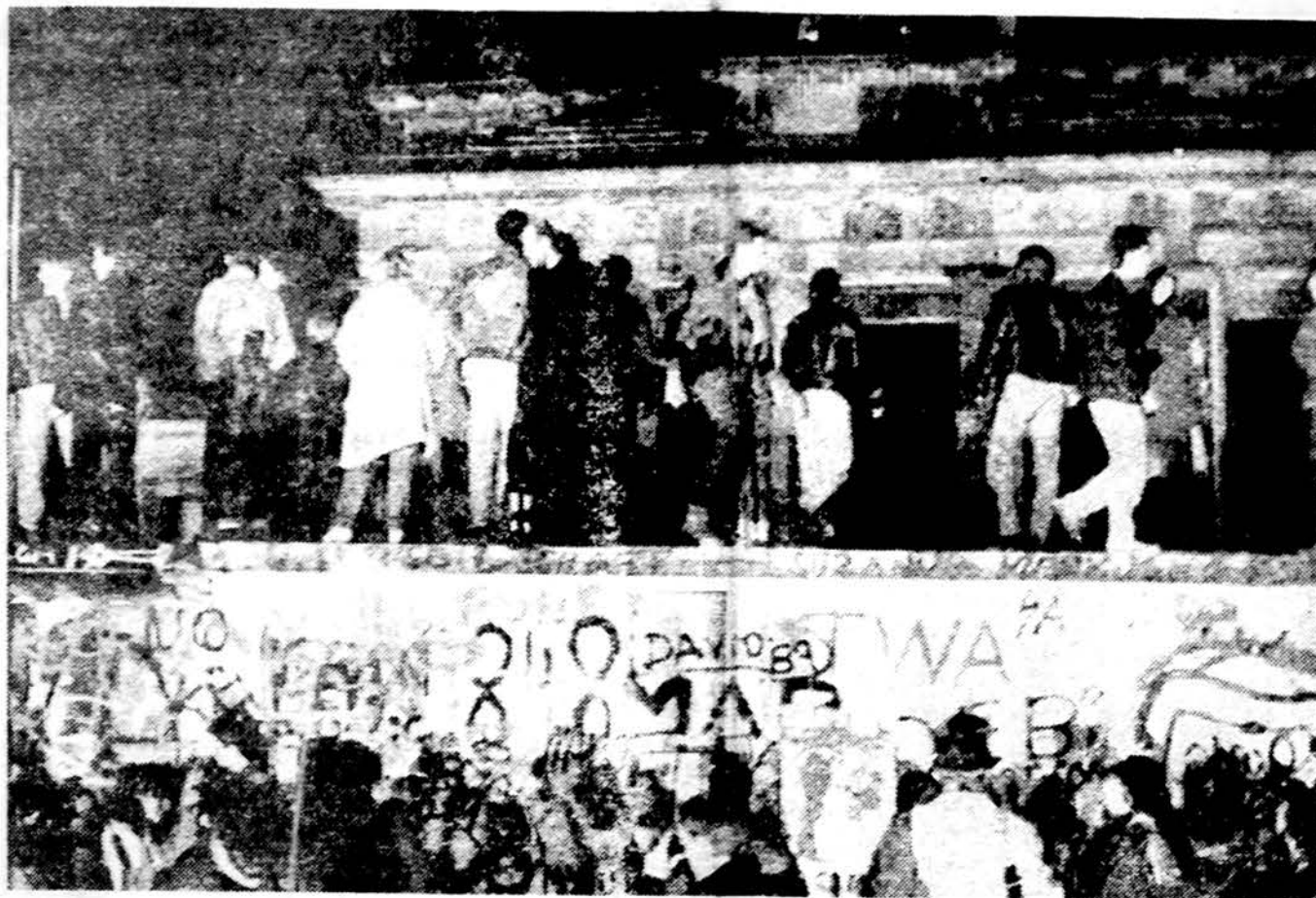
Rytų berlyniečiai šoka ant Berlyno sienos prie Brandenburgo vartų, kai Rytų Vokietija paskelbė atidaranti savo sienas laisvam vokiečių keliavimui.