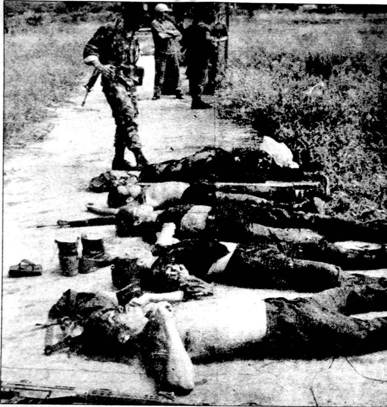
Kai Rytų Vokietijos komunistai atidarė Berlyno sieną ir pažadėjo laisvus rinkimus ir kitas svarbias reformas, tai Salvadoro komunistai pradėjo viešus puolimus nuversti teisėtai krašto vyriausybei. Čia matyti komunistų sukilėlių nužudytą Salvadoro kareivį netoli karinės bazės Salvadoro.