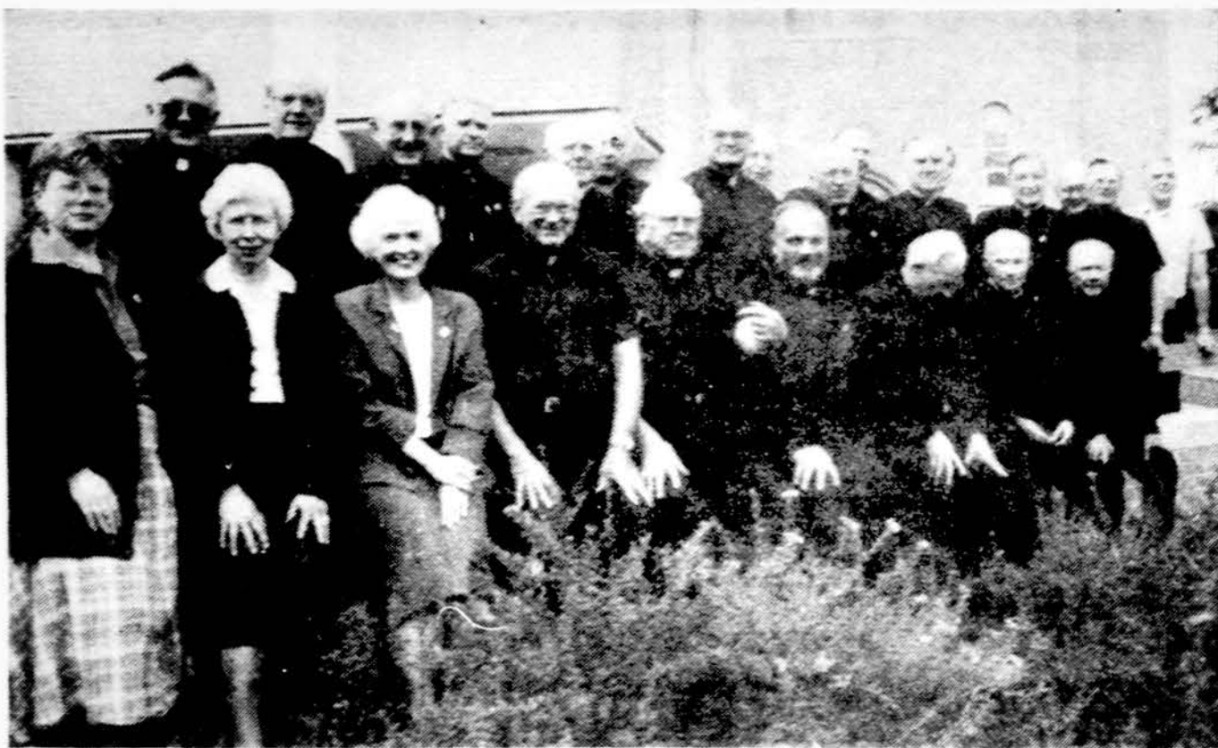
Kunigu Vienybės šeimo dalyvių dalis Putname, Ct.