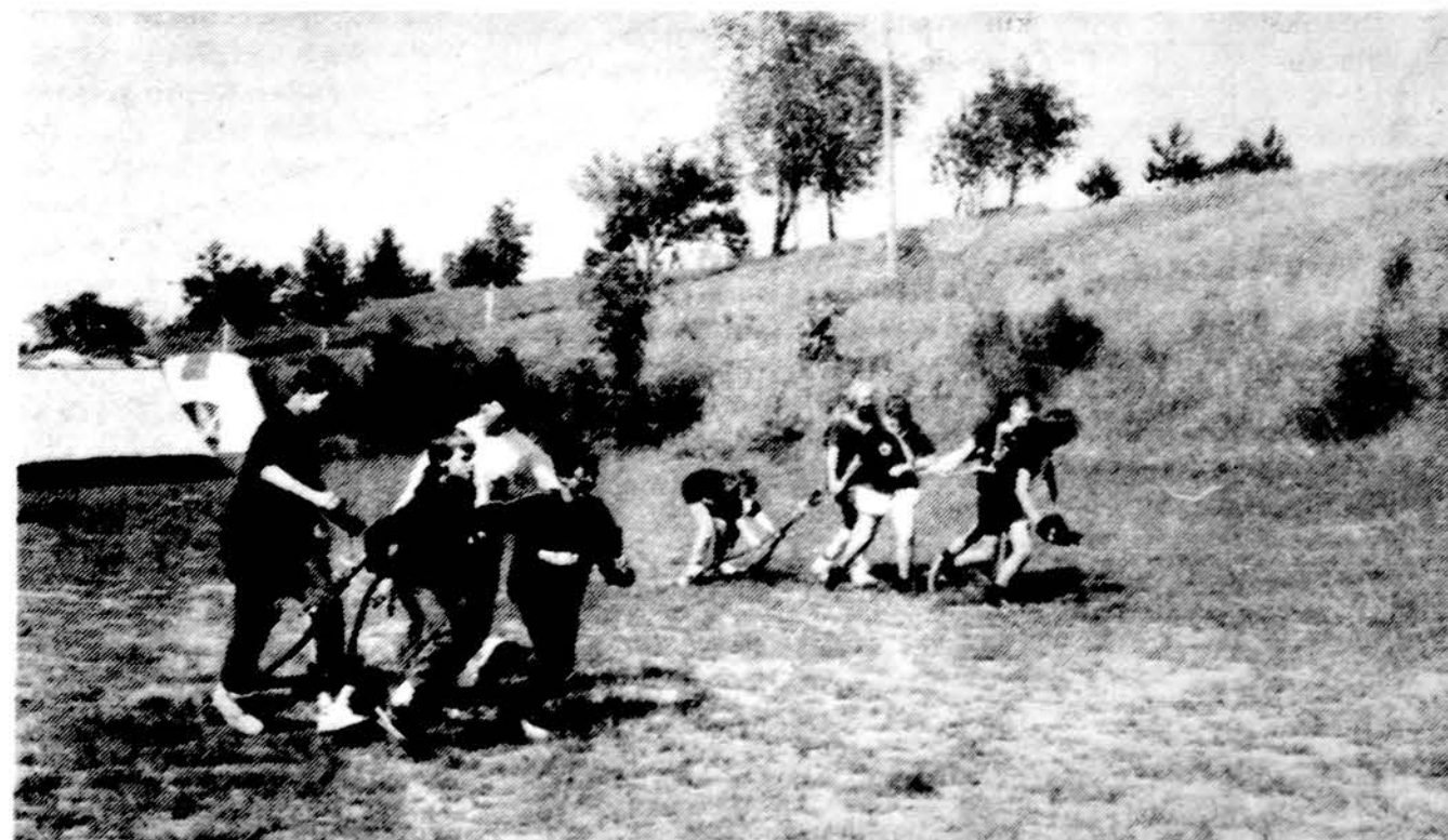
Detroito skautai ir skaitės lenktyniauja „Pilenų“ stovykloje vykusiame išskyloje.

Suvažiavime mūsų kuopa buvo gausiai atstovaujama.