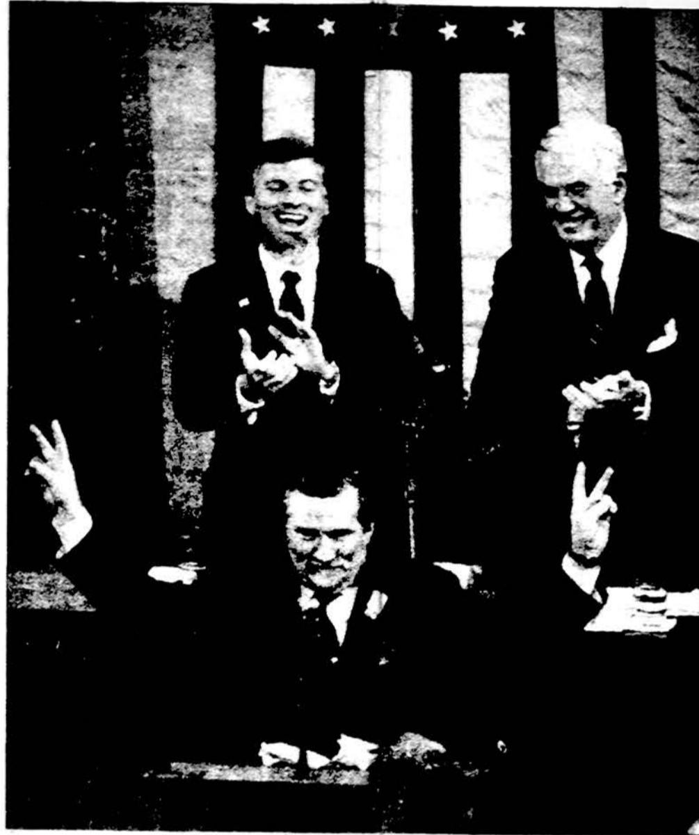
Lenkijos Solidarumo darbininkų vadas Lech Walesa kalbėjo trečiadienį jungtinėje JAV Kongreso sesijoje, kuriai vadovavo JAV viceprezidentas Dan Quayle. Dešinėje stovi Atstovų rūmų speakeris Tom Foley.

— Alabamoje viesulas Huntsville miesto prekybos centre užmušė 19 žmonių ir sužeidė daugiau kaip 300.