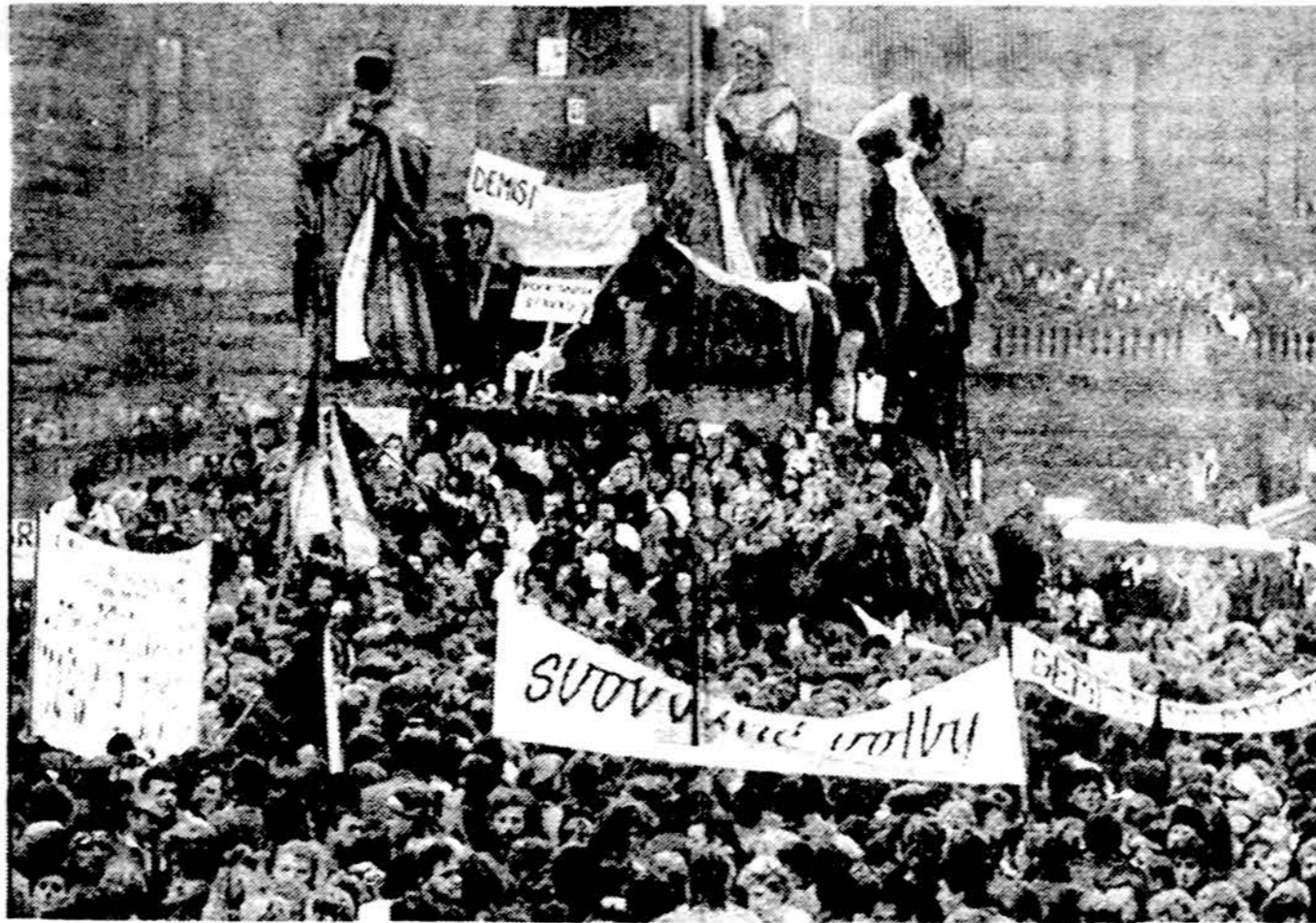
Čekoslovakijos komunistų vadai pirmą kartą tarėsi su naujai suorganizuota sąjūdžio „Piliečių Forumu“ vadais, kai daugiau kaip 200,000 minia protesto demonstracijoje Prahoje, Šv. Vavlovo aikštėje reikalavo naujų rinkimų ir komunistinės vyriausybės pasitraukimo.

Piliečių Forumas buvo įsteigtas praėjusį sekmadienį daugelio čekoslovakų intelektualų susirinkime.