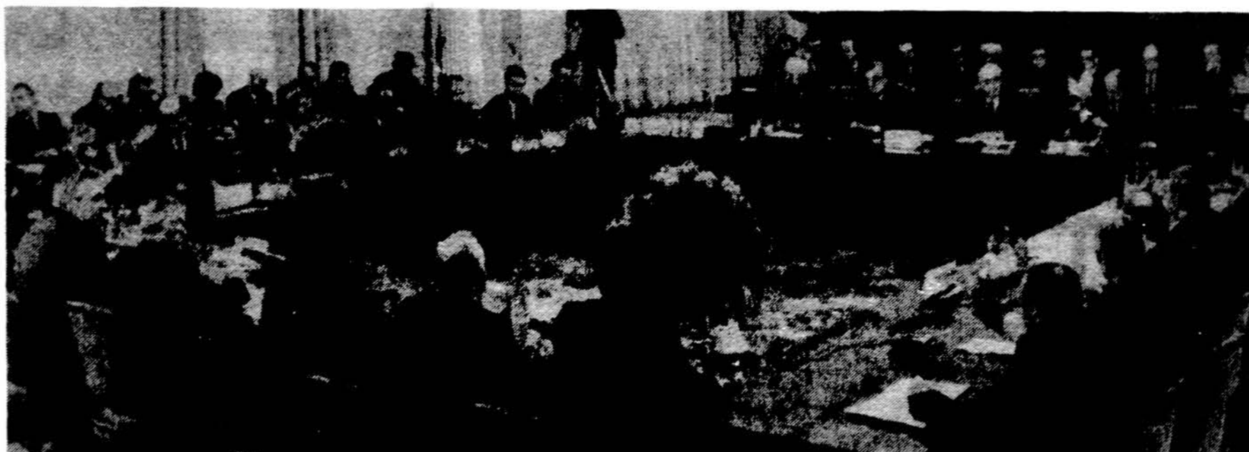
Varšuvos pakto valstybių vadai Maskvoje, kurse pasmerkė Sovietų Sąjungos invaziją į Čekoslovakiją 1968 metais. Priekyje matyti Sovietų prez. M. Gorbačiovas, o kairėje, šalia Lenkijos komunisto prezidento