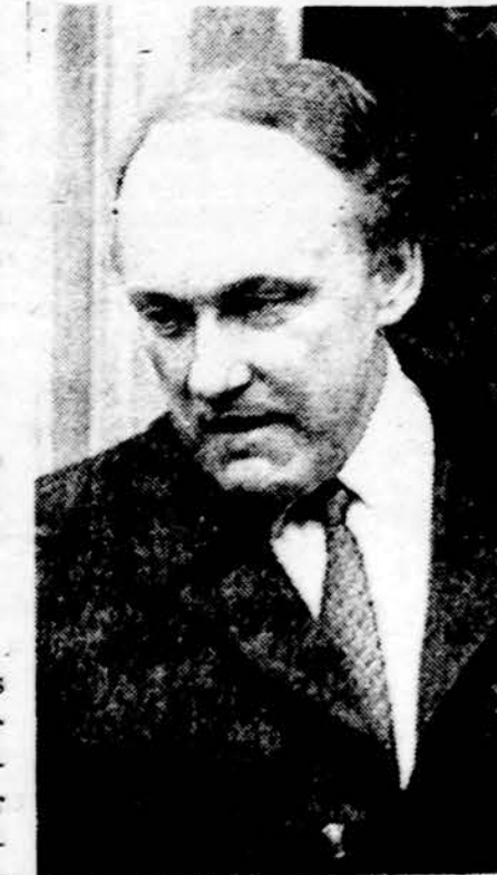
Marian Calfa, Čekoslovakijos naujasis ministras pirmininkas, einas pareigas tik iki rinkimų.

Praha. Čekoslovakijos griežtosios komunistų linijos šalininkas prez. Gustavas Husakas sekmadienį prisaikdino pirmą vyriausybę, kurioje nebevyrauja komunistai, ir tuoj po to pasitraukė iš prezidento pareigų. Tai buvo geriausiai ir lengviausiai perleista valdžia kitiems. Naujasis ministras pirmininkas Marian Calfa, komunistas, kuris vadovavo pereinamajai vyriausybei iki rinkimų, pasakė, kad jo kabineto svarbiausias tikslas bus paruošti laisvus ir demokratiškus rinkimus. Tik prieš tris savaites buvo įsteigtas oficialiai Piliečių Forumo sąjūdis, gavęs tautos pasitikėjimą. Kai Forumo steigėjas rašytojas Vaclovas Havelis pranešė miniai, kad sudaryta nauja vyriausybė, 200,000 minia pradėjo reikšti džiaugsmą, dainuodama, šokdami ir skanduodama patriotiškų šūkius. Parlamentas per 14 dienų turi išrinkti naują prezidentą. Kandidatais minimi buvęs „Prahos pavasario“ autorius Aleksandras Dubčekas ir rašytojas Vaclovas Havelis.