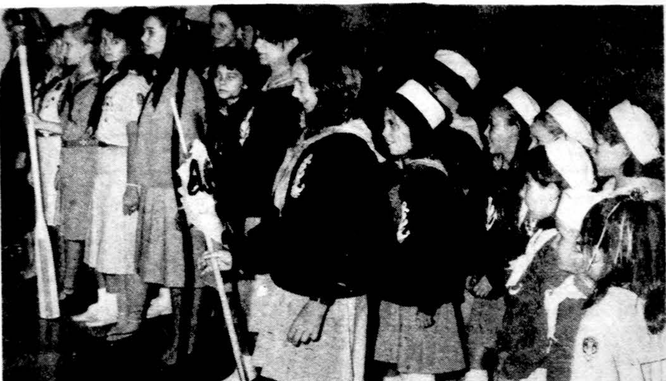
Sesiu gretos „Nerijos“ jūrų skaučių tunto dvidešimtmečio sueigoje.