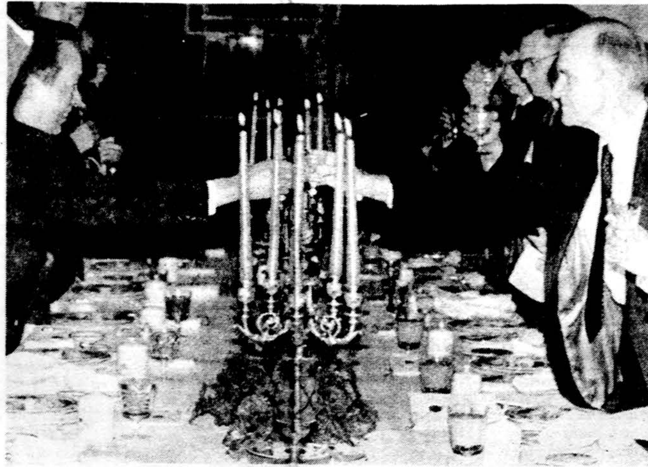
JAV Saugumo tarybos viršininkas Brent Scowcroft, dešinėje, sveikina su šampano taure Kinijos komunistų vyriausybės ministrį pirmininką Qian Qichen Kinijoje iškilmingos vakarienos metu. Šis vizitas nebuvo iš anksto praneštas amerikiečių žiniui.

— Chicago's advokatas Dan Webb, kuris yra Irano-Contrų byloje teisiant buvusį Saugumo tarybos viršininką John Poindesterį prokuroru, apklausinės pulkininką Oliver North, kaip buvo vykdomi ginklų pardavimai Iranui ir kieno isakymu. — Praha atidarė savo sieną Austrijai ir leido čekoslovakams laisvai ten vykti, kuo tuojau pasinaudojo tūkstančiai žmonių.