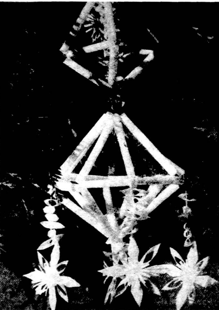
Kalėdų eglutės puoškime lietuviškais šiaudeliu puošmenimis.

Isteigtas Lietuvių Mokytojų Sąjungos Chicago skyriaus