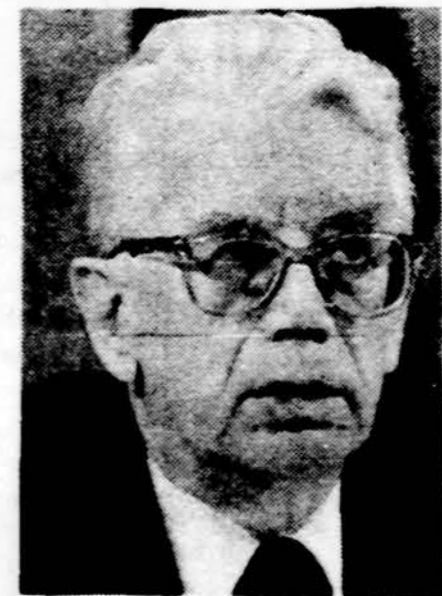
Vadimas Medvedevas, Komunistų partijos Centro komiteto sekretorius ir Sovietų Politbiuro narys bei ideologas.

Saulė teka 7:10, leidžiasi 4:21. Temperatūra dieną 9 l., naktį -4 l.