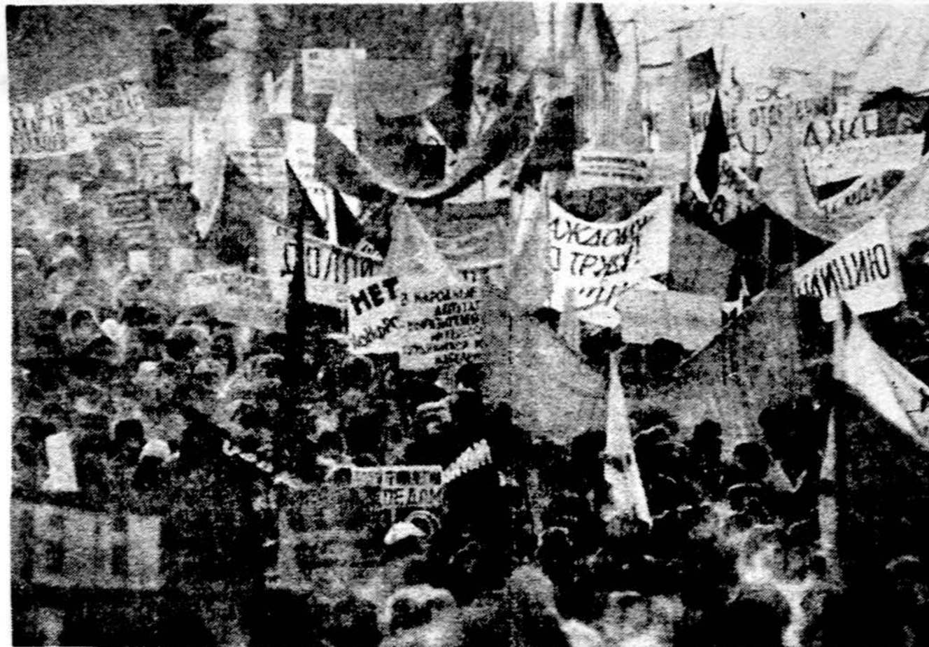
Maskvos gyventojų demonstracijos, primenančios Sovietų Sąjungos Liaudies deputatams Kremliuje, kad jie turi suliginti Komunistų partiją su kitomis organizacijomis ir panaikinti šestąjį Konstitucijos straipsnį.

- Prahos universitetuose panaikintas marksizmo-leninizmo kursas.