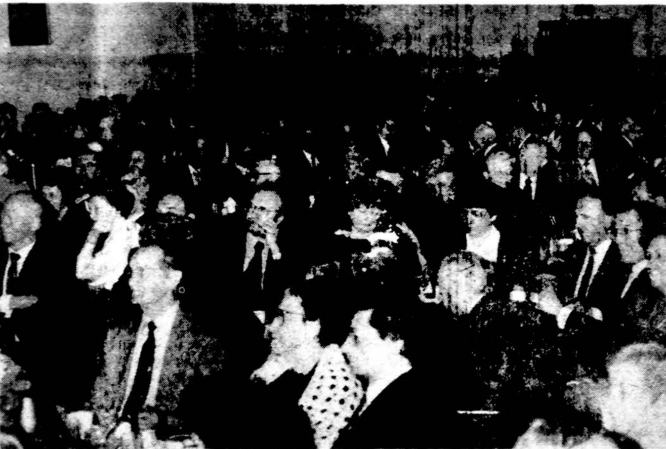
Jaunimo centro vakarienes dalyviai įdėmiai klausosi meninės programos.

x Talman Deli sveikina Šv. Kalėdų šventėje ir linki sveikų ir lietuviškai darbingų 1990 metų. Priimami užsakymai Jūsų Kūčių ir Kalėdų stalui. Kviečiame pasirinkti įvairių vietinių ir užsienių gaminių. Daržovių ir žuvų mišrainės, įvairiai pagamintos žuvys ir silkės, rūkytas ungurys. Paukštiena ir kiti mėsos gaminiai. Užsieniniai ir mūsų gamybos sausainiai, pyragai, tortai, raugolis. Didelis pasirinkimas kavos ir daug įvairių kitų skanėstų. Talman Deli, 2624 West Lithuanian Plaza Ct. (69th St.), Tel. (312) 434-9766. Parduotuvės valandos 8 v.r. – 6 v.v. kiekvieną dieną; sekmdieniais – 9 v.r. - 2 v. p.p. Kūčių dieną (gruodžio 24 d., sekmdienį) 8 v.r. - 4 v. p.p. Kalėdų dieną – uždaryta. Sveikiname ir linkime gerų švenčių. (sk)