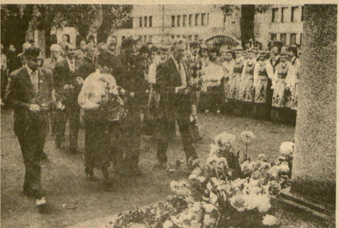
Atkurtos Lietuvos Inžinierių draugijos nariai savo suvažiavimo metu pagerbia žuvusius savo draugijos narius, padėdami gėles prie Laisvės paminklo Kaune.

darto“. Matyt, tai būtų teisingiausias kelias. Prisiminkime, nuo ko kelti savo ūkį pradėjo japonai. Apsitartę su viso pasaulio biznieriiais ir pramonininkais, jie sužinojo, kad žmonėms trūksta gerų siuvimo mašinų. Tada – 1946 metais – japonų inžinieriai susirinko į krūvą, sukūrė ir pagamino iš tiesų gerą siuvimo mašiną. Ji buvo išreklamuota, noriai perkama, pakėlė ne tik Japonijos ekonomiką, bet ir jos inžinierių prestižą. (Nukelta į 2 psl.)