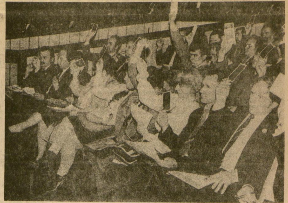
Laisvas inžinierių balsavimas per Lietuvos Inžinierių draugijos atkūrimą suvažiavimą Kaune.

riaus duodami nurodymai – lyg ir skirtingi dalykai. Tada buvo padvigubintas inžinierių ruošimas Kauno politechnikos institute, atsirado šio instituto filialai Vilniuje ir Panevėžyje. Reikėjo atsodinti tai, ką buvo išretinusi stalinizmo audra, tačiau reikėjo ir kitko – kūrybos, eksperimento laisvės. O jos nebuvo. Inžinierius apraizgė įvairūs standartai, techninės reglamentacijos ir, žinoma, nurodymai. Pirmiausia – iš Maskvos, paskui – iš savo ministerijų, priedo – vietiniai, gimę nesibaigiančiuose posėdžiuose, susirinkimuose, pasitarimuose. Posėdžiuk ir vykdyk – tai ir buvo visa inžinieriaus darbo esmė. Tokio darbo rezultatų sulaukti netrukome. Lietuva jau turi korteles muilui ir cukrui ir tikrai vieną gaminį – televizorių „Šilelis“, kuriuo gali konkuruoti su Vakarų pasaulio gaminiais. Taigi daugiau kaip 70 tūkstančių inžinierių – ir tuščios rankos... Dabar – apie kalną, kurį tomis rankomis esame pasiryžę nuversti. Blogiausia, kad kol kas ne labai žinome, kaip jis atrodo.