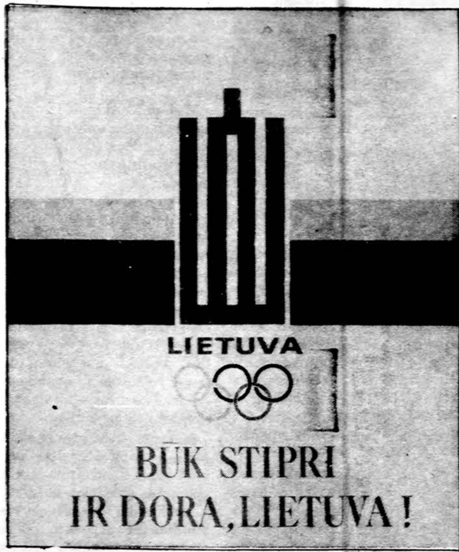
Lietuvos Tautinio Olimpino komiteto plakatas

Vilnius. — Lietuvos spauda praneša, jog sudaryta Rinkiminė komisija ir pradėjo pasiruošimus rinkimams, kurie įvyks kovo 18 d. Komisija sudarė rinkimines apygardas Lietuvos Aukščiausiosios tarybos deputatų rinkimams ir nustatė rinkimų taisykles. Komisija taip pat svarstė ir kareivių dalyvavimo rinkimuose klausimą ir nutarė kreiptis į Aukščiausiąją tarybą, kad paaiškintų kaip laikytis dėl nelietuvių dalyvavimo rinkimuose.