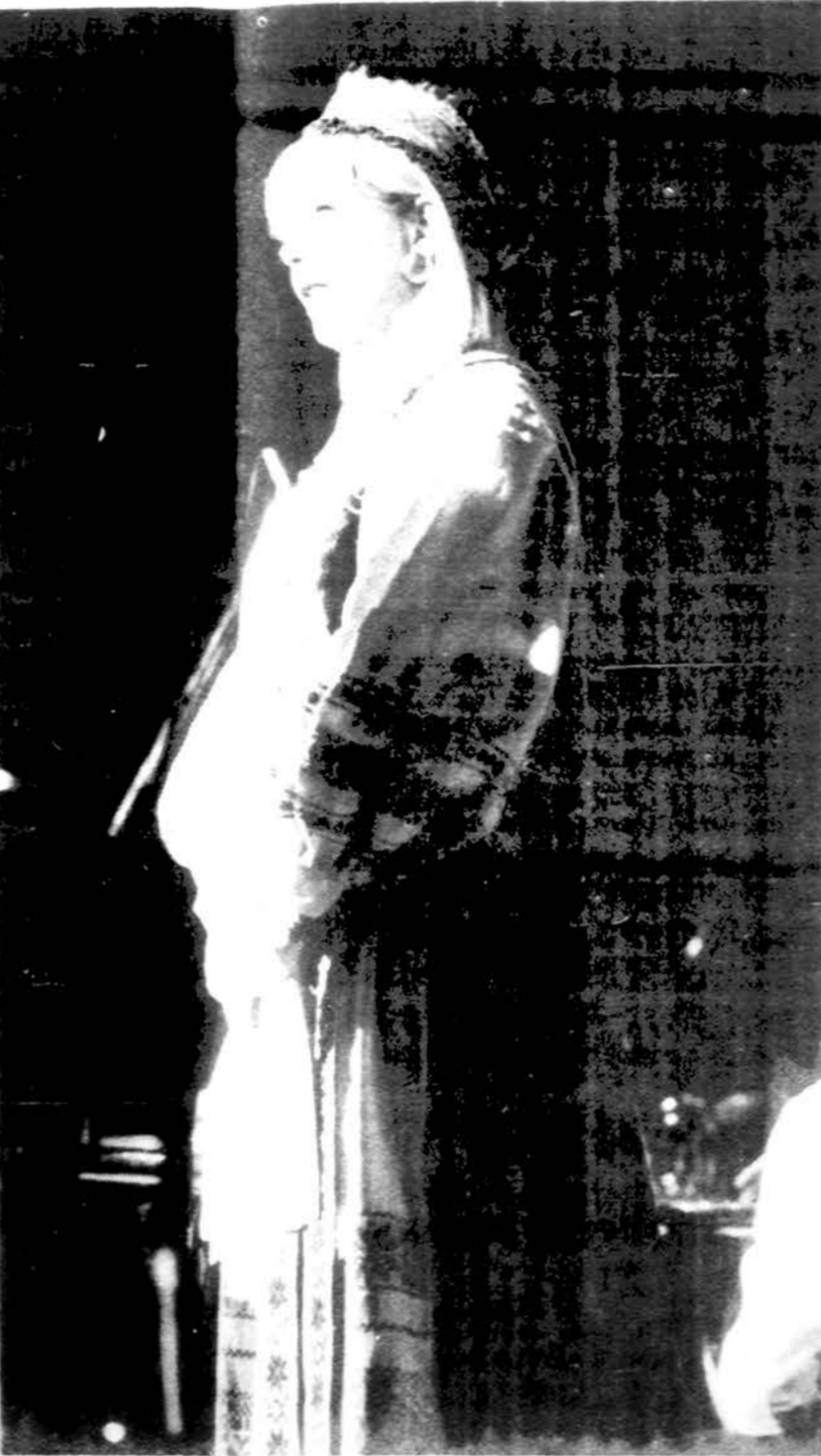
Ann Jillian – Jūratė Nausėdaitė, žymi aktorė, praveda lietuvių Dainų šventę.

x G. T. INTERNATIONAL parūpina jūsų giminėm bilietus iš Lietuvos į įvairius Amerikos miestus neskreندان per Maskvą. Su jūsų giminėmis ryšį palaiko ir perduoda visas informacijas mūsų raštinės atstovė Vilniuje. Prašome kreiptis: G. T. INTERNATIONAL, INC., 9525 S. 79th Ave., Hickory Hills, IL. Tel. (708) 430-7272.