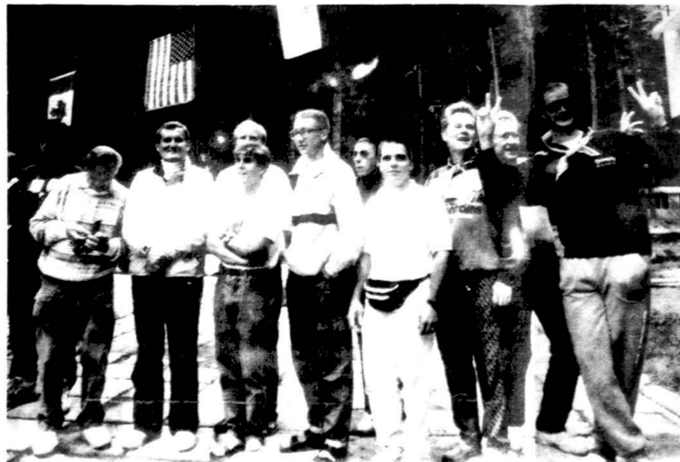
IV-ąją PLS Žaidynių Lietuvoje Šildymo varžybose dalyvavė (dalis) JAV rinktinėtojai.