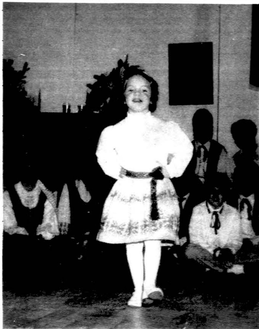
Zapolio antukė dainuoja Mokslo ir pramonės muziejuje surengtoje lietuviškoje Kalėdų eglutėje.

Prieš pat Kalėdas atėjo registruotas laiškas iš Kauno. Nuo visai nepažįstamo asmens.