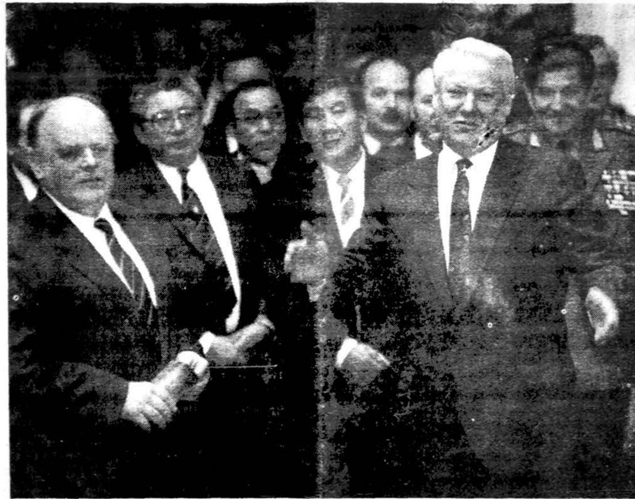
Rusijos prezidentas Boris Jelcinas, dešinėje, su Gudijos prezidentu Stanislovu Šuškevičiumi, kairėje, kalbasi su reporteriais Minske, kur posedžiavo vienuolikos respublikų prezidentai.

– Maskvoje kalbėdamas per televiziją Rusijos gyventojams prez. Boris Jelcinas pasakė, jog „Rusija rimtai serga, bet šiais metais pasveiks“.