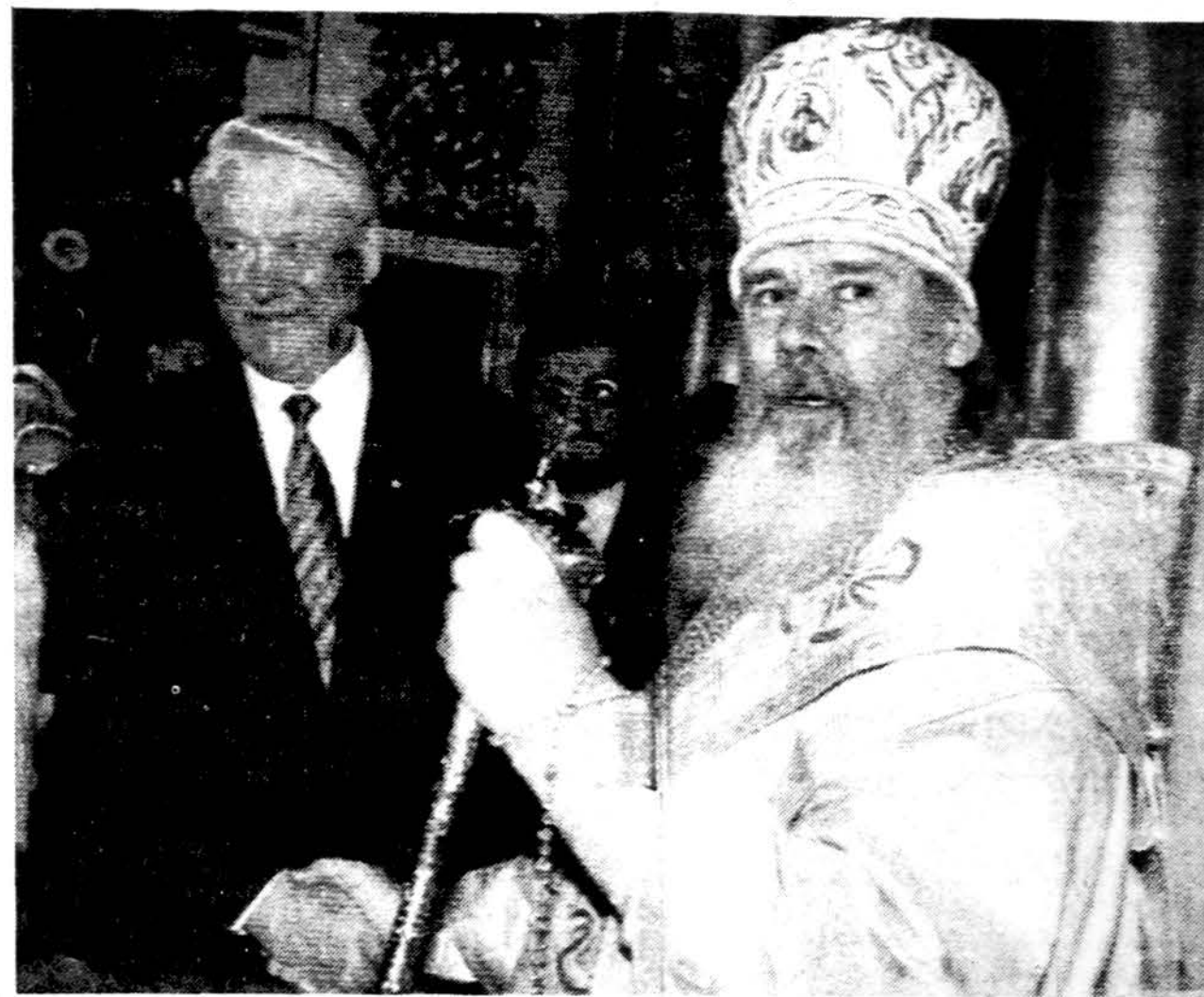
Rusijos Respublikos prezidentas Boris Jelcinas Kalėdų naktį sveikinasi su Maskvos patriarchu Aleksiejumi II, kai rusai ortodoksai šventė savo kalėdinės šventės.

– Žemės ūkio departamentas praneša, jog išleido taisykles, pagal kurias apkarpos maisto kortelės – „Food stamps“, tačiau „aprupinimas“ jomis nebūsiąs sumažintas.