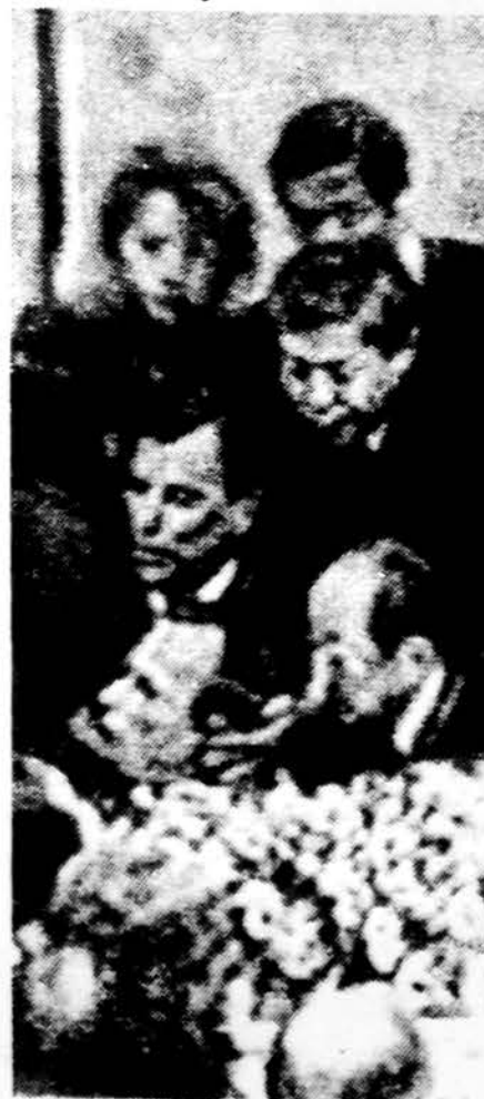
Prezidentui Bushui padeda atsikelti saugumo vyrai ir Japonijos ministeris pirmininkas Kiichi Miyazawa, kai jis susirgo valstybinių pietų metu Tokyo mieste trečiadienio vakare.

– Italijos pasienio sargyba suareštavo 7 žmones, bevežančius Amerikos Stinger raketas Kroatijos vyriausybei, pranešė „La Stampa“ laikraštis.