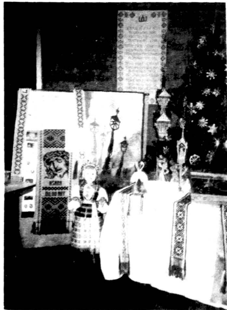
Purdue universitete lietuviškos parodos eksponatai