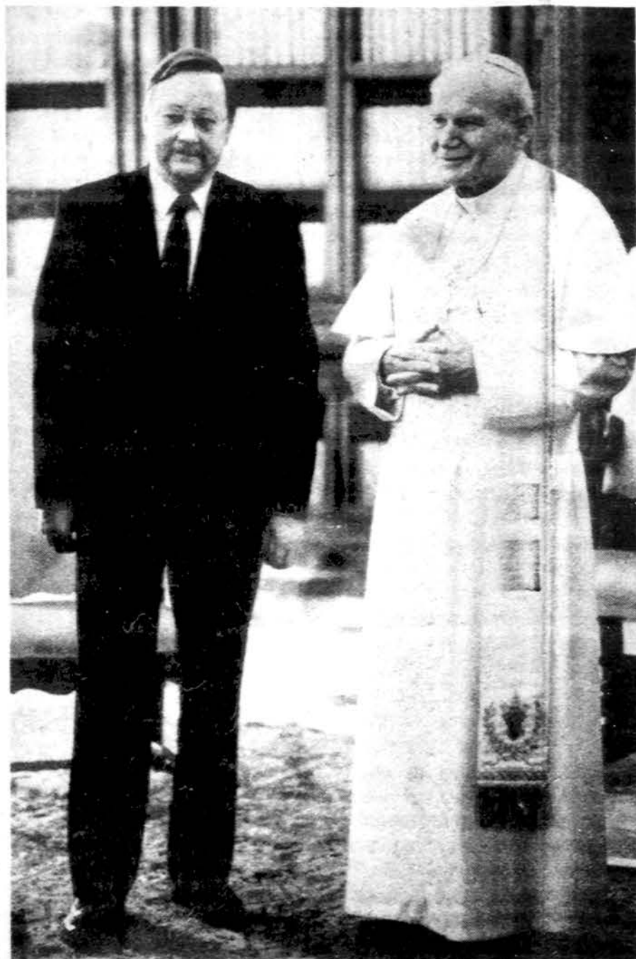
Lietuvos Aukščiausiosios Tarybos pirmininkas Vytautas Landsbergis audiencijoje pas Šventąjį Tėvą Joną Paulių II.

Siekdama paspartinti agresinę reformą, Vyriausybė priėmė nutarimą, kuriuo nustatytas agrarinės reformos darbų eiliškumas ir terminai. Apylinkių agrarinės reformos tarnybos kartu su Valstybiniu žemėtvarkos institutu turi iki sausio 20 d. parengti sąrašus asmenų, turinčių žemės nuosavybės teisei įrodyti reikalingus dokumentus ir pasirengusių privačiai ūkininkauti. Apie pasirošimą ūkininkauti turi būti sprendžiama, atsižvelgiant į turimus ūkinis pastatus, darbingą žmonių