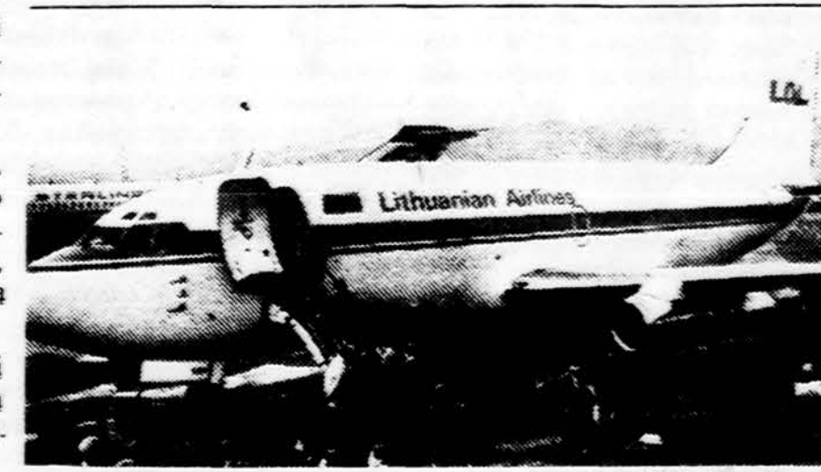
Su užrašu Lithuanian Airlines ir Lietuvos simboliniais ženklais pirmą kartą gruodžio 21 dieną pakilo iš Vilniaus „Boeing 737“ lėktuvas ir atskrido į Kopenhagą. Tuo prasidėjo tarptautiniai skrydžiai iš Lietuvos į Vakarų valstybes. Jame keleivius aptarnauja lietuviškos stiuardės. Nuo šiol šis lėktuvas skraidys tris kartus per savaitę į Kopenhagą, Frankfurtą ir Berlyną. Skrydis į Daniją Baltijos piliečiams kainuoja 70 dol. ir 685 rublius, o kitiems nuo 331 iki 460 dolerių, skelbia „Tiesa“.

Armėnija suteikė Gruzijos prezidentui Gamsachurdijai laikinas pabėgėlio teises šeštadienį, bet su viena sąlyga, kad jo palydovai, kurių daugiau kaip šimtas, atiduos ginklus ir paliks respubliką.