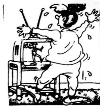
Kaulų suminkštėjimo (osteoporosis) išvengiama taip: 1. Dirbant — minkštinančiam, 2. Nerūkiant, nesisvaiginant — ir vyno negeriant. 3. Valgant daug kalcio turinčio maisto, būtent: geriant 4 puodelius nugriebto (skim) pieno per dieną, valgant liesą sūrį. Taip elgdami išvengsim kaulų suminkštėjimo, nes jiems suminkštėjus, nebeįmanoma juos sukietinti.