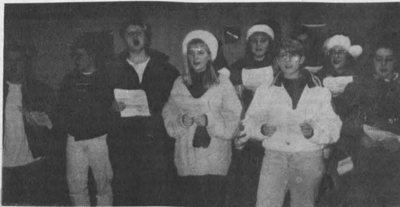
Dalis Chicago moksleivių ir studentų ateitininkų, Kalėdų švenčių proga aplankusių „California Gardens“ senelių namų gyventojus ir pasveikinusių juos giesmėmis ir dovanėlėmis.