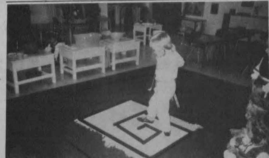
Montessori mokyklėlės mokinys balansuoja ant „lenteles”.