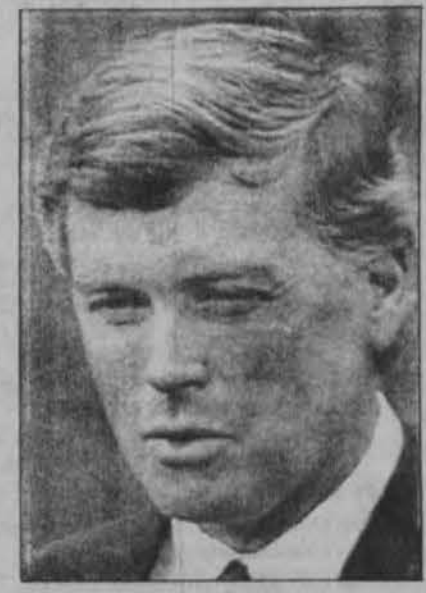
Daniel Quayle, JAV viceprezidentas

Washingtonas, 1992 sausio 24. (Lietuvos Ambasada) JAV viceprezidentas Dan Quayle vasario 7 d. lankysis Lietuvoje. Tą dieną, kaip praneša viceprezidento istaiga Washingtone, jis sakys „svarbią prakalbą“ Nepriklausomybės aikštėje Vilniuje.