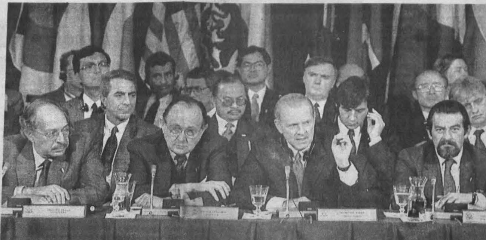
Washingtono spaudos konferencijos metu JAV Valstybės departamento sekretorius James A. Baker III atsako į reporterių klausimus, kai baigėsi dviejų dienų pagalbą klausimais konferencija Nepriklausomų Valstybių Sandraugai buvusioje Sovietų Sąjungoje. Su juo prie stalo iš kairės pusės

– Washingtono Reuterio žinių agentūros korespondentas praneša, jog Amerika Persų įlankos karo metu prieš Iraką išbandė slapta laivyno raketą pirmą kartą ir tas bandymas laikomas labai pasisekusiu.