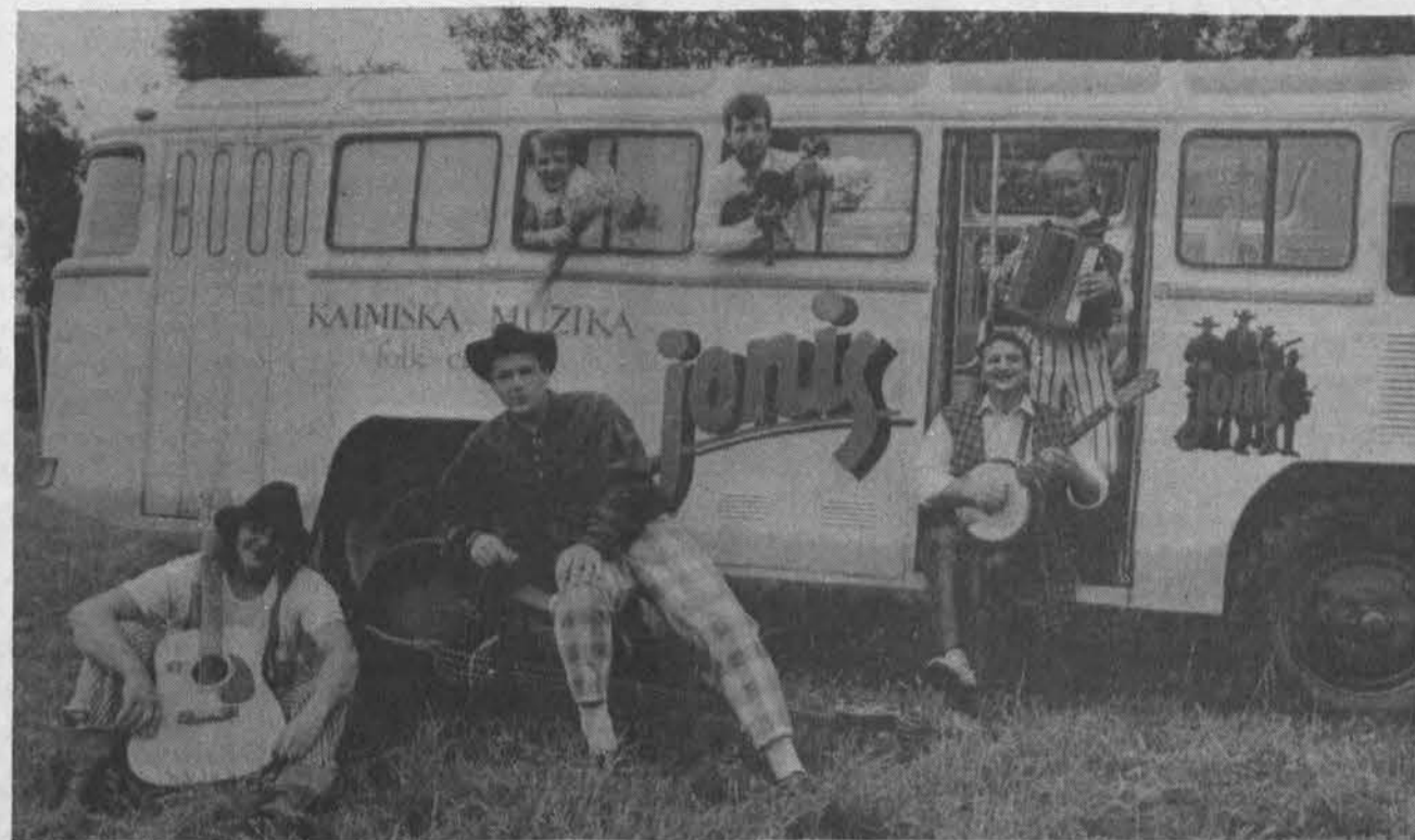
Kaimiškos muzikos ansambliis „Jonis” gastroliuoja. Jau koncertavo Rytiniame pakraštyje, o vasario 2 d. pasirodys Jaunimo centre, o vasario 9 d. Lietuvių centre.

— Kas Jūsų repertuare dominuoja — daina ar muzika? — Sakyčiau, apylygiai. Didelį dėmesį skiriame tekstams. Mes daug dainų dainuojame Strazdo, Vienažindžio tekstams. Taipgi turime dainų, kurios yra