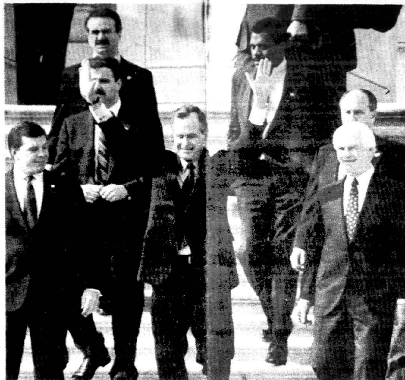
JAV prezidentas George Bushas išeina iš Kapitolio rūmų, kuris tarėsi su Atstovų rūmų ir Senato respublikonų partijos nariais savo pasiūlyto biudžeto 1993 fiskaliniams metams klausimais. Prezidento išteiktas biudžetas yra 1.52 trilijonų dolerių sumoje.

Po staigaus – iki 50 procentų – laisvai konvertuojamos valiutos kurso kritimo praėjusį trečiadienį, dabar pastebimas jos kilimas. Šią savaitę tai sudarė apie 10 procentų. Šiandien Lietuvos banke JAV doleriai superkami po 110 rublių, parduodami po 135; VFR markės atitinkamai 68.60 - 87.20; Kanados doleriai 94.00 - 115.40.