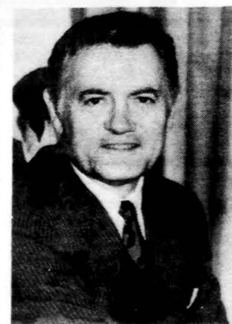
Valdas Adamkus, JAV Aplinkos Apsaugos Agentūros Vidurio Vakarų regiono administratorius, vadovauja Baltijos kraštų gamtos apsaugos JAV plano įgyvendinimui.

Vasario 26 dieną, lydimas Valstybės departamento ir Washingtono EPA atstovų, Valdas Adamkus išvyko į Vilnių, Rygą ir Taliną tartis su Baltijos valstybių gamtos apsaugos vadovais dėl techninės pagalbos plano vykdymo. Numatoma, kad pirmieji specialistai į Baltijos valstybes vyks jau gegužės mėnesį. Jų uždavinys bus patarti sudarant monitoringo sistemą, kad nuostaičius užteršimo lygi; pagalba ekologinės teisės sistemai sukurti, laboratorijoms parūpinti būtiniausius įrengimus ir padėti administraciniam aparatui. Šiam pradiniam darbui nu-