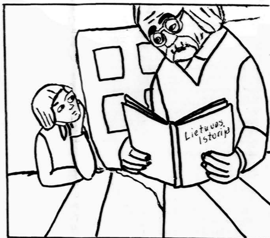
Senelis savo vaikaičiui skaito apie didingą Lietuvos praitį ir didvyrių laimėjimus.

[Isteigtas Lietuvių Mokytojų Sąjungos Chicagos skyrius