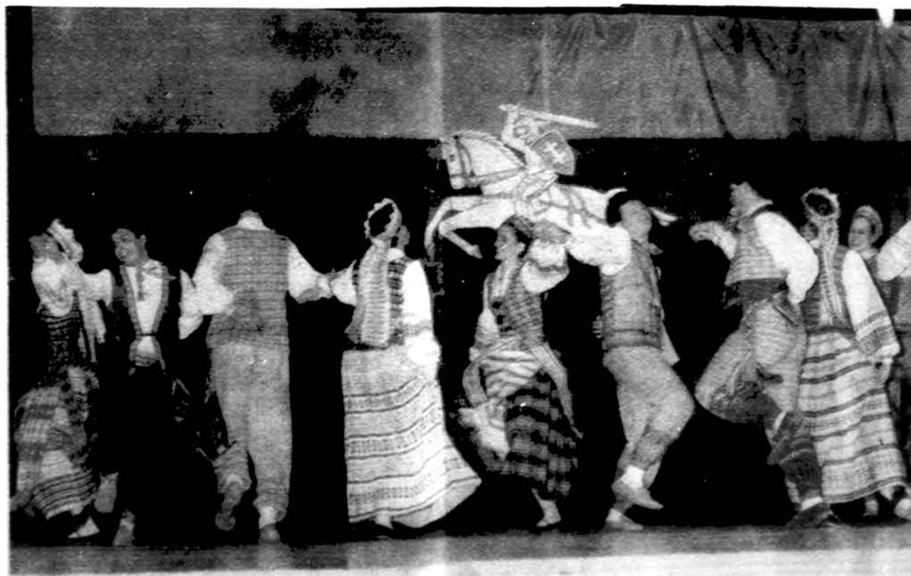
Nepriklausomybės minėjime Marijos aukšt. mokyklos saleje linksmina „Grandies“ dalis žiūrovus.

Yra švenčių, kurias švenčia atskiros tautos ar valstybės visame pasaulyje vienu metu: tai Naujieji metai sausio 1 d. Ją švenčia ir daugumas religijų. Bet kada naujieji metai prasideda? Ar sausio 1? Kodėl ne gruodžio 21 ar 22, kai dienos pradeda ilgėti? Kodėl ne nuo Kalėdų, Kristaus gimimo dienos, nes nuo Kristaus gimimo jau skaitome ir metų skaičių. Tačiau pasirodo, ne krikščionys sausio 1 d. padarė Naujaisiais metais. Įvairios tautos naujųjų metų pradžią šventė nevienodu laiku. Pvz. senovės egiptiečiai, fenikiečiai ir persai naujų metų pirmąją dieną laikė rudens ekvinokso, t.y. dienos susilyginimo su naktim dieną rugsėjo mėn. Rodos, žydai naujuosius metus švenčia rugsėjo mėn. Kiniečių naujųjų metų parada ir karnavalas buvo šią ar praėjusią savaitę. Krikščionys Naujų metų dieną ligi pop. Grigaliaus kalendoriaus refor-