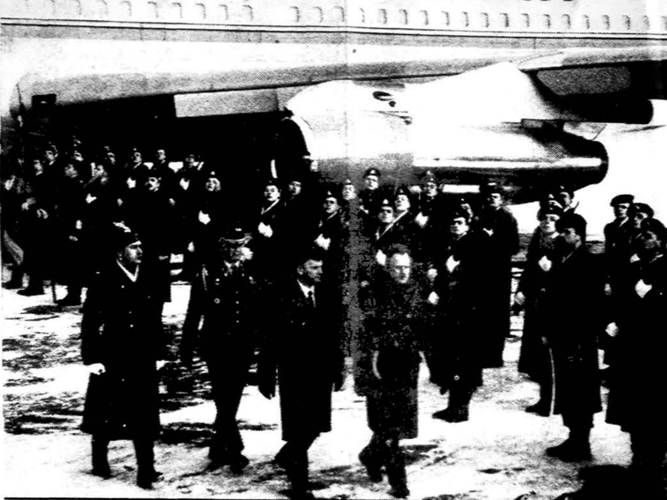
JAV viceprezidento Dan Quayle sutikimas Vilniaus aerouoste vasario 7 dieną jam atvykus į Lietuvą. Viceprezidentas, lydintis Lietuvos viceprezidento Broniaus Kuzmicko, praeina pro Lietuvos Respublikos garbės sargyba.