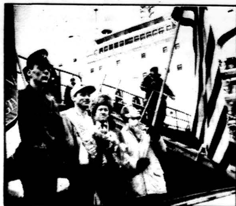
Klaipėdos prekiniamo uoste vasario 18 d. pirmą kartą suplevėsavu JAV vėliava. Tą rytą į uostą atplaukė JAV laivas „Pride of Texas“ su 33,500 tonų kukurūzų. Remiantis sutartimi, į Klaipėdą turi būti pristatyta dar 100,000 tonų pašarinių grūdų.

Saulė teka 6:21, leidžiasi 5:44. Temperatūra dieną 57 l., naktį 44 l.