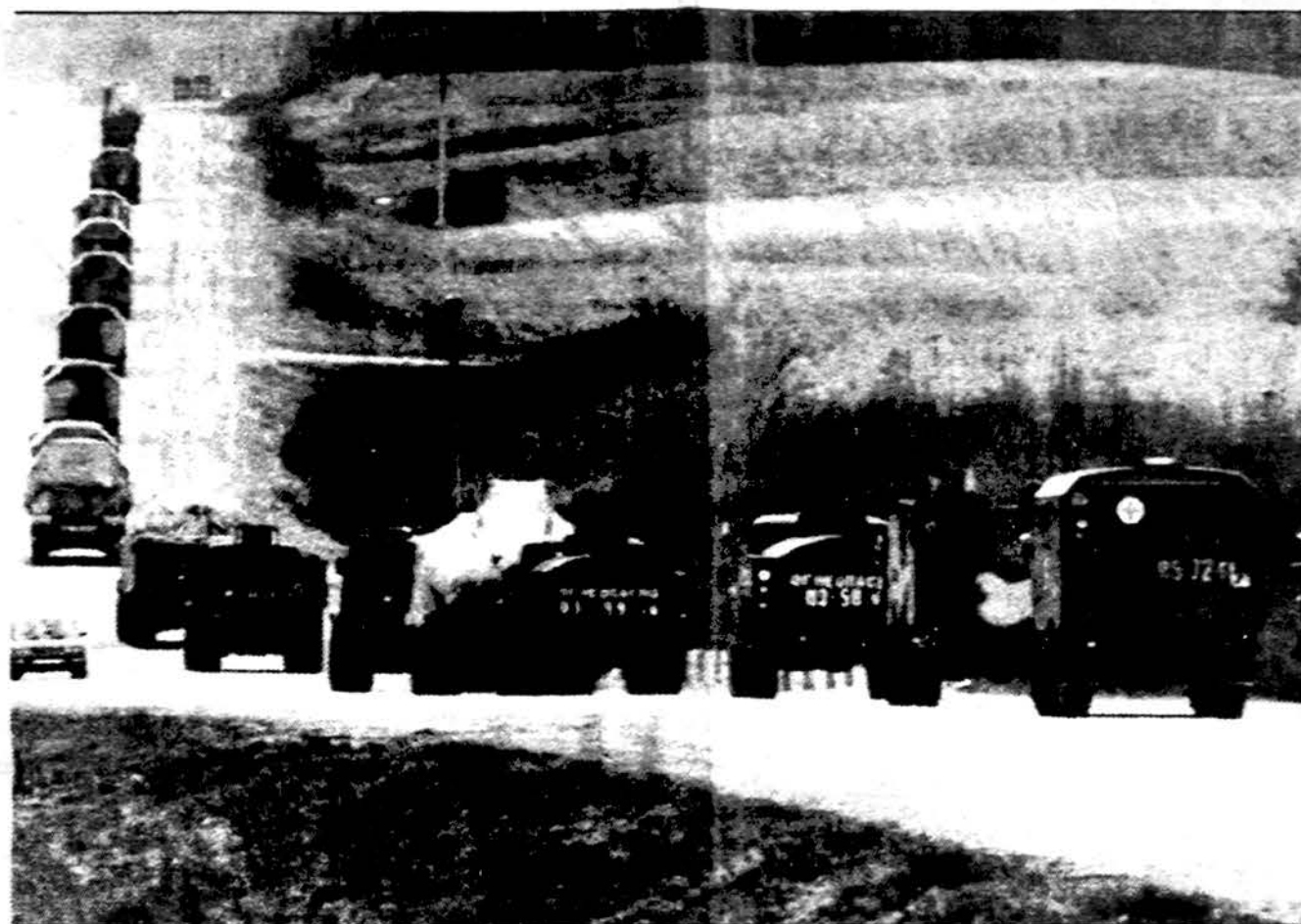
Buvę Sovietų Sąjungos daliniai išvyksta iš Lietuvos. Antradienį viena sovietinė vilkstinė pradėjo pasitraukimą po 50 metų, kai Sovietų karinės pajėgos okupavo Baltijos valstybes. Pranešama, jog esama 90,000 kareivių Lietuvoje, tačiau dažnai žinių agentūros skelbia vis kitokių skaičius.