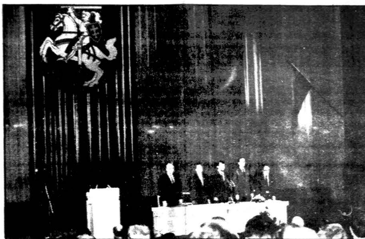
Šiandien prieš dvejus metus – 1990 metų kovo 11-ąją – lietuvių tauta mini šią dieną, kai buvo atsteigta Lietuvos valstybės nepriklausomybė. Visa Lietuva buvo tas Sąjūdis, pasisakęs už visišką tautos suverenumą. Nuotraukoje šių metų Vasario 16-osios iškilmingo minėjimo prezidentas Lietuvos Operos ir Baletų teatre Vilniuje.

Saulių Jėzuitai kartu su pedagoginio instituto lituanistikos katedra Šatrijos Raganos minėjimą surengė Šv. Ignaco bažnyčioje. Išleista jos pedagoginių etudų knyga „Mergaitės kelias“. Sukakčiai skirtos parodos atidarytos Kaune, Maironio lietuvių literatūros muziejuje ir Vilniuje, Nacionalinėje bibliotekoje.