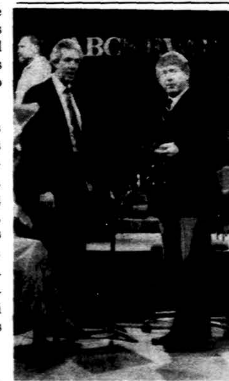
Chicagoje kongresmenas Marty Russo diskutuoja savo ieteiktą įstatymo projektą su Nightline programos vadovu Ted Koppel, kuris numato sveikatos draudimą visiems Amerikos gyventojams. Ši televizijos programa buvo transliuojama iš Chicago universiteto ir joje dalyvavo daugiau kalbėtojų, tačiau Russo sveikatos draudimo pasiūlymas, daugelio specialistų manymu, esąs geriausias.

JAV ambasadorius Rusijai Robert S. Strauss, kalbėdamas Senato užsienio reikalų komitete, pasakė, jog reikia skubios pagalbos Rusijai ir priviakti investavimų, ir yra