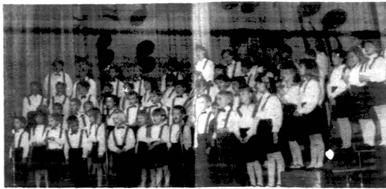
Clevelando Šv. Kazimiero liuanistinės mokyklos mokiniai scenoje atlieka šventinę programą.