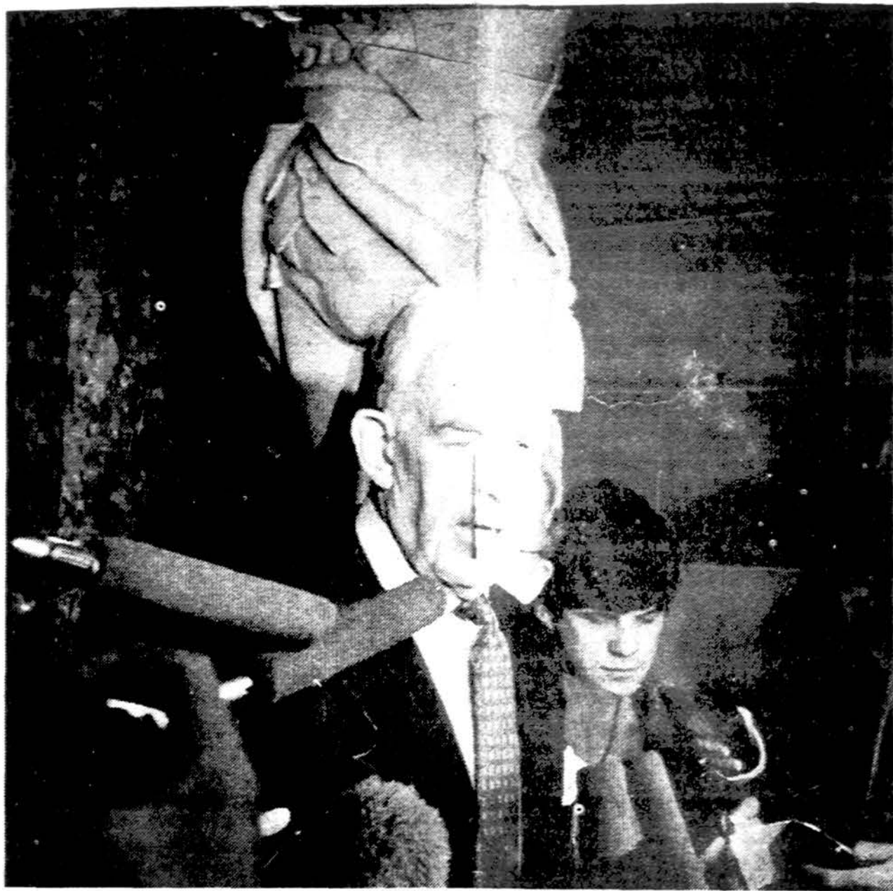
Atstovų rūmų speakeris Thomas Foley kalba su reporteriais, kuriems pasakė, jog reikia pertvarkyti Kongreso rūmų administraciją, kad nebeįvyktų kito panašaus skandalo.

Vilnius. Kovo 18 d. (Elta) — Lietuvos respublikos ambasada Rusijos Federacijoje iš buvusios SSSR saugumo prokuratūros gavo Lietuvos prezidento A. Stulginskio bei dar kai kurių kitų Lietuvos piliečių baudžiamąsias bylas. Vicepremjeras Z. Vaišvila įpareigojo ambasadą perduoti dokumentus Lietuvos archyvų generalinei direkcijai.