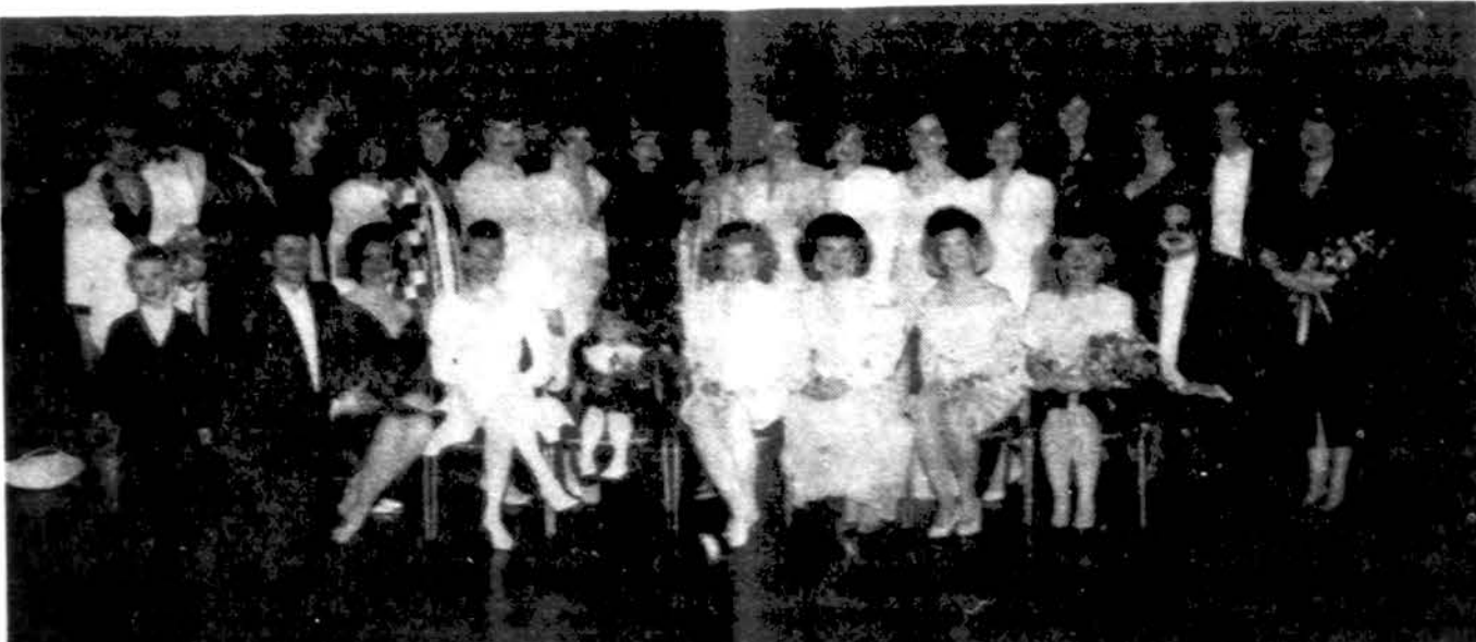
Montessori mokyklų madų parodos „Skambek, Pavasarėli“ modeliotojai ir rengėjai.