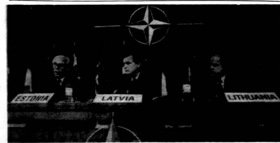
Baltijos respublikų – Estijos, Latvijos ir Lietuvos užsienio reikalų ministrai posėdžiauja NATO vyriausiojoje įstaigoje Briuselyje. Dešinėje – Lietuvos Užsienio reikalų ministras Algirdas Saudargas.

Antano Giedraičio-Giedriaus šimtąjam gimtadieniui skirtas vakaras taip pat įvyko Kaune, Maironio lietuvių literatūros muziejuje. Tautinėje Martyno Mažvydo bibliotekoje atidaryta šiai sukaktčiai skirta paroda.