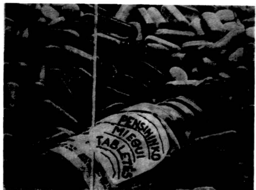
Ne vien tabletes sveikata! Užtai ne už visų pamulto vaisto griebkimės, bet pirmiausia visą jėgą ir visą širdį dedame į sveikatos apsaugą. Tik taip mes grūdinsime savo sveikatos šaknų dienoms. Dabar visi, tiek Lietuvoje, tiek čionai gulasi ir keliasi, tik apie piliules galvodami. Jų prekybininkai nereikalingai gausiai dabar pagamina, o neišmintingieji pernelyg gausiai ju sunaudoja. Vaistas naudingas tik būtinybės atveju.

Visi lietuviai būkime gūvūs apsaugoje nuo visų ligų, ypač nuo sklerozės, kuri yra pagrindinė priežastis stroko gavimui. Apsaugos gramas yra vertas daugiau negu centneris gydymosi.