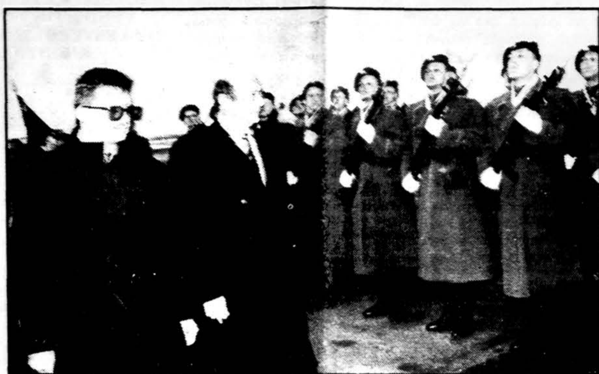
Kai Lietuvos sostinėje kovo viduryje lankėsi NATO generalinis sekretorius Manfred Woerner. Jo sutikimo metu Vilniuje. Jis pasakė neabejojantis, kad svetima kariuomenė turi būti išvesta iš Lietuvos. „Dėl gerų santykių su Rusija mes neaukojame gerų santykių su Lietuva, Latvija ir Estija“, pasakė NATO vadas.

– Singapore šešios pietinės Azijos šalys pasirašė du susitarimus – ekonominio bendradarbiavimo ir viso to regiono ekonominę sistemą. Prie šios grupės vėliau prisijungė Vietnamas ir Laosas.