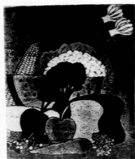
Šitokią maistą, o ne kokią ten vitaminų piliulę rykime, jei norime sveikesni, guvesni ir ligoms atsparesni būti.

Endarterektomijos operacija yra gerai išdirbta, bet vis dar yra mokyty gydytojų, manančių, kad šiame krašte per daug nereikalingų tokių operacijų padaroma. Tikras dalykas, kad ši operacija daugeliui padėjo. Žinoma, kaip ir visų sunkių operacijų reikalu, reikia sužinoti antro gydytojo nuomonę.