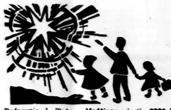
Redaguoja J. Plačas. Medžiagą siūsti: 3206 W. 65th Place, Chicago, IL 60629

ARAS ROOFING Arvydas Klela Dengiams ir telsems visų rūšių stogus Tel. 708-257-0647 Skambinti po 6 v.v.