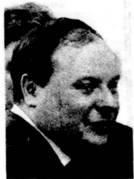
Jegoras T. Gaidaras, Rusijos Federacinės Respublikos pirmasis ministro pirmininko pavaduotojas, įteikęs prezidentui Borisui Jelcinui kabineto rezignacijos raštą.

Saulė teka 6:13, leidžiasi 7:30. Temperatūra dieną 58 l., naktį 48 l.