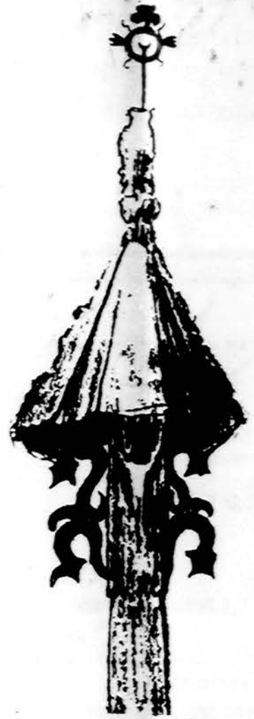
Žemaitių kopyltstulpis iš Plungės. Piešė Mikalojus Konstantinas Čiurlionis 1909 metais