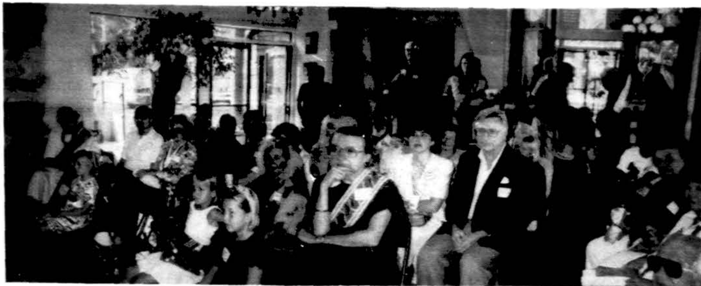
Havajų lietuviai vasario 16 d., susirinkę Makani Kai Yacht klubo patalpose Kaneohe, mini Lietuvos nepriklausomybės paskelbimo dieną.