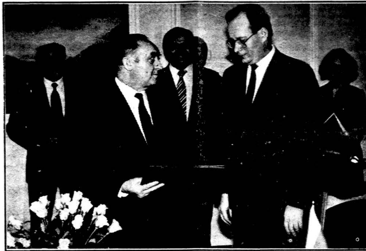
Lietuvoje Baltarusijos ministras pirmininkas Večeslavas Kebičius, kairėje, ir Lietuvos ministras pirmininkas Gediminas Vagnorius pasirašo prekybinio ir ekonominio bendradarbiavimo sutartį. Ši tarptautinė sutartis sureguliuoja abiejų šalių ekonominius ryšius.

— New Yorko spauda rašo, jog Demokratų partijos viceprezidentiniu kandidatu gali būti buvęs pastorius Jesse Jackson, kuris paskelbė nekandidatuosiantį į prezidento postą. Demokratų vadai taikiai pradėjo žiūrėti į tai, nes patenkinti, kad jis nebesiekia prezidento vietos.