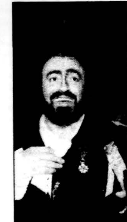
Italų tenoras Luciano Pavarotti pirmadienį buvo apdovanotas Prancūzijos Legiono garbės žymeniu, kurį įteikė Prancūzijos Užsienio reikalų ministras Roland Dumas. Paryžiuje tenoras dainavo Verdi „Kaukių balius“ operoje.

Saulė teka 6:00, leidžiasi 7:39. Temperatūra dieną 49 l., naktį 38 l.