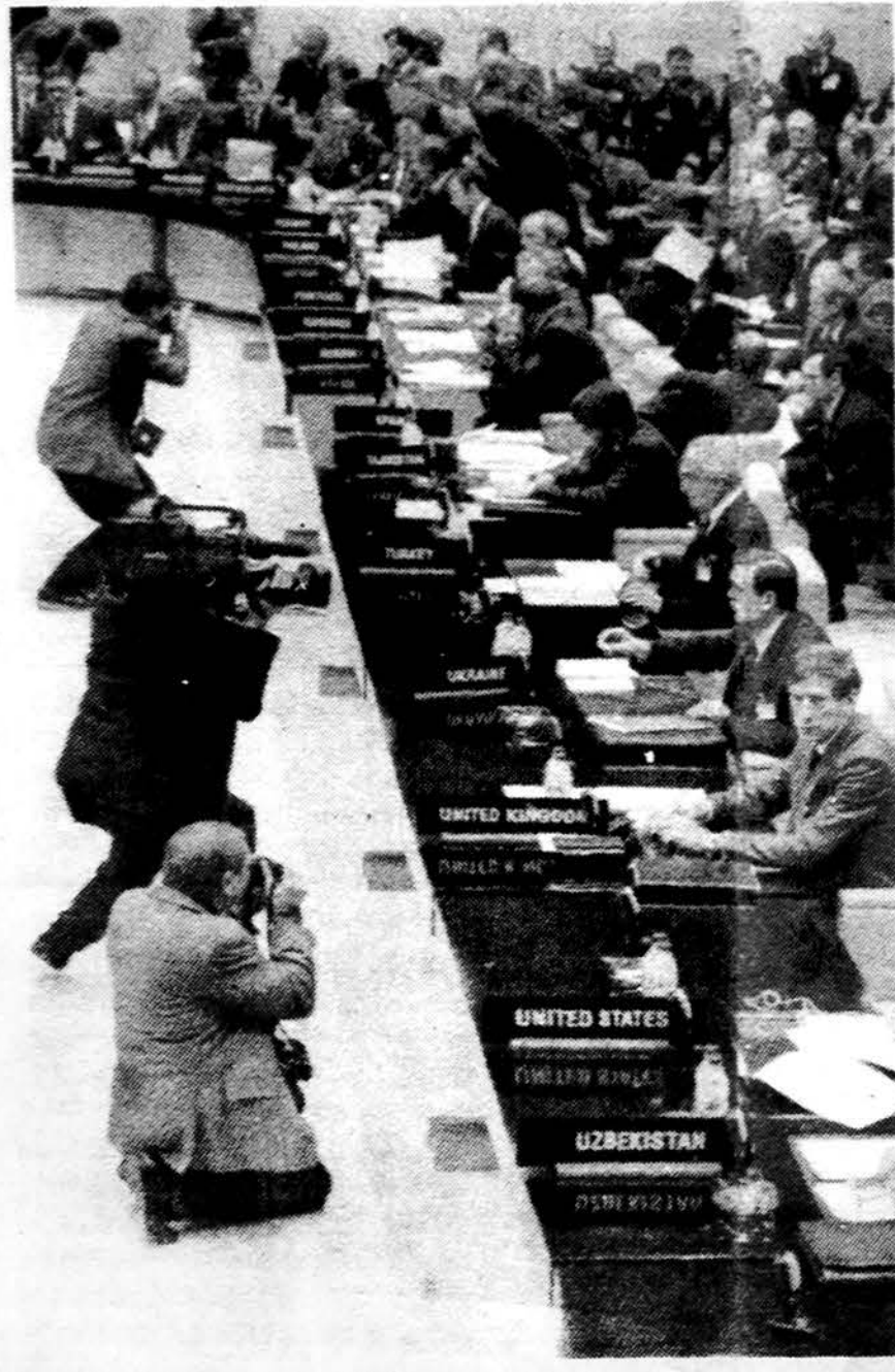
Žurnalistai fotografuoja NATO vyriausioje būstinėje Vakarų valstybių atstovus, kur posėdžiavo pirmą kartą dalyvavo Briuselyje ir Pabaltijo valstybių atstovai.

1944 m. pasitraukęs iš Lietuvos, buvo Lietuvos studentų sąjungos „Lithuania“ Vienoje steigėjas ir pirmininkas. 1945-52 m. buvo LTM „Čiurlionio“ ansamblio pirmininkas, administravęs ansamblio koncer-