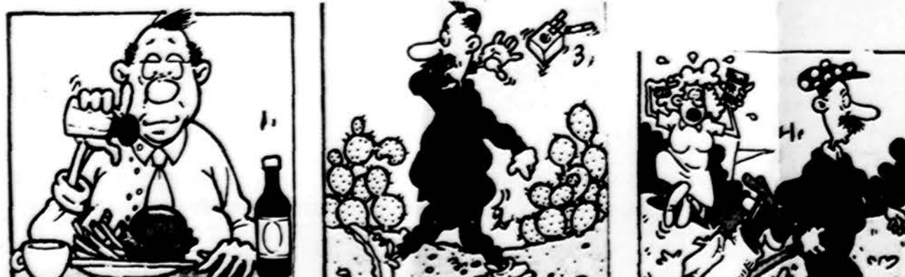
Kratydamas hipertenzijos mažiausiai bent ketveriopa elkis: 1. Nevartok druskos ir nevalgyk sūrių valgių. 2 ir 3. Vaikščiok darbuokis kasdien ir mesk šalin rūkalus. 4. Nepamiršk kasdien paimti gydytojo patartų vaistų; pats tvarkykis: ne visi turi tokias geras žmonas kaip čia šioji, kuri iš paskos saukdama neša vyrui vaistus.