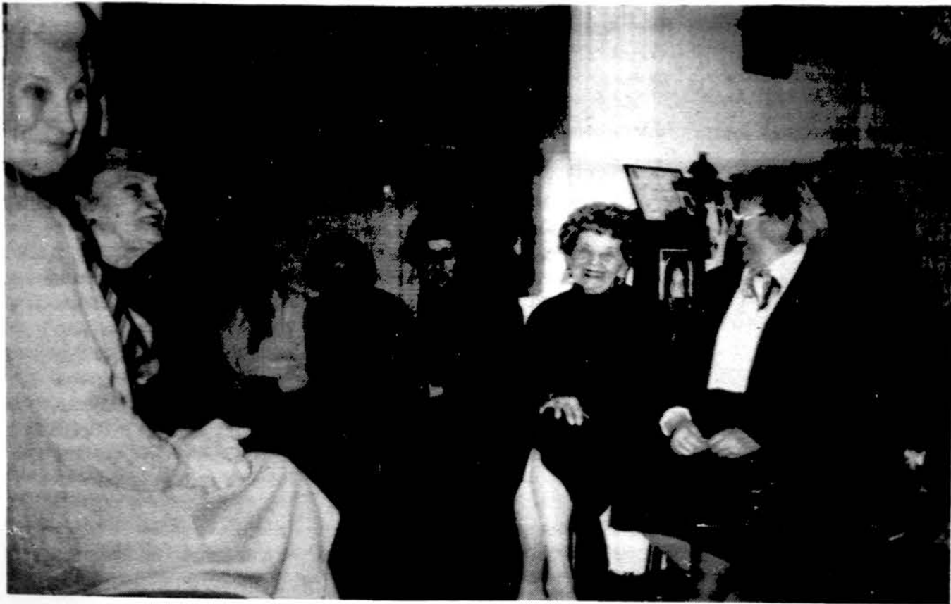
LAK Moterų sąjungos 5 kuopos susirinkime.