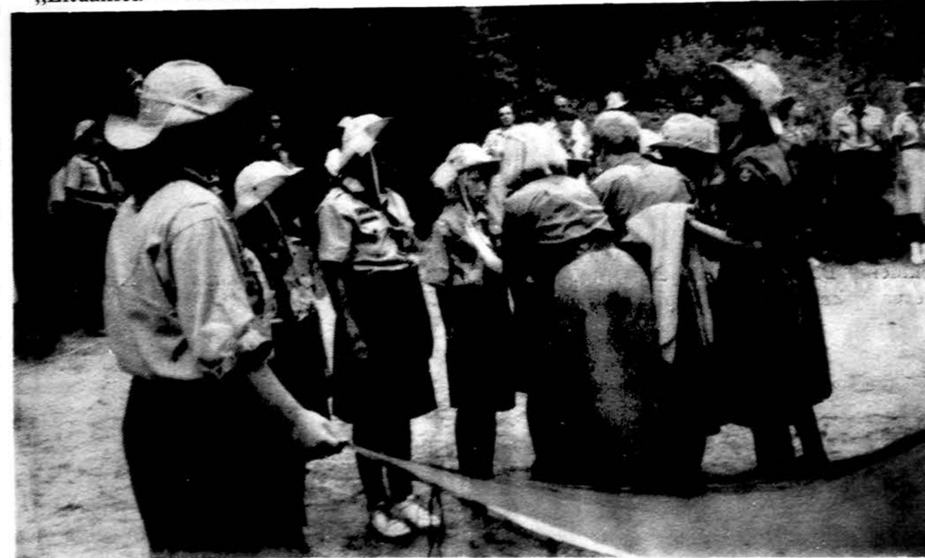
Sesų įžodis Rako stovyklavietėje.

skautai, es, jūrų jaunieji, es ir jūrų skautai, es palapinėse nakvos 2 naktis. Jaunesnieji skautai, es, bebrai ir ūdyrės palapinėse nakvos vieną naktį. Mokestis jaunesniems skautams, es – 15 dol. asmeniui. Visiems kitiems – 20 dol. asmeniui. Mokestis ir registracijos lapai (užpildyti) turi būti nedelsiant įteikti vieneto vadovui, ei. Čekius rašyti: „Lithuanian Scouts Association“. Daugiau informacijų bus suteikta po dalyvių registracijos.