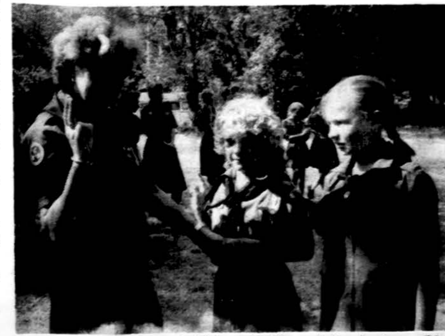
Europos rajono stovykloje, Anglijoje, po įžodžio naująsias skaites sveikina kaklaraiščius joms užrišusi vadovė.

Rugpjūčio 1 - 25 d. – Kanados rajono stovykla „Romuvos“, netoli Toronto, Canadoje.