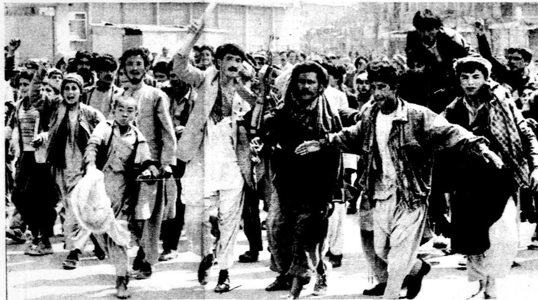
Afganistano sostinės Kabilo gyventojai užtvindė gatves, kai praėjusį šeštadienį islamiškieji laisvės kovotojai paėmė sostinę ir užėmė Vyriausybės pastatus.

– Libijos diktatorius Moammar Gadhafi tarėsi su Sirijos oficialiais pareigūnais, ir Sirija pažadėjusi kovoti prieš Jungtinių Tautų embargo dėl lėktuvų skridimo į Libiją.