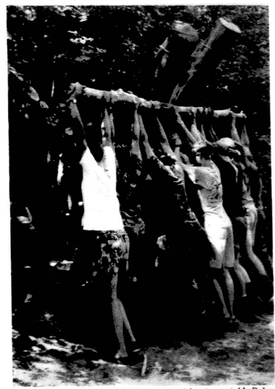
„Lituanicos“ tunto skautai vyčiai stato savo suprojektuotą paminklą Rako stovyklavietėje.

GYDYTOJAS IR CHIRURGAS 6745 West 63rd Street Val. pirm., antr., ketv. ir penkt. 3-6; Šeštadieniais pagal susitarimą