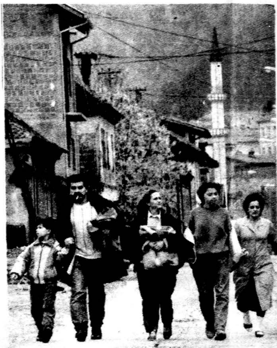
Naujieji pabėgėliai bėga iš namų Bosnijoje ir Hercegovinoje, kai serbų kareiviai juos persekioja ir žudo, nekremdami dėmesio į paskelbtas paliaubas.

— Rygos radijas pranešė, jog du MIG-27 lėktuvai buvusių sovietų ginkluotųjų pajėgų sudužo Latvijoje tą pačią dieną, nors tarp jų nevyko susidūrimo. Abu pilotai užsimušė, bet ant žemės nebuvo užmušta ar sužeista žmonių. Latvijos vyriausybė nebuvo painformuota apie šių svetimoms valstybės lėktuvų skridimus.