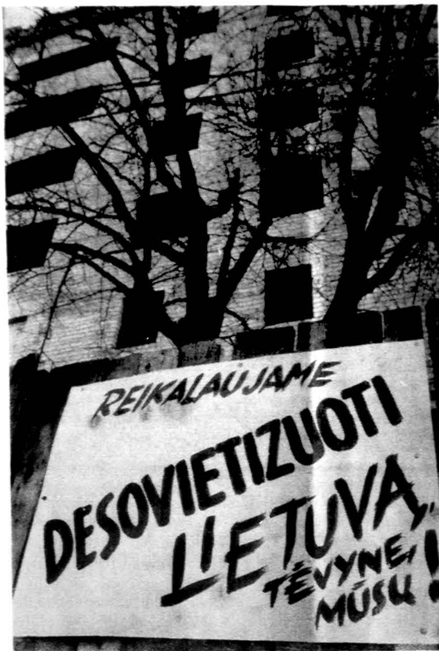
„Desovietizuoti Lietuvą“ – tokie šūkiai buvo matyti Kovo 11 d. minėjimuose Vilniuje.

Artėjanti Tautinių šokių šventė jau išjudino mūsų gražų