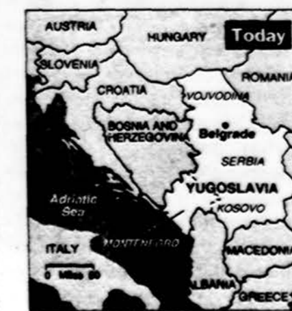
Naujoji Jugoslavija daug mažesnė, negu ji buvo po II Pasaulinio karo, kai pateko į komunistų rankas.