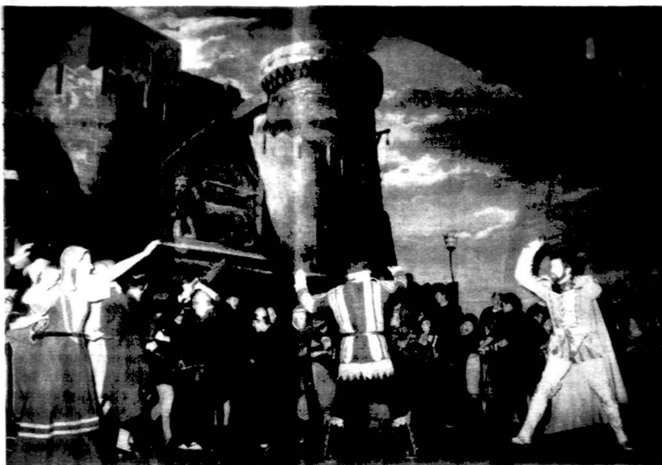
Lietuvių operos „Otello“ spektaklio I veiksmo scena.