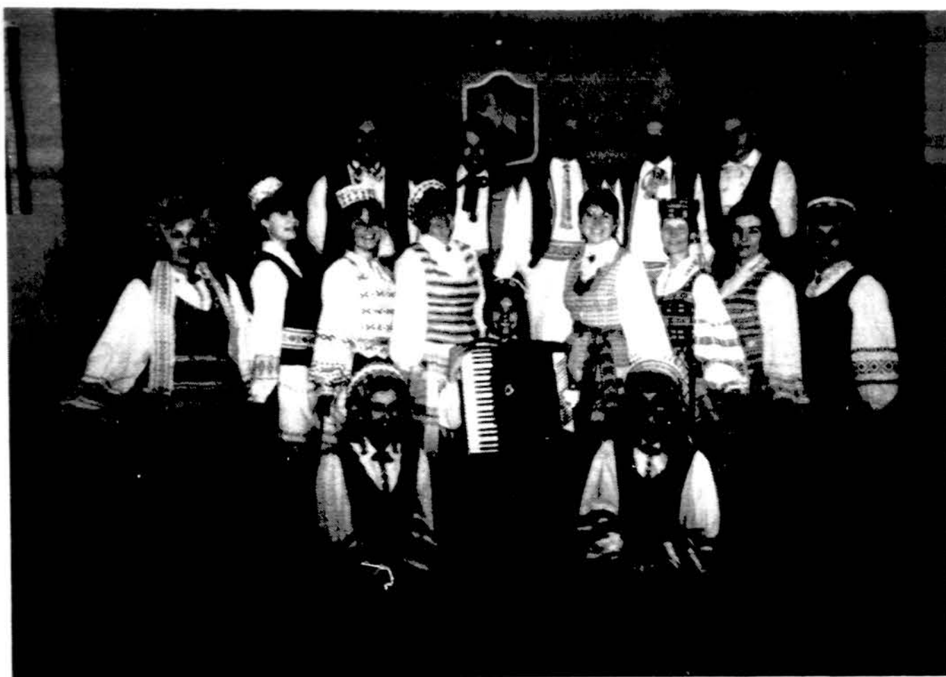
„Žilvinas“, Philadelphijos tautinių šokių grupė.