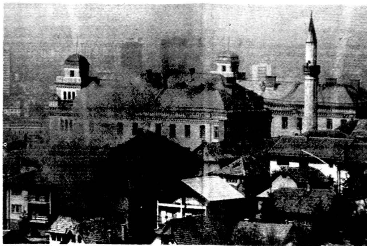
Sarajevas, Bosnijos-Herzegovinos sostinė skęsta gaisrų dūmuose. Tarptautinės šalys įstaigos sako, jog šimtai žmonių yra užmušta ir daugiau kaip 570.000 žmonių liko be namų. Iš viso ten gyventojų yra 4.3 milijonai žmonių.

— Lenkijos prez. Lech Walasa pareiškė, jog lenkų visuomenė „serga nuo amžinos krizės“ ir paprasė Seimą suteikti jam daugiau egzekutyvinių teisių, įskaitant skirti Lenkijos ministrą pirmininką ir kabineto narius.