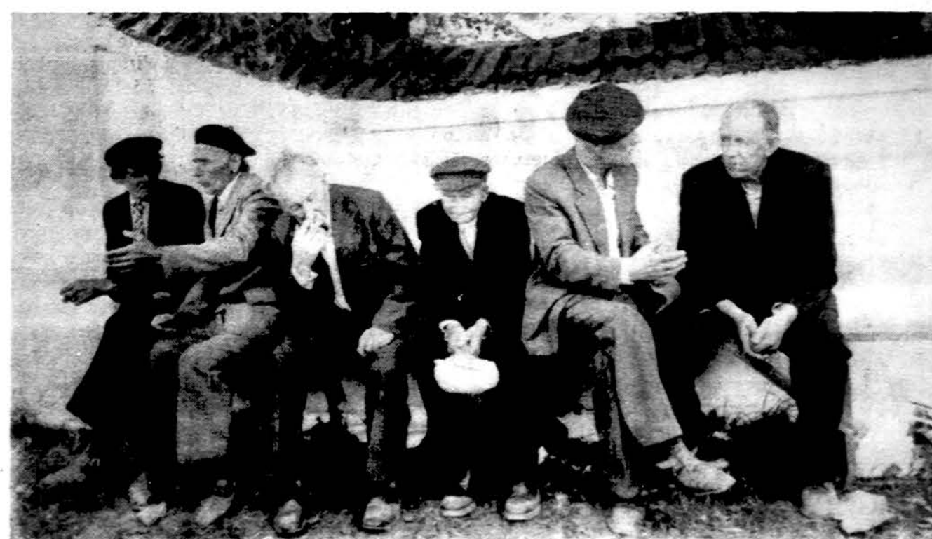
Po atlaidų, Kražiai. Dabar galima pašneketi ir pasiginčyti.

Romualdo Požerskio nuotr. iš albumo „Atlaidai“. 1990