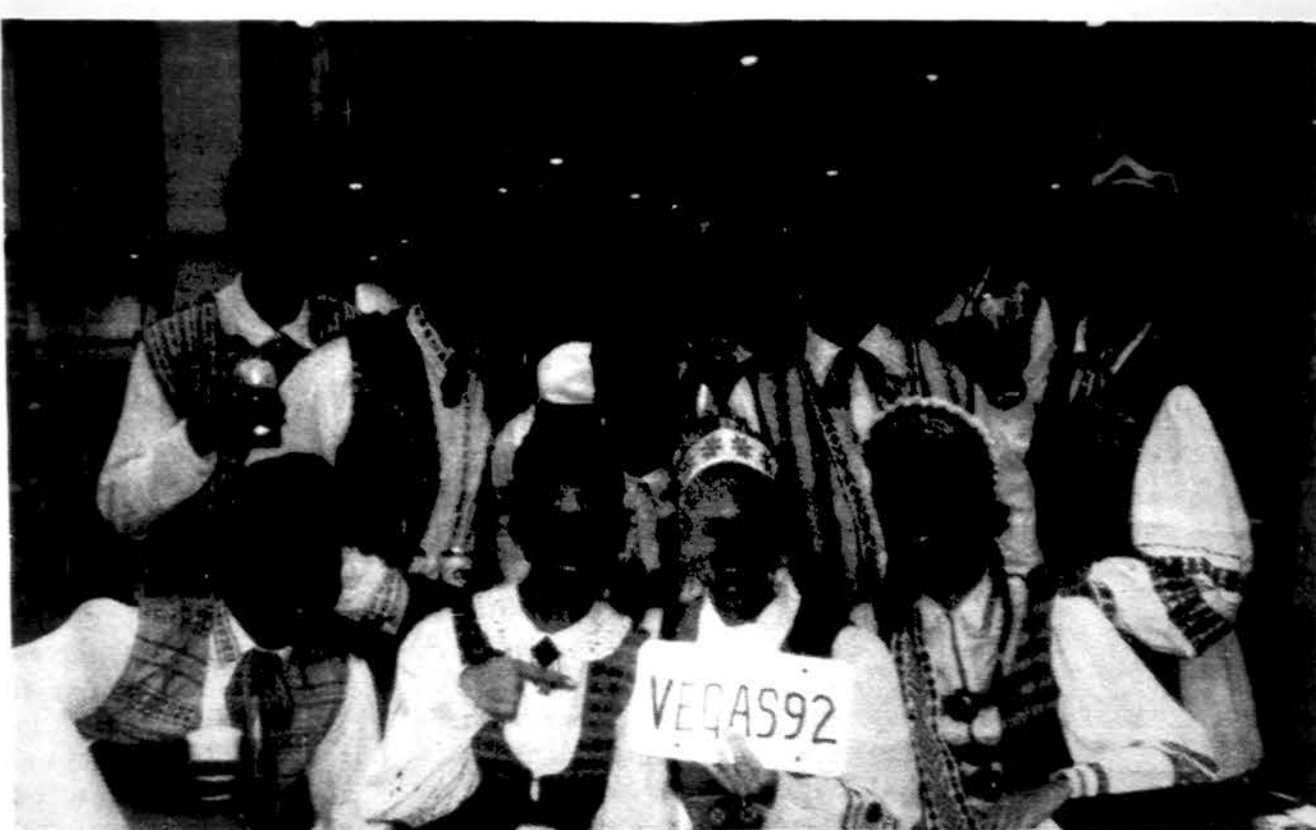
Dalis „Spindulio“, Los Angeles tautinių šokių ansamblio, kuris balandžio 26 d. šoko Las Vegas Tarptautiniame šokių festivalyje.