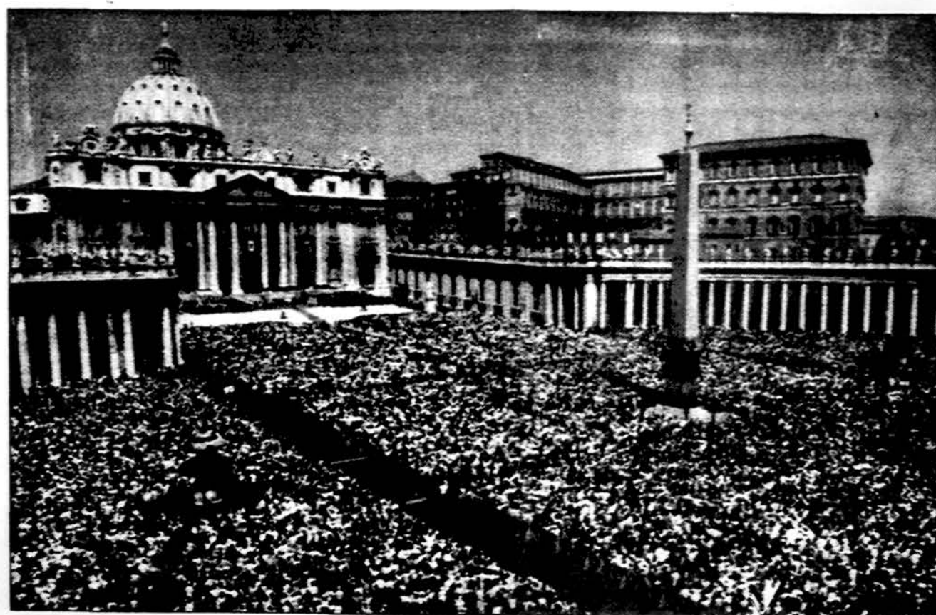
Piligrimai iš viso pasaulio praėjusį sekmadienį pripildė Švento Petro aikštę Romoje, kai buvo paskelbtas palaimintuoju „Opus Dei“ organizacijos įsteigėjas prelatas Josemaria Escriva de Balaguer iš Ispanijos. Tai buvo pati didžiausia maldininkų minia, atvykusi iš 60 kraštų, kai Jonas Paulius II tapo popiežiumi 1978 metais.