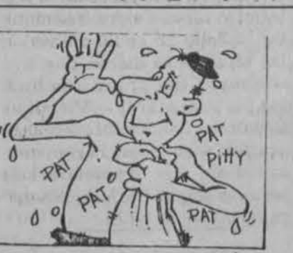
1. Odos sausumas visada nemalonus kelia niežėjimą, ypač esant sausroje ir žiemą apšildomoje patalpoje. 2. Reikiama elkis maudymasis, kitaip dar daugiau gali sausinti odą. 3. Gerk daug vandens ir kitų naudingų skysčių; tris kartus per dieną valgyk sveikas sriubas; kai reikia naudok gerus odos drėkintojus.