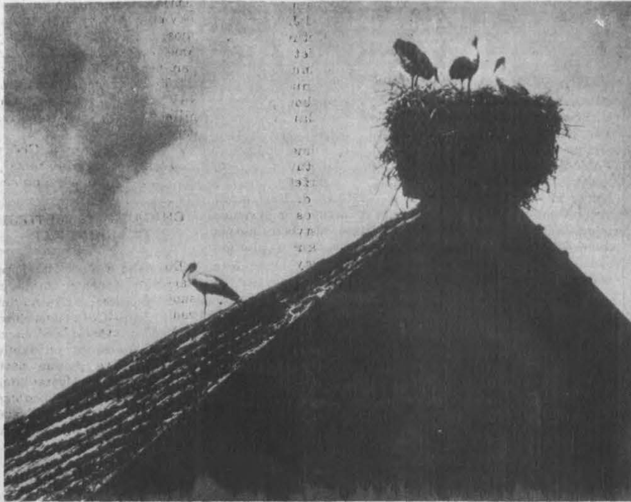
Lietuvų mėgstamieji ir globojami gandrai.