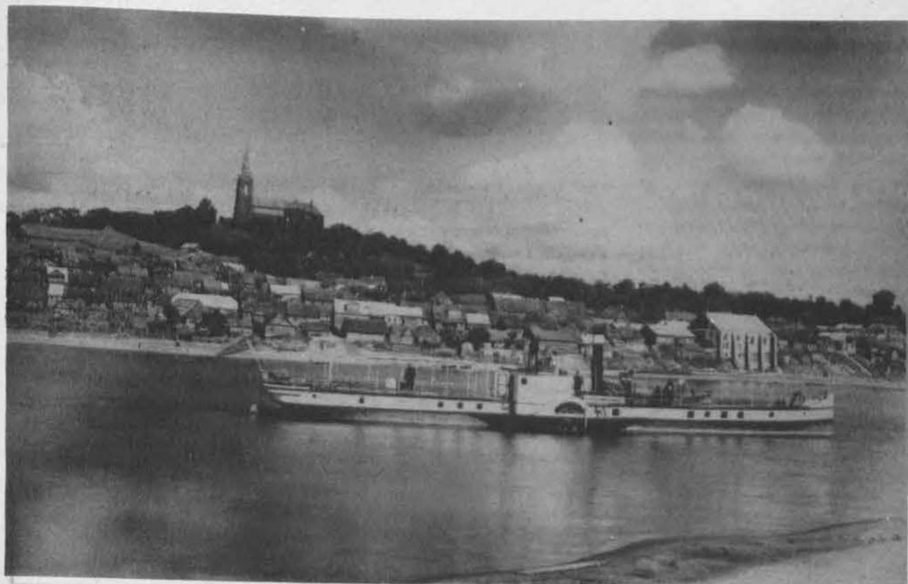
Vilkyja. Prieškarinė nuotrauka