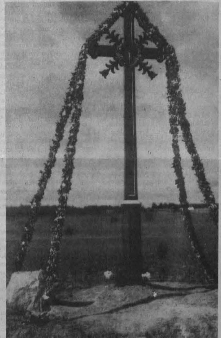
Vainikais papuoštas kryžius prieš Sekmines. Šiaulėnų vals., Šiaulių apskr. B. Buračo prieškarinė nuotrauka

Poezija tai protas, nudažytas jausmais. Wilson