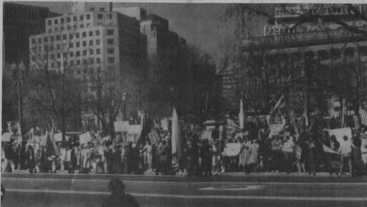
New Yorko lietuviai prie uosto su vėliavomis ir plakatais.