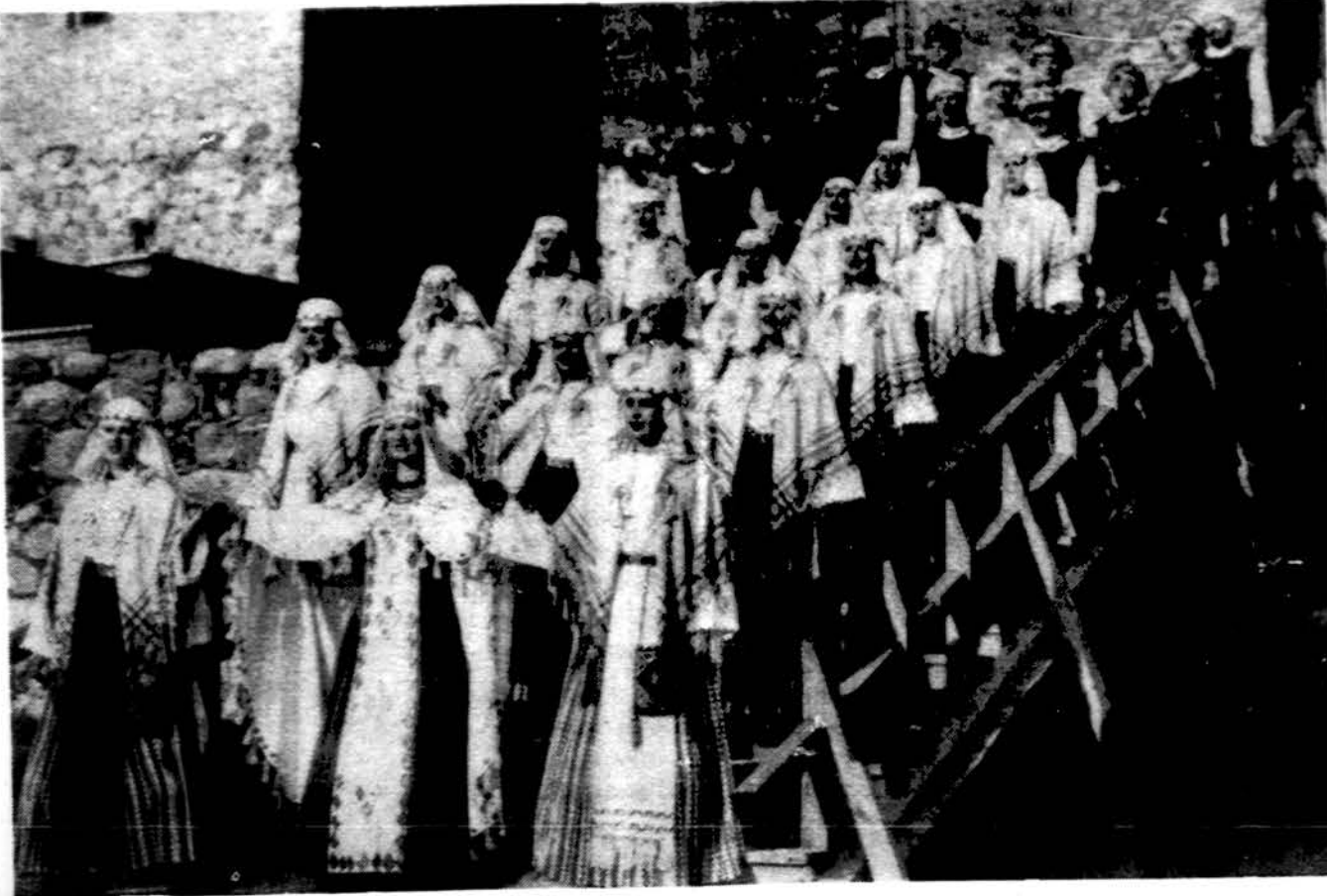
„Lietuva“, tarptautiniai pripažintas dainų ir šokių ansamblis, pirmą kartą atvyksta į Ameriką ir čia Drury Lane Oakbrook Terrace teatro patalpose atliks dviejų savaitių spektaklius nuo liepos 8 iki liepos 19 dienos. Atvyksta 30 to ansamblio narių. Ansambli pakvietė amerikiečių organizacija, kuri kviečia panašius meno vienetus iš daugelio pasaulio kraštų.

x KONTEINERIAI Į LIETUVĄ siunčiami kas 2 savaites. Daiktai pristatomi mums paštu arba UPS. TRANSPAK, 2638 W. 69 St., Chicago, IL 60629, tel. 312-436-7772.