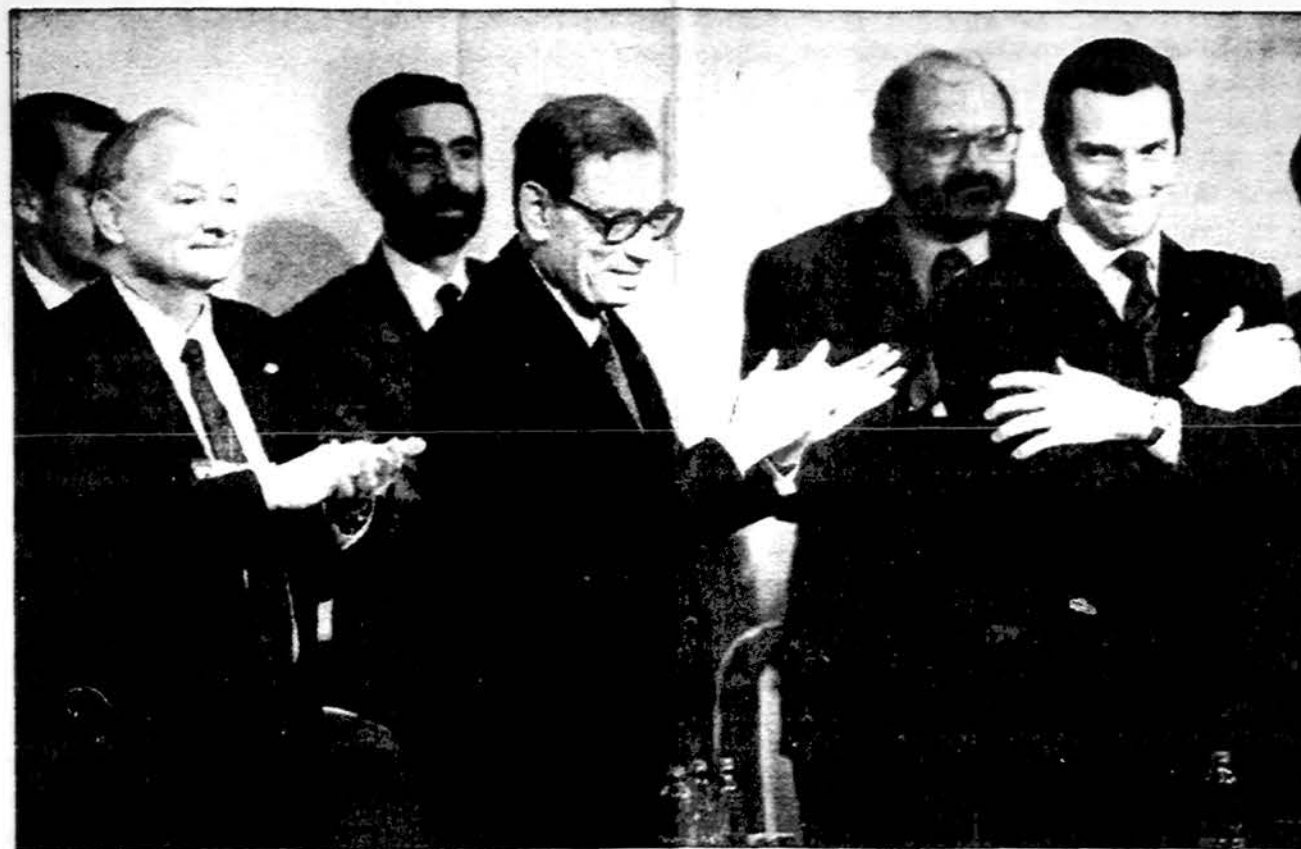
Sekmadienį birželio 14 d., per Rio de Janeiro mieste vykusios konferencijos dėl aplinkos ir vystymosi uždarymą, konferencijos vadovas Maurice Strong (kairėje) ir JT Generalinis Sekretorius Boutros Boutros-Ghali ploja Brazilijos prezidentui Fernando Collor de Mello (dešinėje) po jo užbaigtosios kalbos. JT Gen. sekr. Boutros-Ghali savo baigiamajame žodyje pareiškė, jog dabar jau 12 dienų trukusios diskusijos turės tapti veiksmais.

Šiomis dienomis gautas VVTO 1992 m. balandžio mėn. informacinis biuletenis „VVTO naujienos“ Nr. 4, kuriame pirmą kartą rašoma ir apie turizmą Baltijos valstybėse: