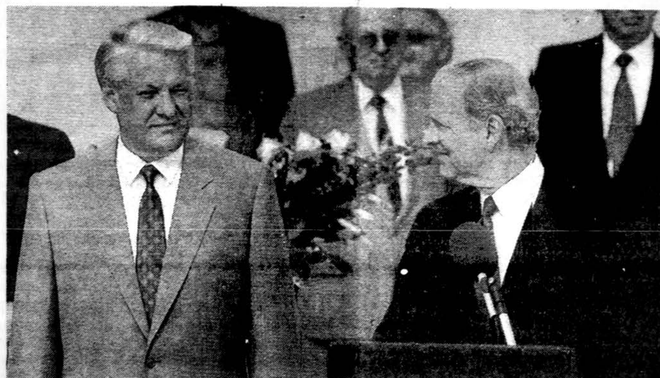
JAV Valstybės sekretorius pasitinka Rusijos prez. Boris Jelciną Andrews AFB, Marylande. Per šiuos Jelcino ir JAV prez. George Bush pasitarimus tikimasi, kad bus įmanoma JAV-ems ir Rusijai pasirašyti ginklų mažinimo sutartį. JAV prisipažįsta, kad siekia išlaikyti viršumą, bet ne dėl to, kad Rusija būtų priešas, o kadangi JAV-ems tenka daugiau atsakomybės pasaulinės taikos išlaikymui. Be to, sakė prez. Bush: „Man svarbu neužmiršti, kad prez. Jelcinas turi sunkumų iš senų militaristų pusės dešinėje ir iš kitų, kurie gali būti ne taip užsiąngavę demokratijai, kaip jis pats“.

Birželio 17 d. „Litexpo“ rūmuose atidaroma paroda „Verslas 92“. Joje dalyvaus apie 90 įmonių, akcinių bendrovių bei privačių firmų. Tą pačią dieną „Litexpo“ rūmuose prasidės tarptautinis forumas „Verslo laisvė“, kuriame bus diskutuojama apie privatizavimą Lietuvoje, mokesčių, infliacijos ir kitas problemas, su kuriomis susiduria Lietuvos verslininkai.