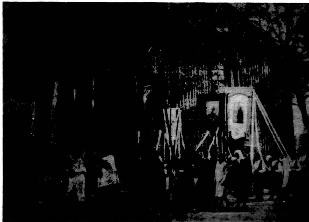
Procesija Papių.