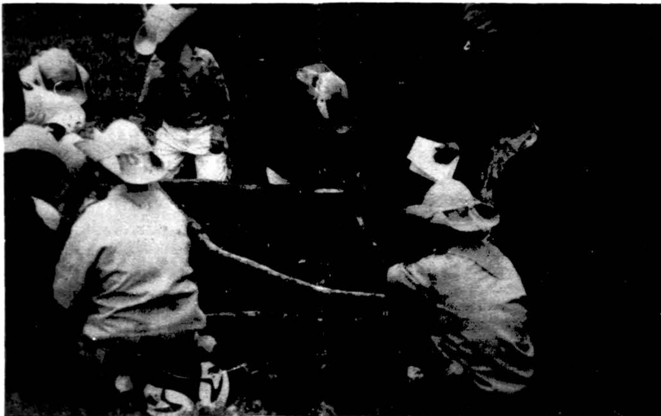
„Jamboree 1992“ sesės Dana Butts ir Onate Utz stebi „Nuodingų augalų“ skiltį statant „romėnų vežimą“.

Skautų ir skautėlių rytinė programa rėmėsi skautamokslinio uždaviniais. Buvo aštuonios