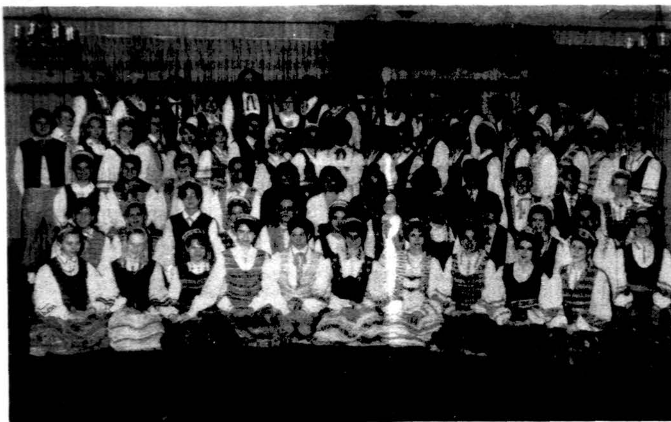
„Grandies“ tautinis ansamblis, Chicagoje, pasirodęs Šokių šventei.