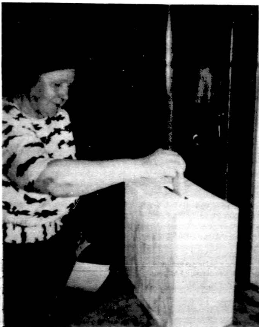
Brocktonietė Liuda Senutienė gegužės 23 d. balsuoja referendume dėl Lietuvos Respublikos prezidento institucijos atstatymo.