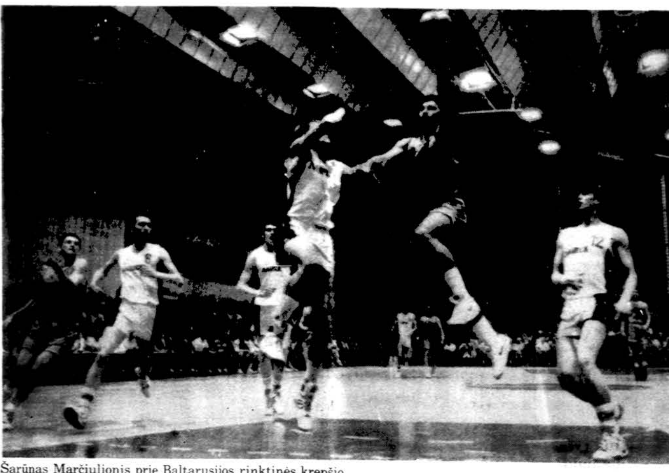
Šarūnas Marčiulionis prie Baltarusijos rinktinės krepšio.