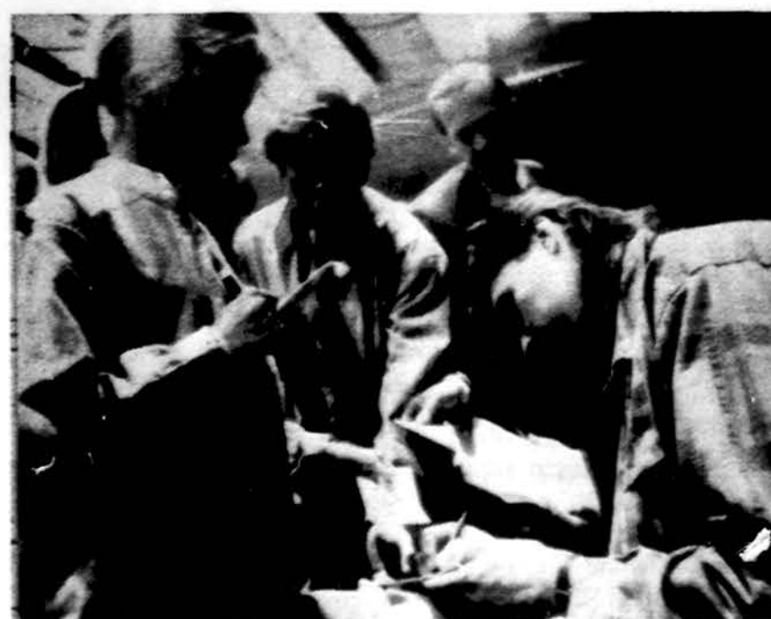
Arvydas Sabonis teikia autografus.

Saulė teka 5:18, leidžiasi 8:29. Temperatūra dieną 78 F (25 C), naktį 55 F (12 C), į pavakare galimybė lietaus su perkūnija.