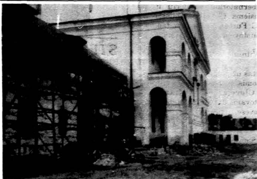
Pažaislio bažnyčios ir vienuolyno remontuojama dalis.