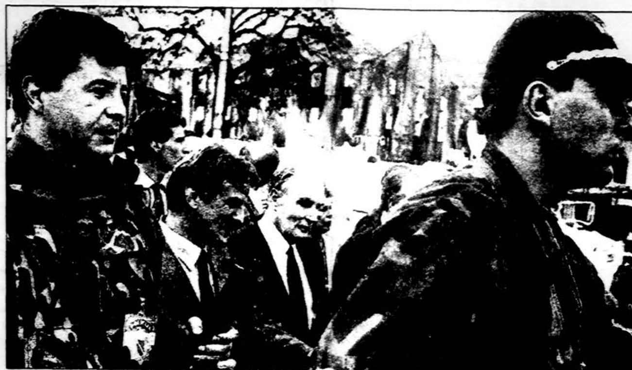
Prancūzijos prez. François Mitterand (trečias iš k.) apsuptas Bosnijos saugumo dalinių, žygiuojančių Sarajevo mieste, atvykęs į Sarajevo perduoti Bosnijos-Herzegovinos rezistentams vilties ir pastiprinimo linkėjimus, nors visą laiką apylinkėse vyko susisaujami. Perspėtas apie šaudymosi pavojų, Mitterand iš Kroatijos Split miesto malūnsparniu atskrido į Sarajevo aerostotą sekmdienį. Sekmadienio vakarą Sarajevo miestą apsupę serbų sukilelių daliniai pranešė kad jie Sarajevo aerostotą perduoda Jungtinių Tautų daliniams ir vidurnaktį jau JT pranešė, jog serbai iš aerostoto atsitraukė.

– Arabų kraštai patenkinti Darbo partijos laimėjimais Izraelio rinkimuose, nes dabar gali tikėtis našesnių ir spartesnių taikos derybų. Nors Yitzhak Rabin yra priešingas Palestinos valstybei, bet jis labiau linkęs suteikti palestiniečiams autonomiją ir sustabdyti žydų gyvenviečių statybą 1967 m. okupuotose arabų žemėse.