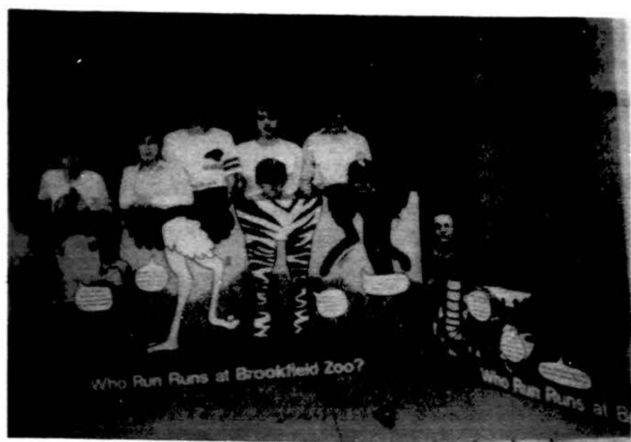
Būrelis Lietuvos vaikų Brookfield zoologijos sode. Juos, atvykusius į JAV gydytis, globoja „Lietuvos Vaikų Viltis“.