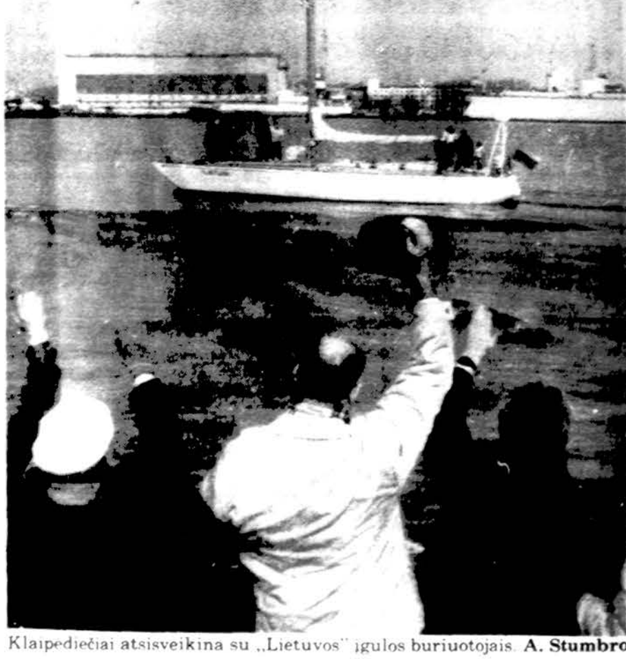
Klaipėdiečiai atsiveikina su „Lietuvos“ igulos buriuotojais.