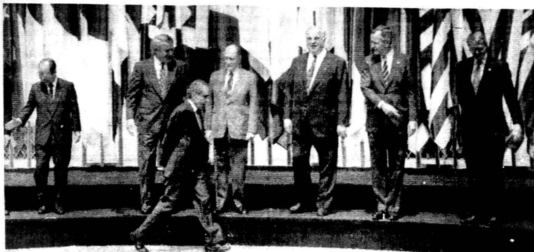
Septynių pramoninių valstybių vadų pasitarime Miunchene bendrai nuotraikai ruošė Japonijos ministeris pirmininkas Kiichi Miyazawa, Kanados ministeris pirmininkas Brian Mulroney, Prancūzijos presiden-

Kaune pradėjo veikti pirmoji mieste privati radijo stotis „Titanika“. Ją įkūrė UAB „Apa“ ir miesto viešoji biblioteka. Transliuojamos laidos girdimos 50 kilometrų spinduliu. Eterio laikas aštuonios valandos per parą. Kol kas stotis turi dvi pagrindines programas: „menopolis“ (muzika) ir komercinis kanalas „radioturgus“, kuris rek-