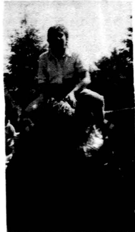
Jauna lietuvaitė, atvykusi į Ameriką gydytis, susipažįsta su Brookfield zoologijos sodo „pabaisa“.