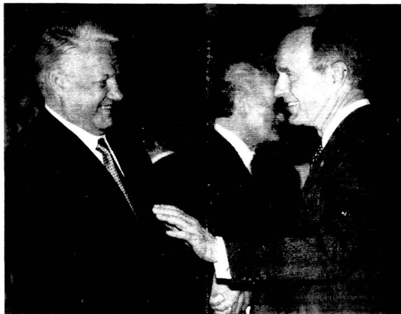
Prez. George Bush sveikina Rusijos prezidentą Boris Jelciną po to, kai jis išgavo 1 bilijoną dolerių ekonominės pagalbos iš septynių didžiųjų pramoningų demokratijų trečiadienio vakarą Miunchene.

Sao Paulo lietuvių atsiųstą 2,106 dol. auką prez. V. Landsbergis siūlo naudoti pradėti pagalbos fondą Rytų tremtiniams ir jų palikuonims, norintiems sugrįžti į Lietuvą.