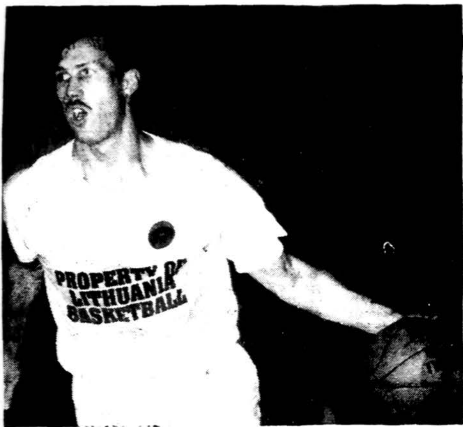
Šarūnas Marčiulionis, Lietuvos olimpinės krepšinio rinktinės narys, Ispanijoje vykusio Europos valstybių atrankinio krepšinio turnyro vertingiausias žaidėjas.

Lietuviams taškus pelnė: Marčiulionis 40, taip pat jis surinko 14 atšokusių kamuolių, Karnišovas 18, Sabonis 16, Krapikas 12, Kurtinaitis 9, Chomičius 5.