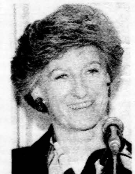
Hanna Suchocka po nominavimo Lenkijos ministrė pirmininkė.

— JAV miestai, nežiūrind visur jau labai mažinamą valdišką pašalpos programų vistik daugelyje atvejų turės stambius deficitus. Deficito 1992 m. tikisi 54% iš 620 apklausių savivaldybių, o 71.5% visų apklausių turėjo kelti mokesčius ar uždėti naujus.