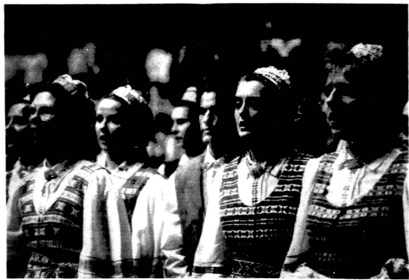
Lietuvos himnas jautriai aidi iš šokėjų lūpų IX Tautinių šokių šventėje.

Kad „Draugas“ išliktų dienraščiu, rėmėjai, bendradarbiai ir skaitytojai prašomi pagalbos. Ruošdami testamentinius palikimus, nepamirškite „Draugo“ ir jo leidėjų. Viename punkte maloniai prašome įrašyti: „I give and bequeath the sum of... to „Draugas“ (arba to the Lith. Marian Fathers), 4545 W. 63th St., Chicago, IL 60629“. Aukos „Draugui“ ir Marijonų vienuolijai nurašomos nuo valstybinių mokesčių.