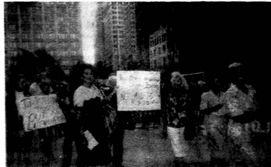
Dalis demonstracijų dalyvių Chicagoje, kur buvo reikalaujama, kad paramos paskyrimas Rusijai būtų ribamas su kariuomenės išvedimu iš Pabaltijo valstybių.

Olandiška apranga imponuoja. Šoka linksmai, gyvai. Stebie-