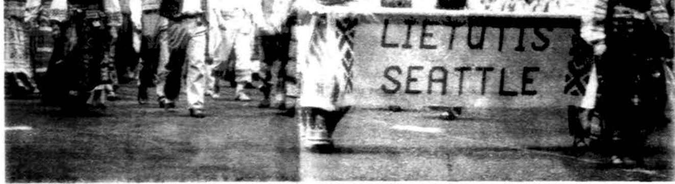
Seattle „Lietutis“ — tai viena iš 53 šokėjų grupių išgytusių į IX šokių šventės areną.

Štai lietuvis iš Šiaulių, besilankydamas Amerikoje, rašo, jog pasirinko vieną firmą, reklamuojamą „Drauge“, kuri buvo arčiausia jo laikinosios gyvenamosios vietos. „Labai sunkiu Lietuvai laikotarpiu pasiunčiau iš Chicago į Lietuvą savo šeimai siuntinį. Pagal Jūsų laikraštyje skelbtą reklamą, siuntinys turėjo pasiekti adresatą po 14 dienų. Praėjus 60 dienų, siuntinys šiaip taip pasiekė adresatą po daugelio kreipimosi į... Maisto siuntinys buvo tiesiog pasityčiojimas: produktų per pusę mažiau negu saraše, o kokybė — tiesiog neįmanoma aprašyti! Vel kreipiausi į firmą ir per didelius vargus grąžino pusę pinigų. Galvoju, gal tikrai ne iš firmos kaltės