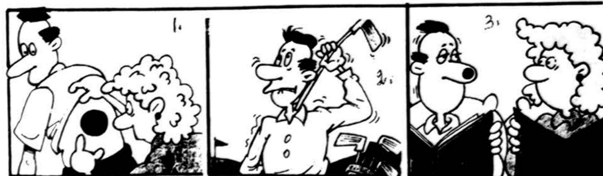
1. Tarkis su gydytoju, kai odos dėmė keičia spalvą, dydį ar paviršų. 2. Taip elkis, kai odos dėmė pradeda kraujuoti, paviršius jos grublėti ar kai ji ima niežėti. 3. Neapsileisk, kai staiga nauja dėmė odoje išdygsta.