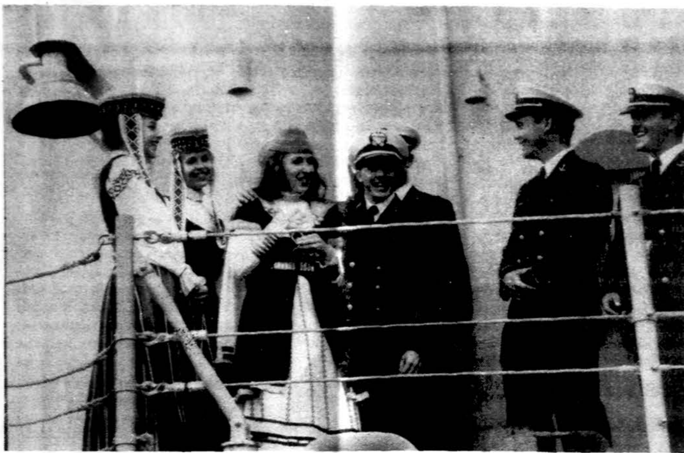
Lietuvaitės sveikina USS Hawes igulą, laivui įplaukus į Klaipėdos uostą. Tai pirmas amerikiečių karo laivas, apsilankęs Lietuvos teritoriniuose vandenyse po 1928 m.

x TRANSPAK siunčia siuntinius, baldus; parūpina butus, automobilius, traktorius. Pervedam dolerius. Transpak, 2638 W. 69 St., Chicago, IL 60629, tel. 312-436-7772. (sk)