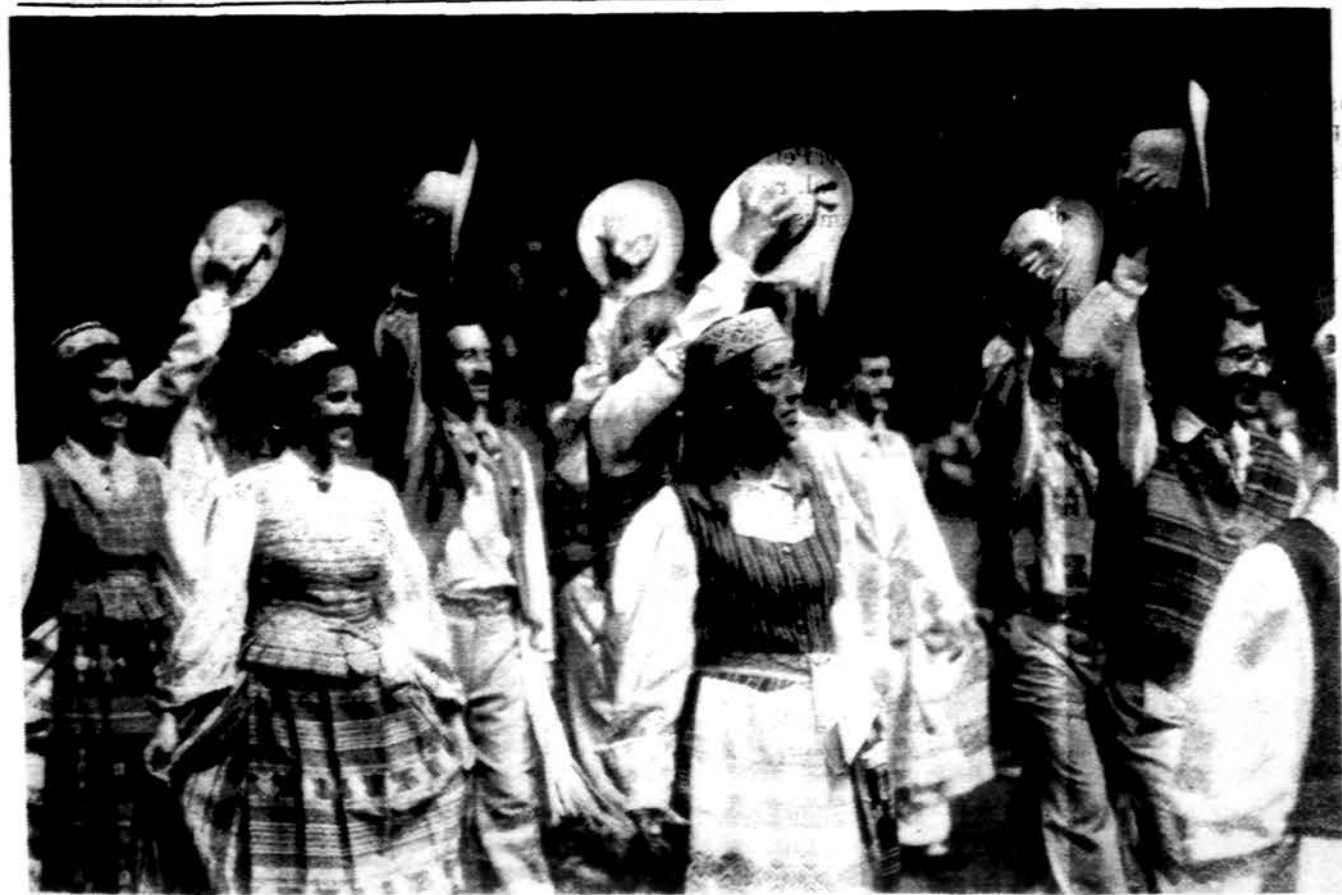
„Sveiki žiūrovai ir svečiai!“ — į IX Tautinių šokių šventės areną išgytuoja šokėjai.

Amerika paskelbė sankcijas prieš Serbiją tik tada, kai Bosnijos — Hercegovinos užsienio reikalų ministras praėitą mėnesį atvyko į Washingtoną perspėti Ameriką, kad jo krašte vyksta visiškos skerdynės.