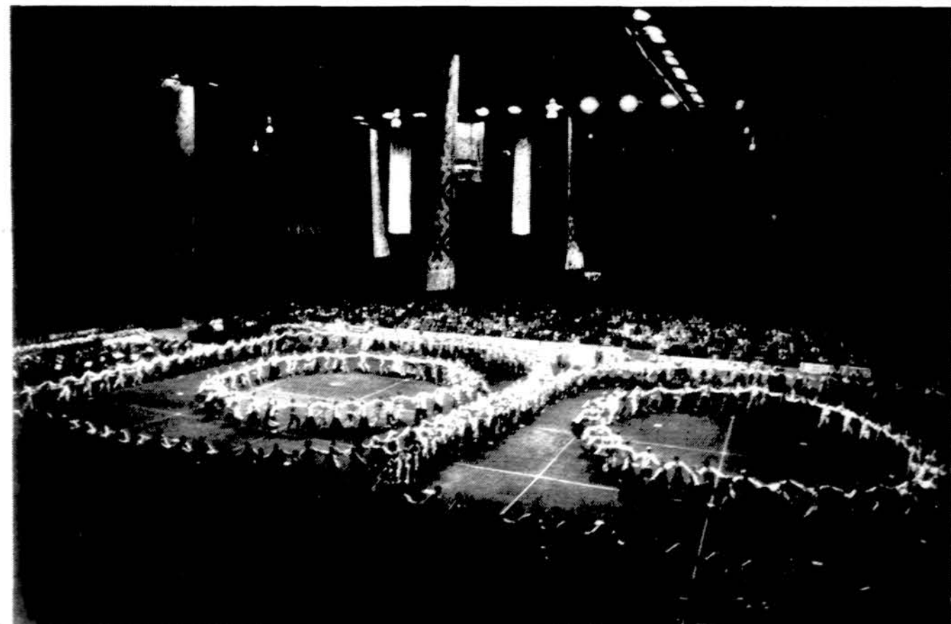
Lietuvių Tautinių šokių šventėje sudaryti šokių ratukai