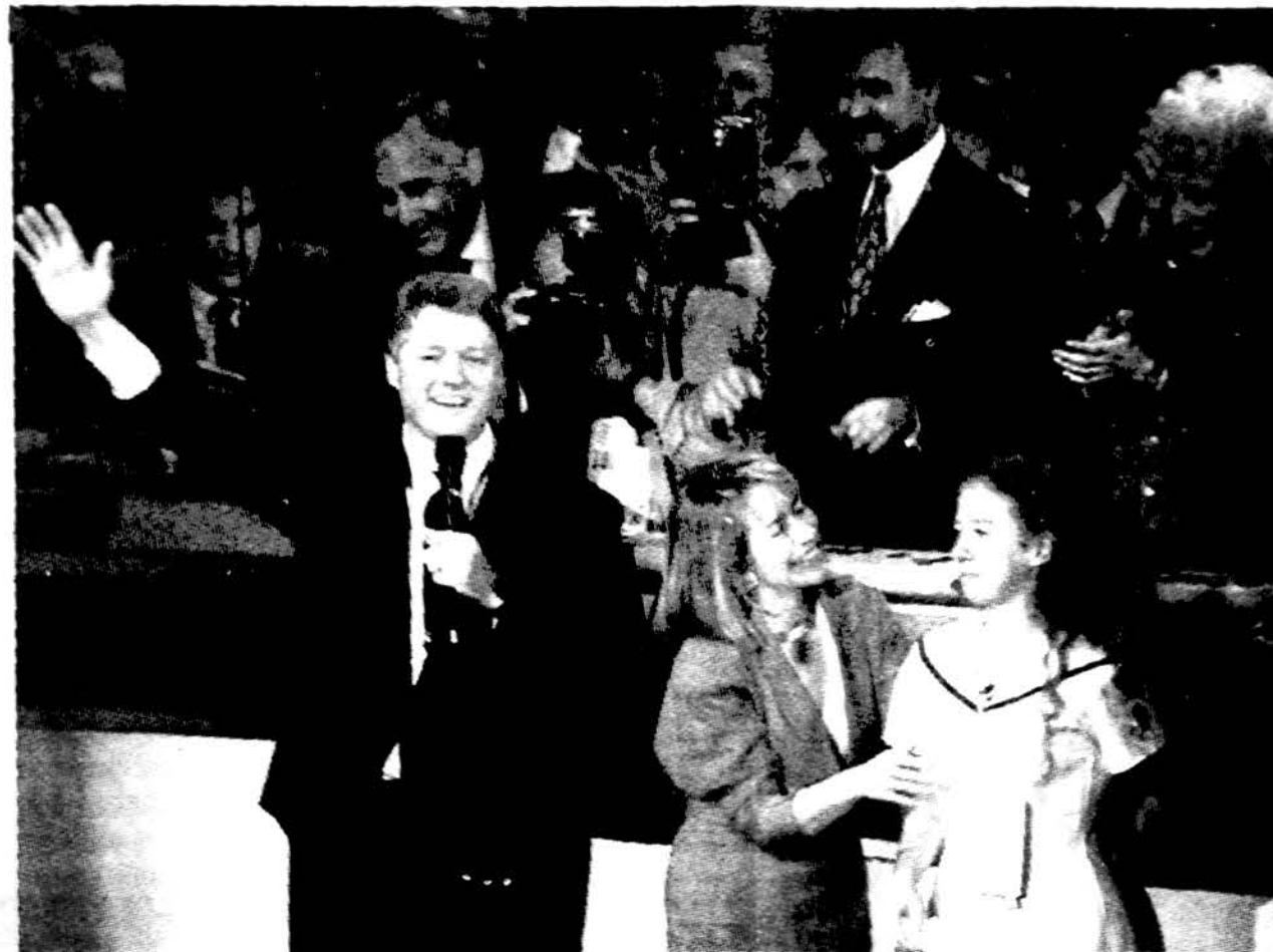
Demokratų suvažiavime New Yorke trečiadienio vakarą Demokratų partijos nominuotas kandidatuoti į JAV prezidentus Arkansas valstijos gubernatorių Bill Clinton mojuoja, prie jo žmona Hillary ir dukra Chelsea. Už jų dešinėje suvažiavimo pirmininke Texas gubernatore Ann Richards ir šalia jos JAV Demokratų partijos pirmininkas Ronald H. Brown. Gub. Clinton surinko reikiama skaičių balsų nominacijai alfabeto tvarka priėjus tik iki Ohio valstijos delegatų balsų. Iminai su Ohio valstija Clintonas surinko 2,244 balsų, Californijos gub. Jerry Brown - 458, sen. Paul Tsongas - 153 ir įvairiems kitiems buvo duota 73 delegatų balsų.

Prancūzijos ambasada Lietuvoje surengė priėmimą Prancūzijos išsivadavimo šventės - Bastilijos paėmimo dienos progai. (L.K.)