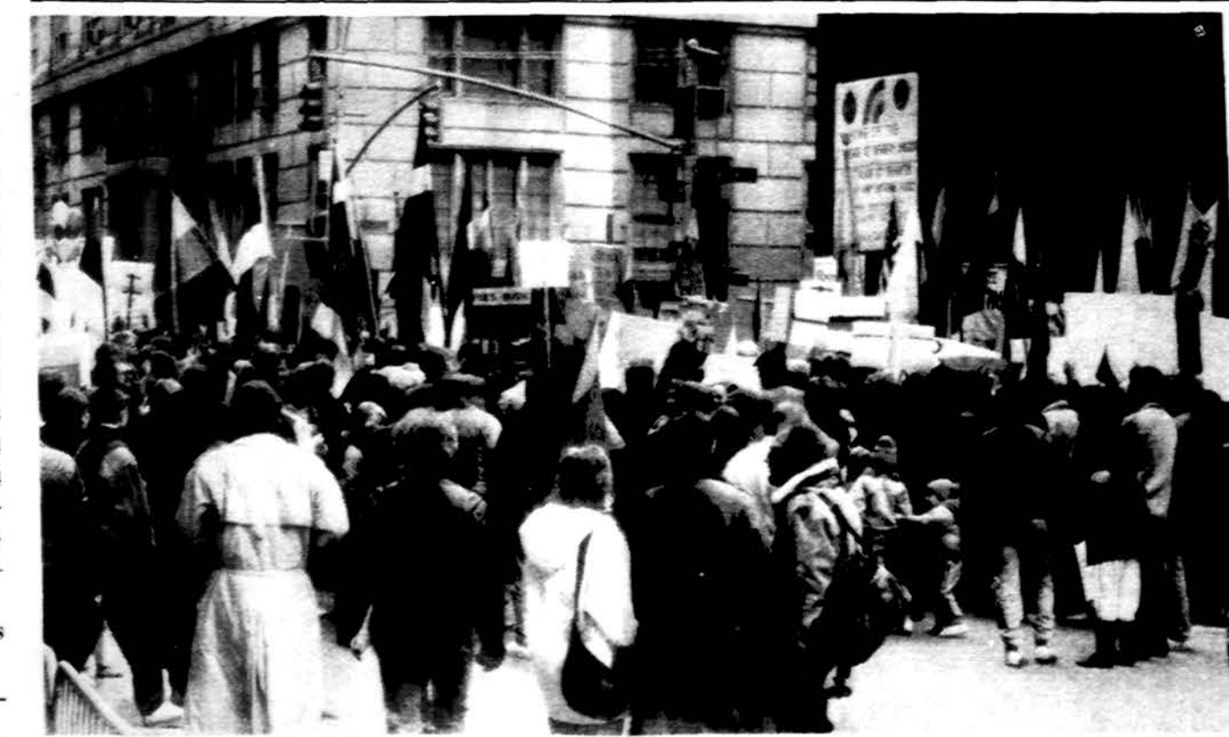
Lietuvių minia, susirinkusi New Yorke prie uosto.

Seimo išvakarėse visų atstovų ir svečių nuotaika buvo gera, pakili su viltimi, kad rytojau dieną pradės VIII PLB seimo darbus.