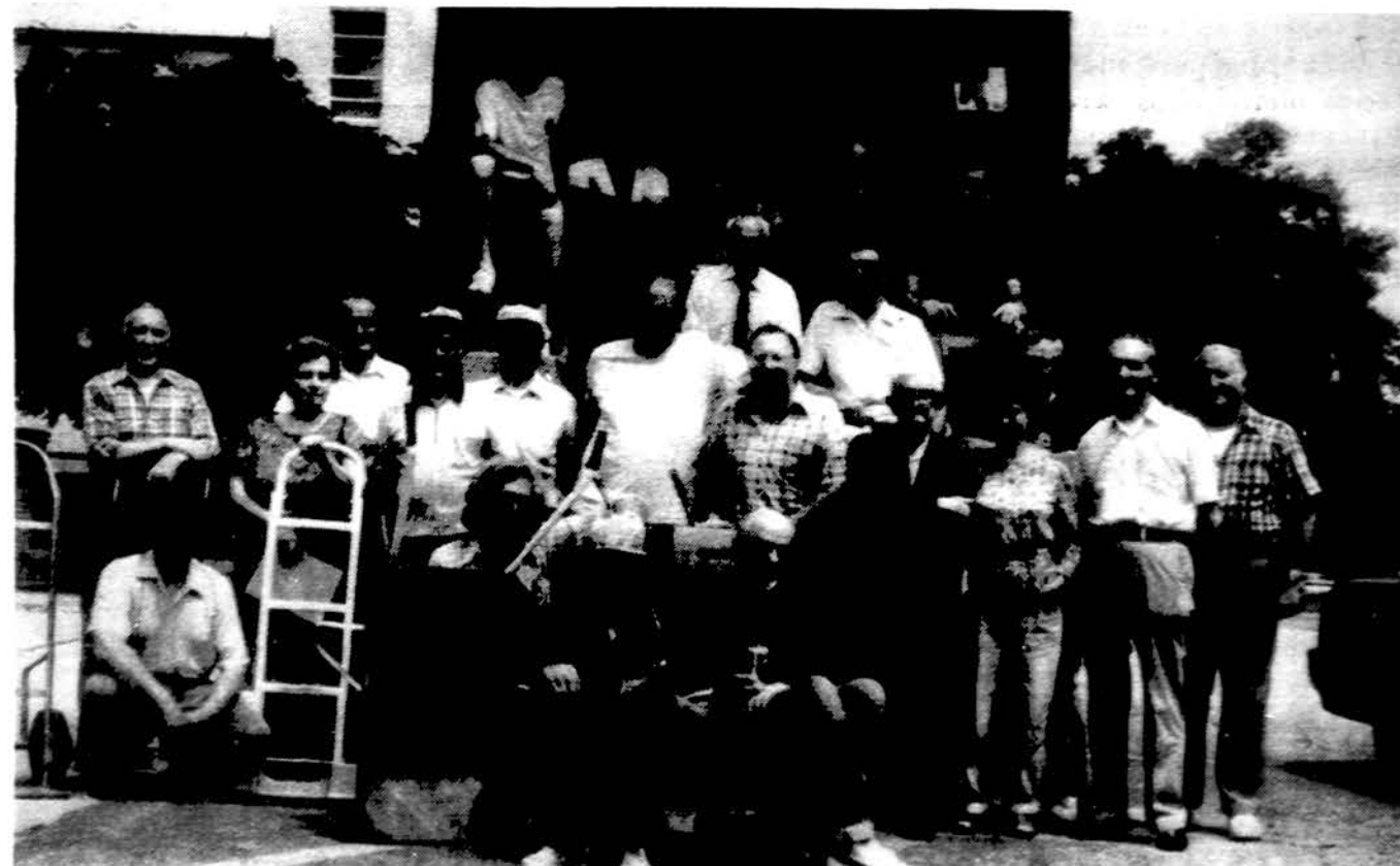
Talkininkai Jaunimo centre pakrovė konteinerį knygų į Lietuvą.