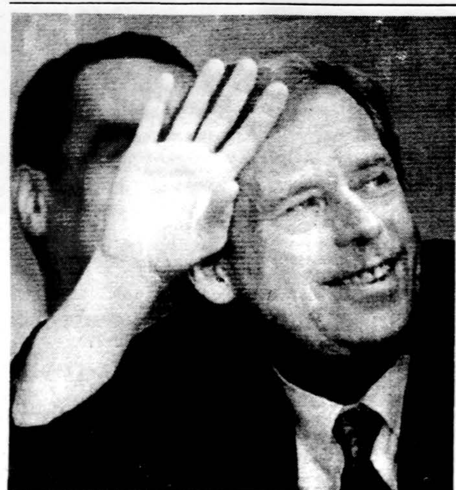
Vaclav Havel mojuoja iš Prahos pilies lango po savo atsistatydinimo, nes jis nori duoti valią istorinei srovei, traukiančiai kraštą suskilti į dvi valstybes.

Saulė teka 5:34, leidžiasi 8:19. Temperatūra dieną 76 F (24 C), naktį 65 F (18 C), debesuota, galimybė lietaus.