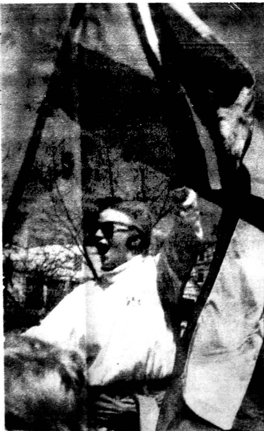
Laukia lietuviškų laivų New Yorke.

Nežinau, kiek laiko šis epizodas užsitęsė, turbūt tik keletą minučių. Žinau, kad tai atsitiko apie vidurdienį, nes punktučiai 12 val. pasigirdo arčiau traukinio Berlynas-Minkas švilpukas. Švilpė be pertraukos, nes ant bėgių matė daug žmonių. Bandė sustoti, tačiau SS-ininkas skėsciojo rankomis, rodydamas, kad traukinys nesustotų. Niekas neskaičiavo, kiek žmonių liko ant bėgių, jau išsivijusių nuo tolimesnių kančių. Juk suskaičiuoti nebuvo galima. Tik Dievas, nors ir per žemus, tirštus debesis, žinojo, tikrą skaičių. Bet pagaliau čia tik yra vienas iš daugelio neužmirštamų vaizdų, kurių dalyvis buvo žmogus, tobuliausias Dievo kūrinys.