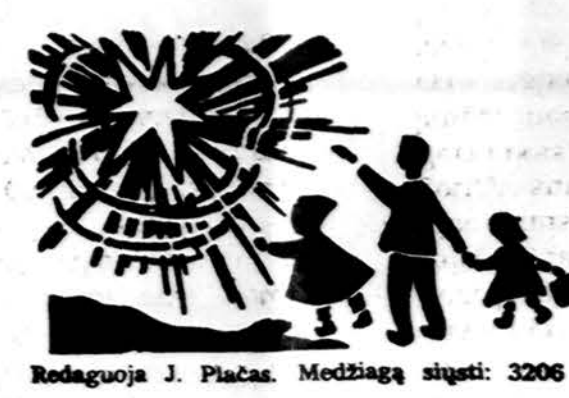
Redaguoja J. Plačas. Medžiagą siųsti: 3206 W. 65th Place, Chicago, IL 60629

ADVOKATAS ALGIRDAS R. OSTIS 201 E. Ogden Ave., Ste. 18-2 Hinsdale, IL 60521 Tel. (708) 325-3157 Valandos pagal susitarimą