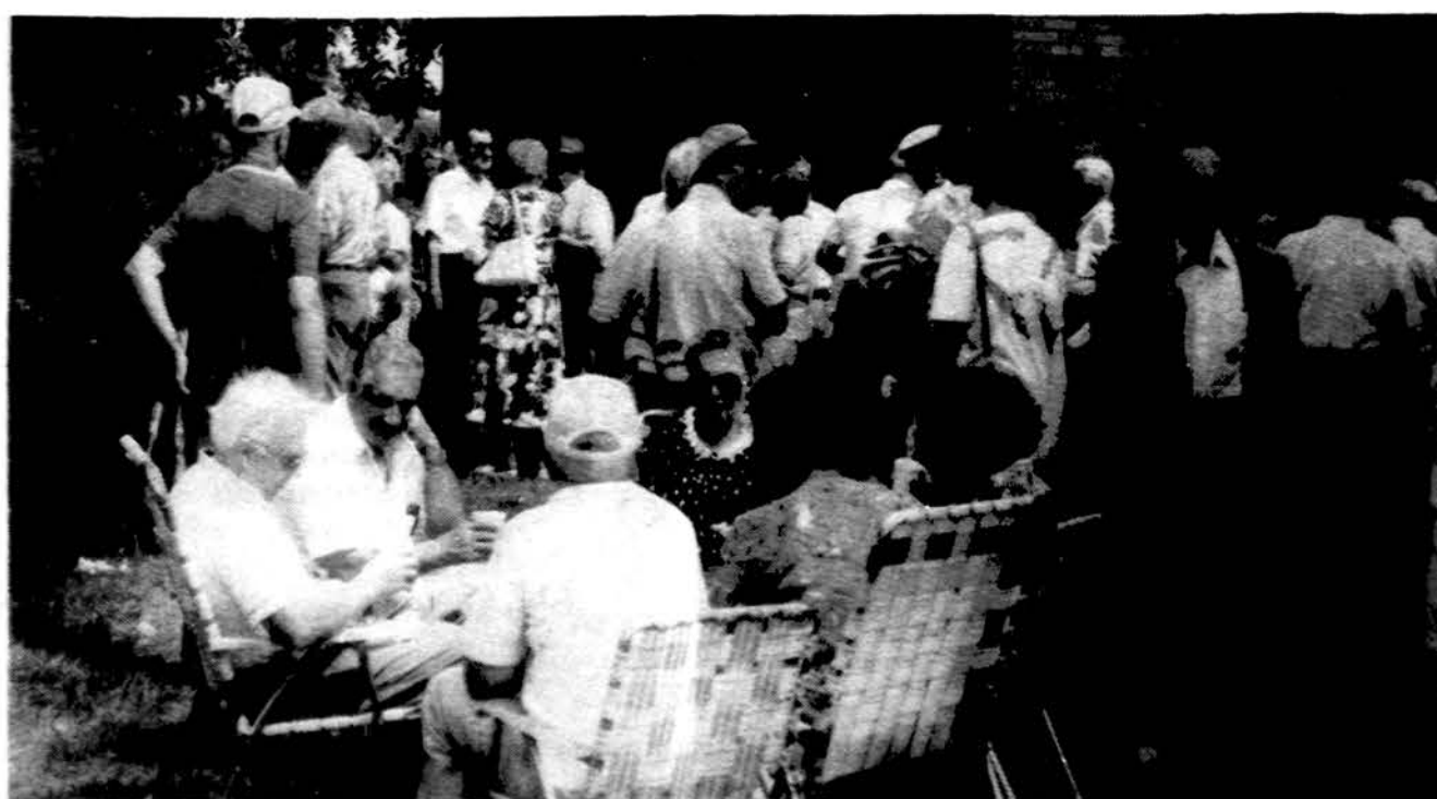
Smagus vasariškas pasižmonėjimas Lemonte.

Mūsų adresas: Lietuvos Architektų Sąjunga Kalvarijų 1, 2600 Vilnius, Lithuania