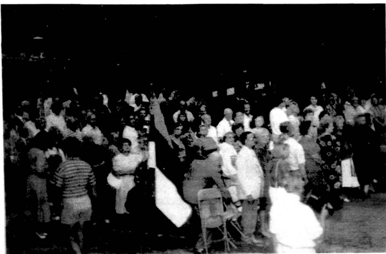
Vaidelis iš susibūrimo Lietuvių centre Lemonte.