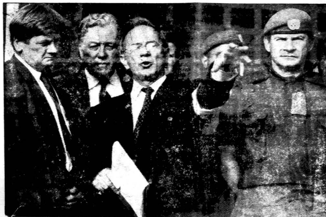
Naujasis Jugoslavijos Ministras pirmininkas Milan Panić (centre) atvykęs į Sarajevo, Bosnija-Hercegovinoje, pripažįsta, kad jo susitikimas sekmadienį su Bosnijos prezidentu Alija Izetbegović mažai padėjo taikai pasiekti. Dešinėje stovi Maj. gen. Lewis McKenzie, Jungtinių Tautų pajėgų vadas.

Amerikos pašto administracijos, Tarptautinio vystymo programos bei Pasaulinio pašto sąjungos atstovai lankėsi Lietuvoje.