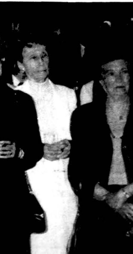
Tautinio „Lietuvos“ ansamblio šokėjos koncerto metu Drury Lane teatre Chicagoje.

Prašykime, kad būtų išleistas 1993 m. sukaktuvinis pašto ženklas ir jame įamžintas S. Dariaus ir S. Gireno vardai. Pašto