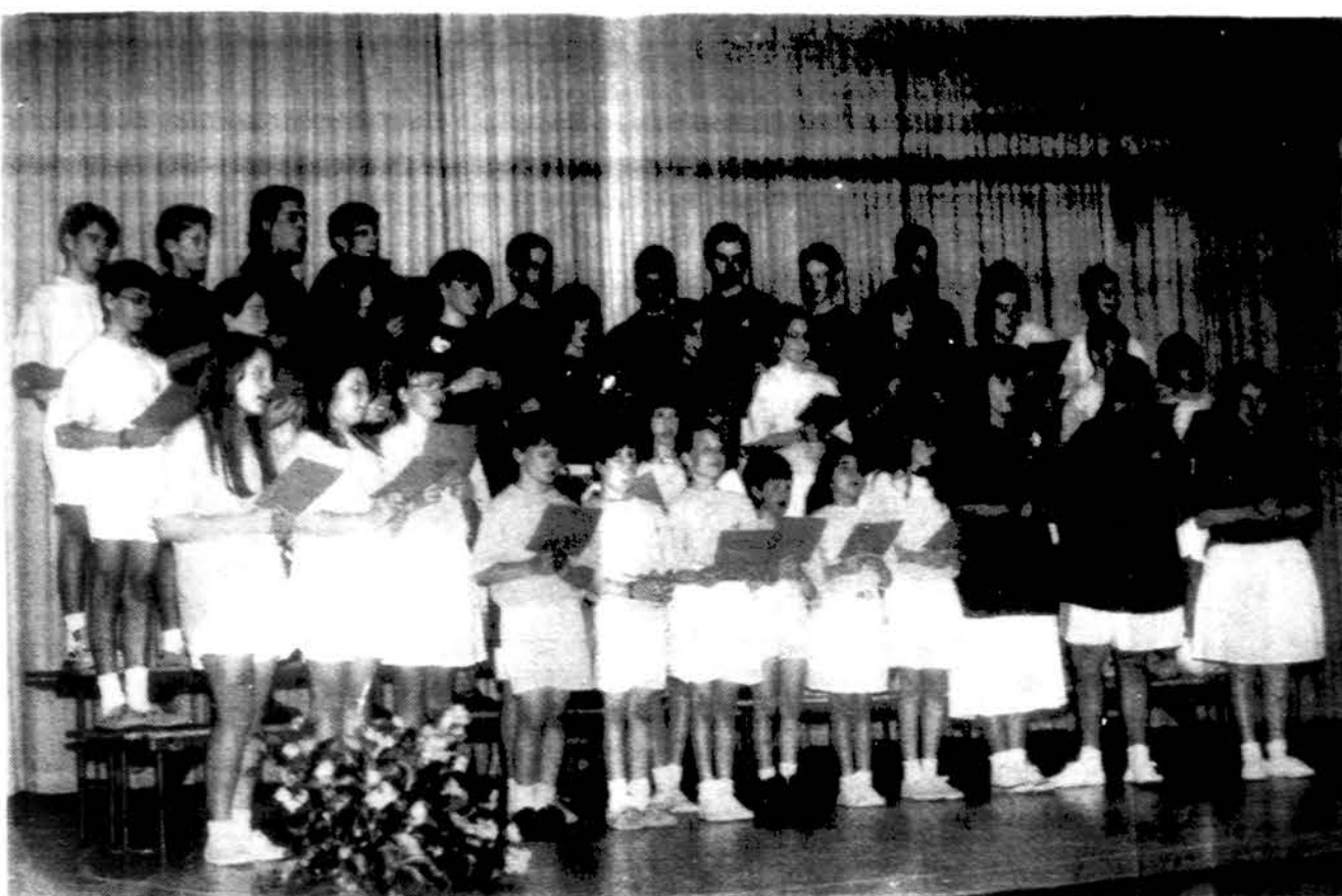
Detroito „Žiburio“ lituanistinės mokyklos mokiniai mokslo metų užbaigimo programoje.

Šias 27-tas golfo žaidynes rengia Detroito sporto klubas „Kovas“. Informacijas teikia Vytas Petrušis, 30115 Brookview, Livonia, MI, 48152. Tel. 313-525-0294 ar 313-584-0466. l.m.