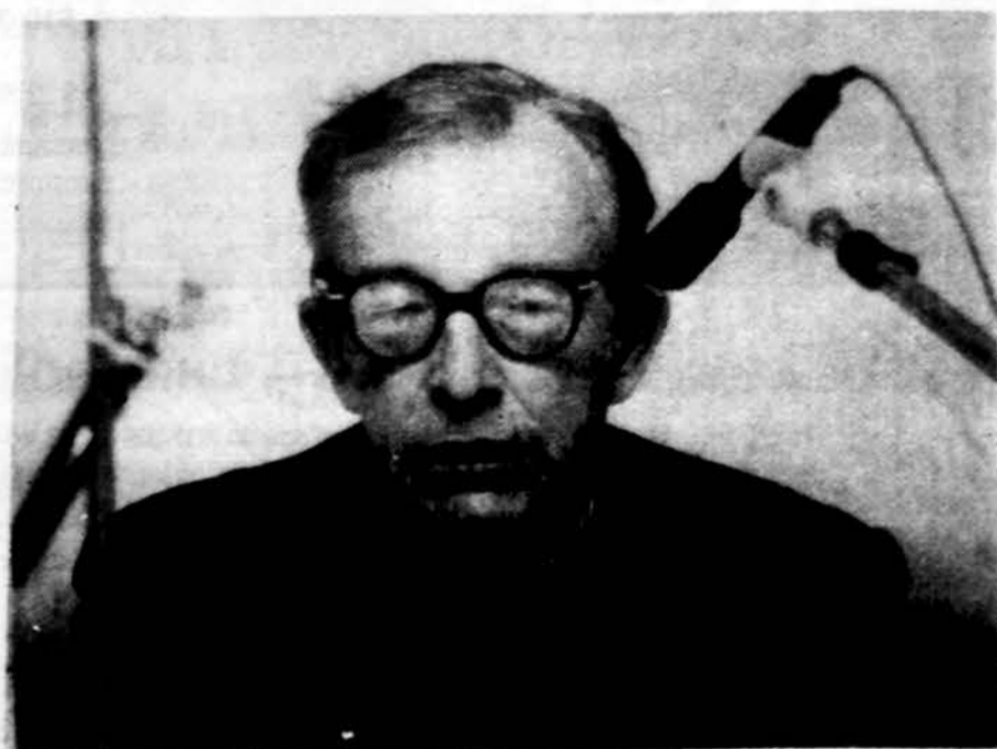
Ambasadorius Stasys Lozoraitis spaudos konferencijoje.