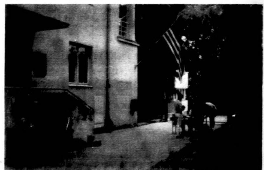
JAV ambasada Vilniuje.