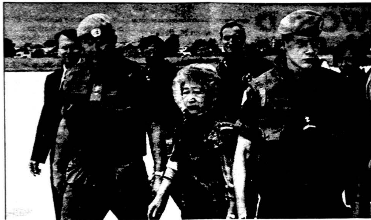
Jungtinių Tautų taikos prižiūrėtojai su vadu maj. gen. Lewis MacKenzie (kairėje) lydi JT Komisionierę pabėgėliams Sadako Ogata (viduryje), jai lankantis Sarajevo mieste Bosnija-Herzegovinoje. Jei JT Saugumo Taryba priimtų rezoliuciją naudoti karinę jėgą užtikrinti maisto ir vaistų siuntų saugumą, ir jiems gresia serbų puldinėjimas. Serbų sukiliųjų vadas pareiškė, kad remtų JT dalinių kišimąsi tik siuntų apsaugai, bet jei iš tos pozicijos imtų pulti serbus, tuomet jie gintųsi.

Bet Saddam Husseiną tebespaudžia kurds, jų valdžią vadinamas nelegalia ir vyriausybės ministrus vadindamas ban-