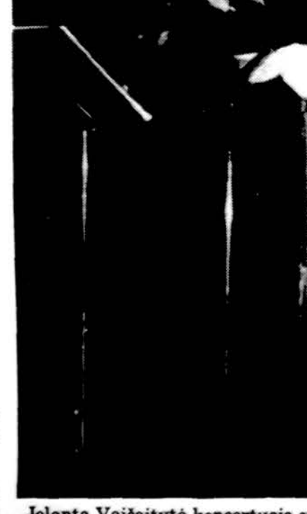
Jolanta Vaičiaityte koncertuoja su bibliotekininku Jean-Claude Bessennot.