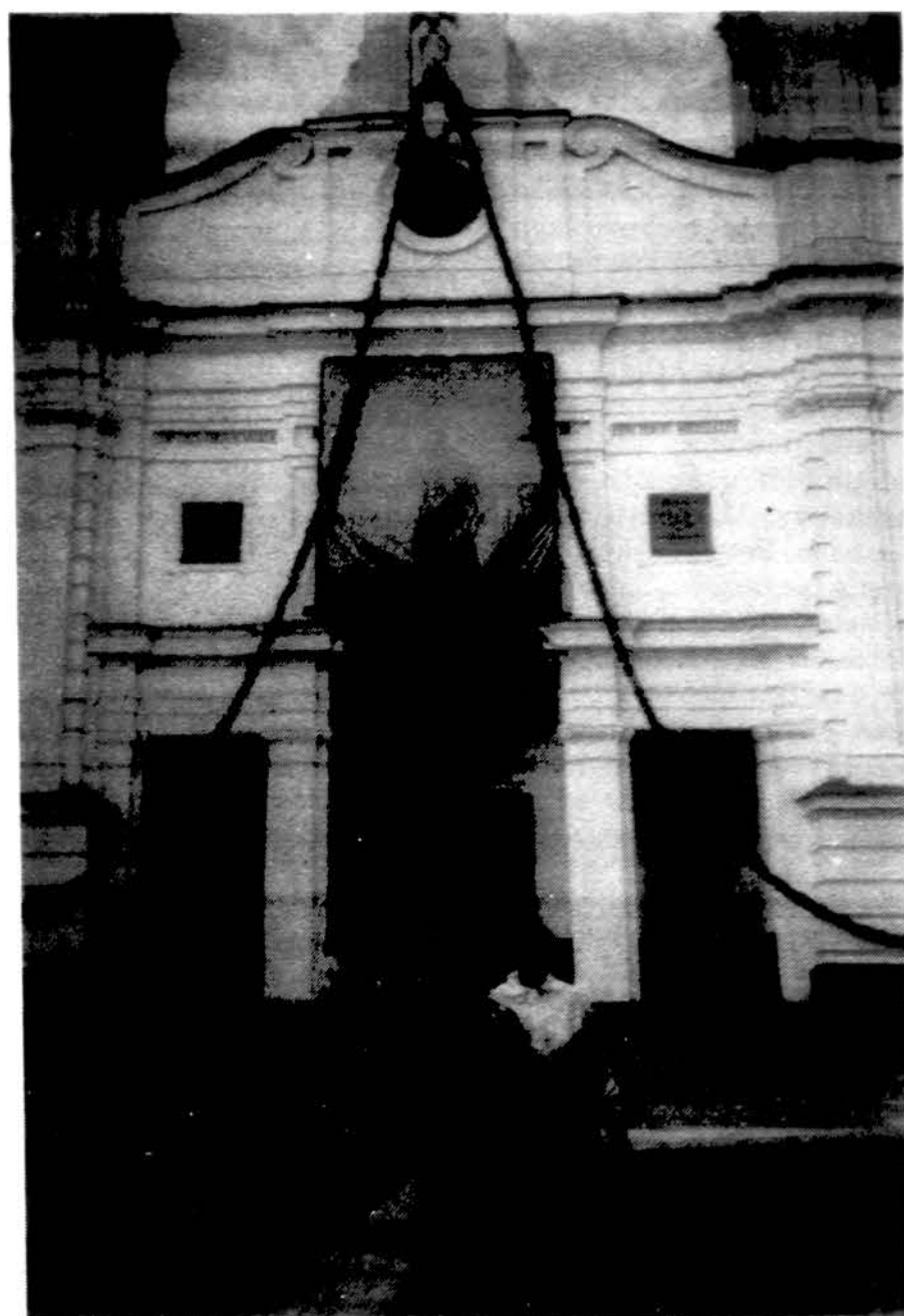
Prie bažnyčios durų Marijampolėje, lankantis „Grandžiai“.