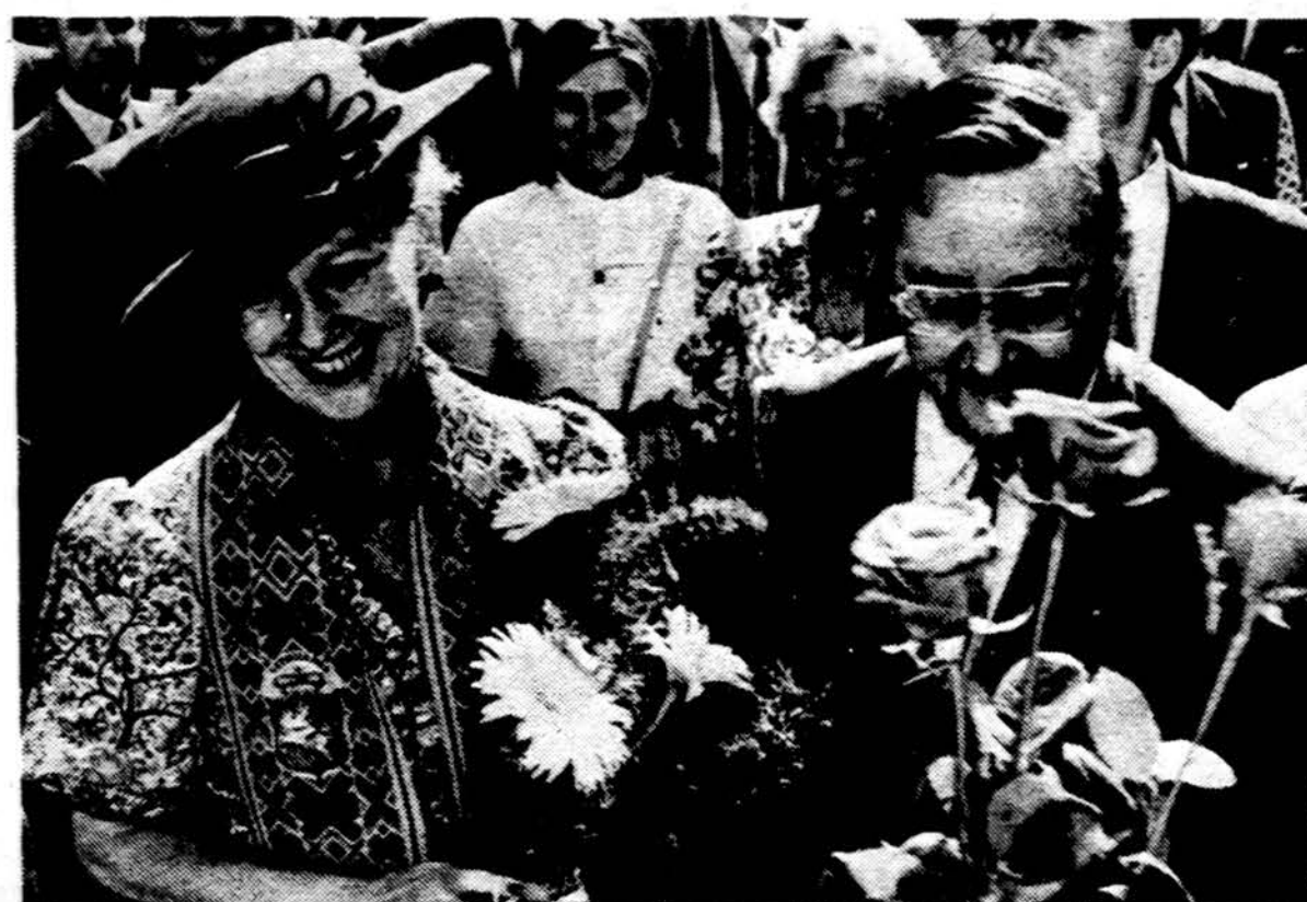
Danijos karalienė Margarethe II su prezidentu Landsbergiu rugpjūčio 1 d. lankėsi Kalvarijų turguje Vilniuje ir vėliau, jiems apsilankius Aušros Vartuose, atėjo prie Arkos galerijos, kur karalienė atidarė šią dizaino galeriją. Po to jie dar buvo nuvažiavę į buvusį Vilniaus getą ir į Vilniaus arkikatedrą.

Pažymėta tam tikra pažanga, rengiant susitarimus, kylančius iš 1991 m. liepos 29 d. Sutarties tarp Lietuvos Respublikos ir Rusijos Federacijos dėl valstybinių santykių pagrindų.