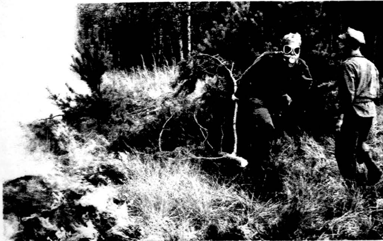
Lenkijoje nuo sausros taip pat kilo dideli miškų ir girių gaisrai, vieną kurių čia matome gesinant dujokaukę dėvintį gaisrininką prie Olszyna miestelio. Latvijoje prie Adazės esančioje Rusijos karo bazės esantis miškas vis iš naujo užsidegė, nes rusai, nežūrint sausros, tebetisia ten karines pratybas, nuo kurių sprogtančių šaudmenų vis užsidega išdžiūvę krūmai ir medžiai.

Saulė teka 5:57, leidžiasi 7:52. Temperatūra dieną 68 F (20 C), naktį 52 F. (11 C), daugiau debesuota, galimybė lietaus. Sekmadienį šilčiau, pirmadienį dar šilčiau, abi dienas dalinai saulėta, galimybė lietaus.