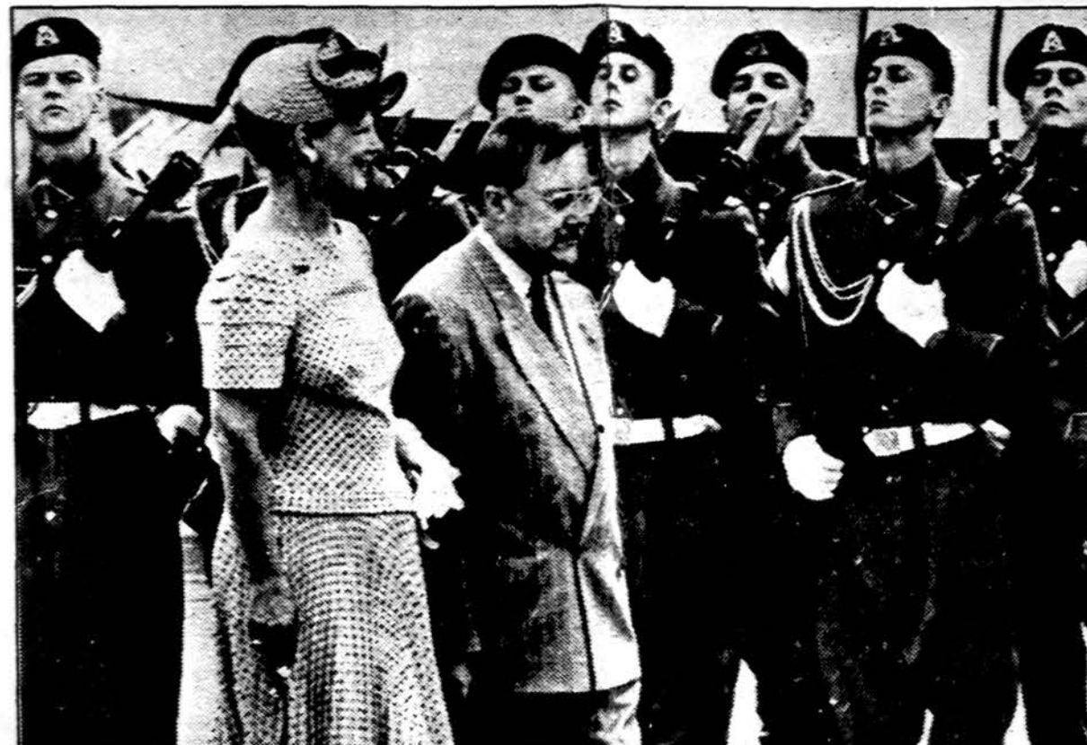
Vilniaus aerouoste liepos 31 d. atskridus Danijos karalienei Margerethe II, ją pasitiko Lietuvos AT pirm. Vytautas Landsbergis su išrikiuota garbės sargyba. Pro juos jis karalienei lydejo iškilmingu kilmu į laukiantį automobilį kortezą, kuriais jie nuvažiavo į Antakalnio kapines, kur padėjo vainikus ant sausio 13 d. bei Medininkuose žuvusiųjų kapų.

Premjeras A. Abišala su žmona š. m. rugpjūčio 17-18 d.