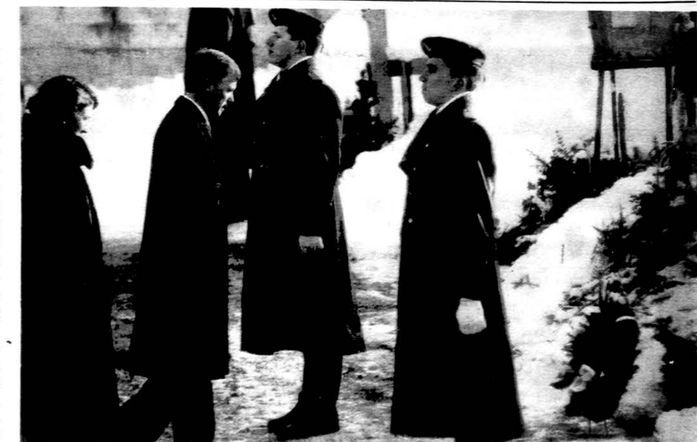
JAV viceprezidentas Dan Quayle su žmona eina pagerbti žuvusiųjų dėl Lietuvos laisvės. Dešinėje – žvalius Lietuvos kariai.