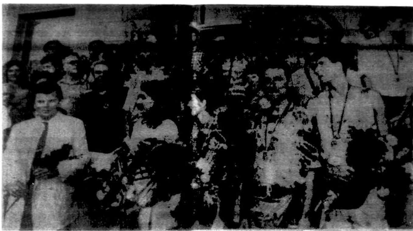
Iš Barcelonos grįžę Lietuvos olimpiečiai Vilniaus aerodrome.

„Vakar įvyko sportininkų spaudos konferencija“.