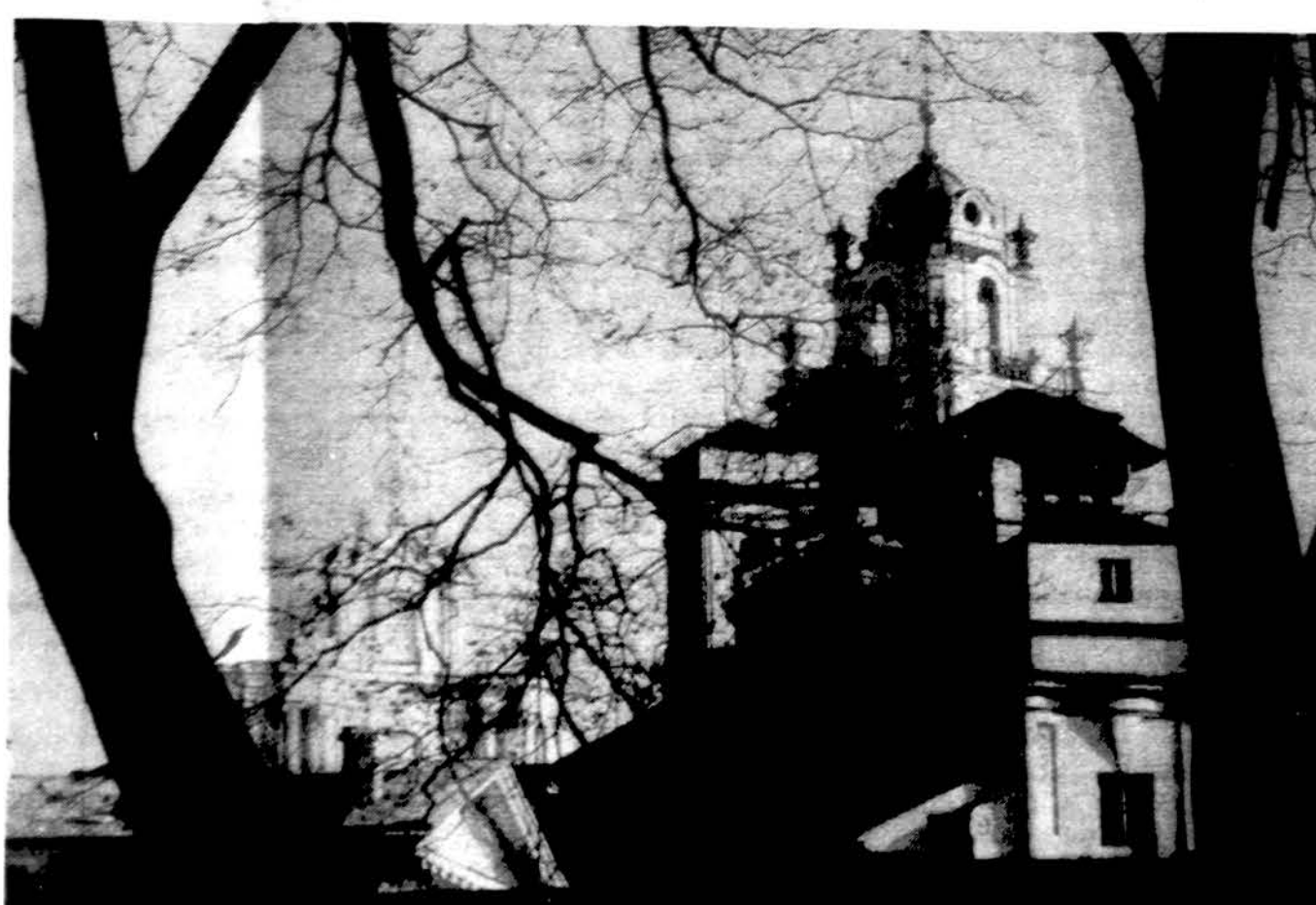
Lietuvos universiteto bokštai Vilniuje

Tel. (1-312) 776-8700 Darbo val. nuo 9 iki 7 val. vak. Šeštad. 9 v.r. iki 1 val. d.