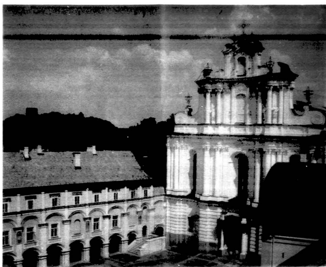
Didysis Vilniaus universiteto kiemas