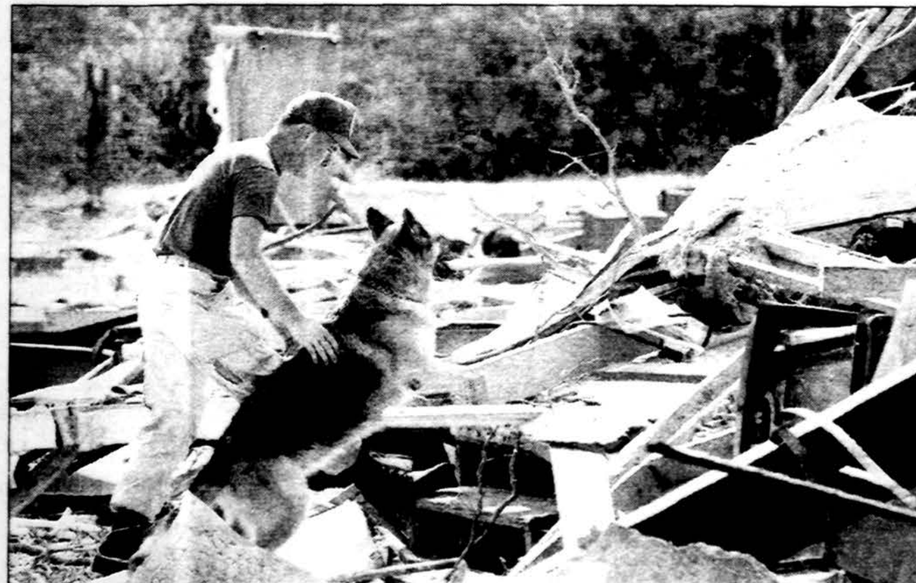
Policininkas su šunimi Floridos Everglades vietovėje ieško lavonų darbininkų stovyklos griuvėsiuose. Uraganui Andrew nusiaubus pietinę Floridą 250,000 žmonių liko be pastogės, nesiseka visiems greitai išvežioti maistą, vandenį ir kitokius reikmenis.

Saulė teka 6:11, leidžiasi 7:33. Temperatūra dieną 75 F (24 C), naktį 51 F (10 C), debesuota, gali palnyti.