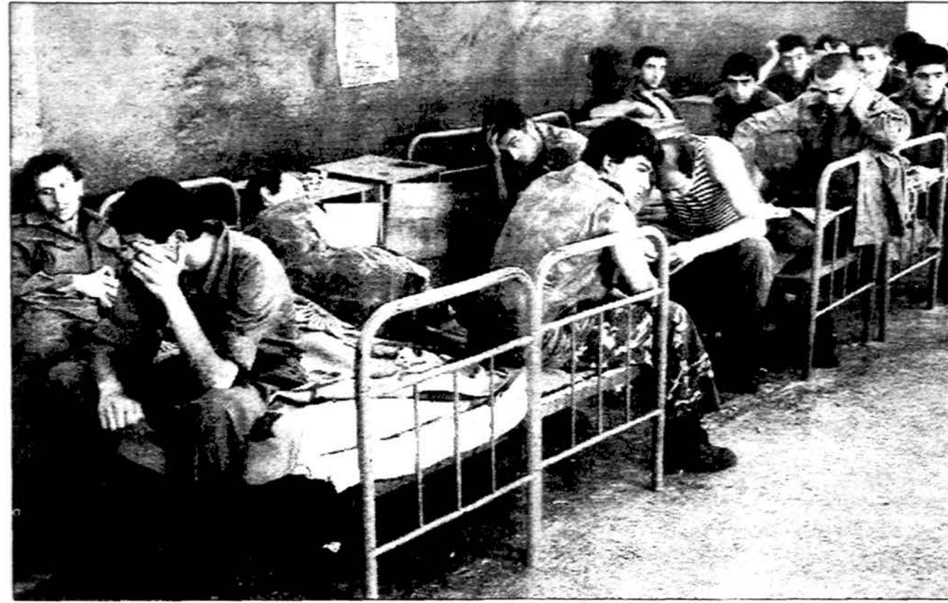
Abchazijos Nacionalinės gvardijos kariai Gruzijos kalėjime Suchumi mieste. Abchazijai pasiskelbus nepriklausomai nuo Gruzijos liepos mėnesį, ten vyksta kovos, Gruzijai neleidžiant jiems atsikirti.

Vilnius, rugpjūčio 25 d. — Lietuva numato nusipirkti vieną pakrančių sargybos laivą iš Rusijos Baltijos laivyno, patvirtino Lietuvos gynybos ministras Audrius Butkevičius. Pagal Rusijos ITAR-TASS agentūros pateiktą žinią, Ministras paneigė Baltijos laivyno pareigūno anksčiau padarytą pasisakymą, kad į šią transakciją įeis